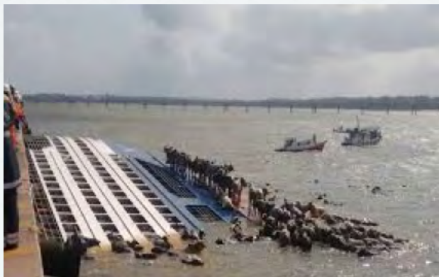
Navio Haidar: transporte de bovinos. Grande impacto ambiental devido aos animais putrefatos. Gasto de R$50 milhões para remoção do navio, sendo executado pela União.