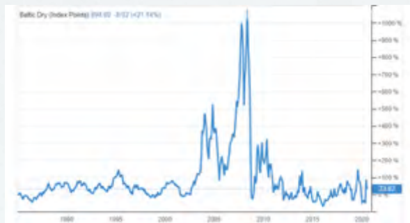
Figura 1 – Baltic Dry Index