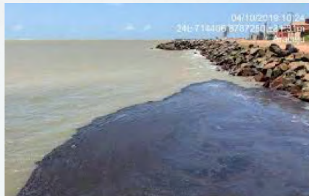
Vazamento de óleo na costa Nordeste: grande prejuízo ambiental, causado por embarcação que não tinha compromisso com o país.

IMPORTANTE: pelas regras atuais do afretamento a tempo (sem as normas do BR do Mar), quem controla a navegação é o contratado estrangeiro! Permitir o livre afretamento de qualquer empresa estrangeira significa colocar a cabotagem brasileira nas mãos de outros países. Esta situação não permite a criação de um mercado estruturado, pois os usuários estarão sempre dependendo do mercado internacional, e dificulta a responsabilização dos armadores em casos de acidentes.