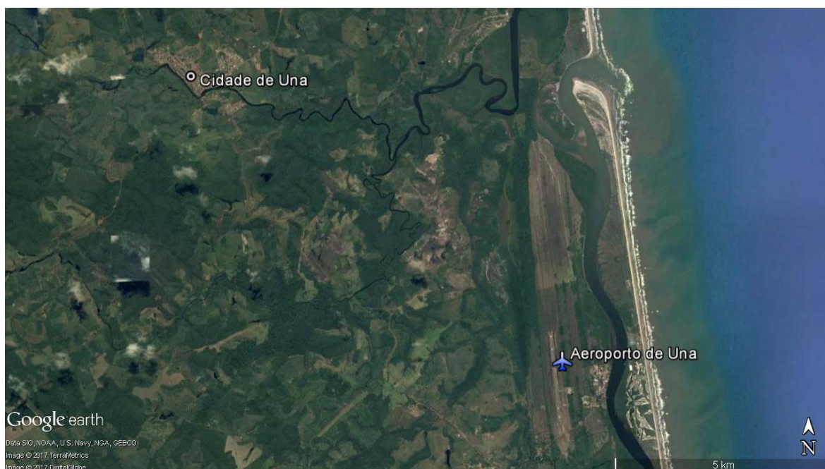
Figura 2 – Localização geográfica do Aeroporto de Una Fonte: Google Earth (2017). Elaboração: Labtrans/UFSC (2018)

O Aeroporto de Una (SBTC) localiza-se em município de mesmo nome, no estado da Bahia, e apresenta uma distância de 16 quilômetros do centro da cidade. A Figura 2 representa a imagem de satélite do aeroporto e sua região de entorno.