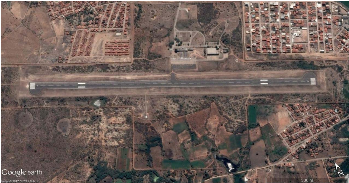
Figura 3 – Imagem via satélite do Aeroporto de Una Fonte: Google Earth (2017). Elaboração: LabTrans/UFSC (2018)

As unidades territoriais de planejamento (UTPs) delimitam uma área de captação direta e próxima ao aeródromo da região. O aeródromo de Una está localizado dentro da UTP de Ilhéus, a qual compreende quatro municípios, conforme mostra a Figura 4.