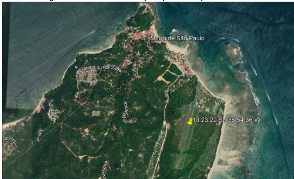
Figura 1 – Aeródromo Lorenzo (SNCL) e o Município de Cairu - BA