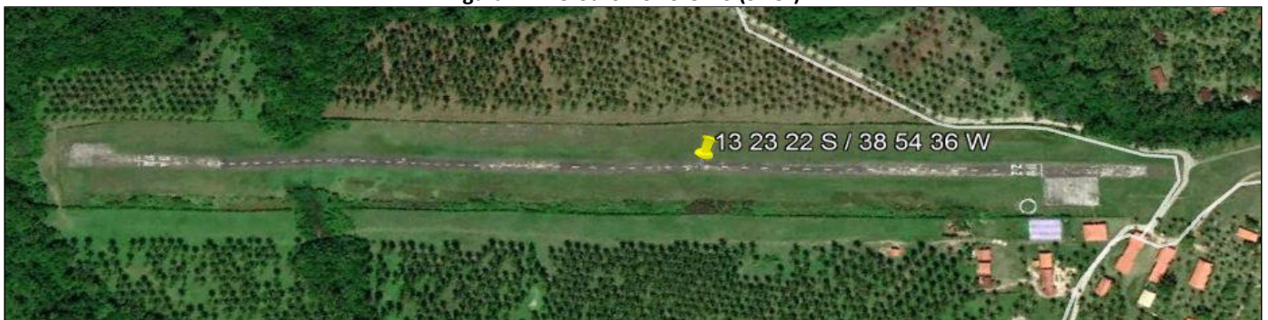
Figura 2 – Aeródromo Lorenzo (SNCL)

Fonte: Google Earth , imagem de 24/02/2017, acesso em 11/11/2019.