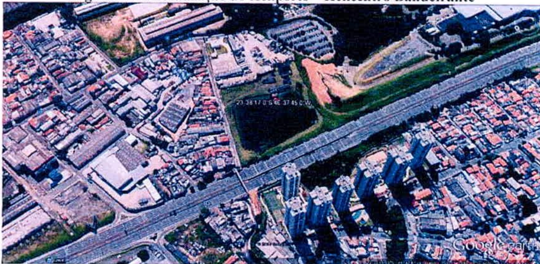
Figura nº 1: Localização do Heliporto – Helicentro Bandeirante

Fonte: Google Earth. Acesso em 13/01/2016