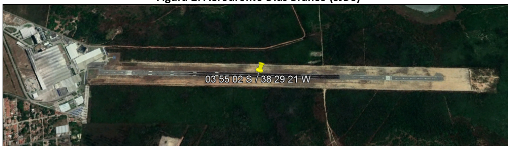
Figura 2: Aeródromo Dias Branco (SJDS)