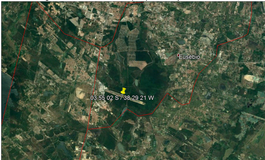
Figura 1: Aeródromo Dias Branco (SJDS) e o Município de Eusébio - CE