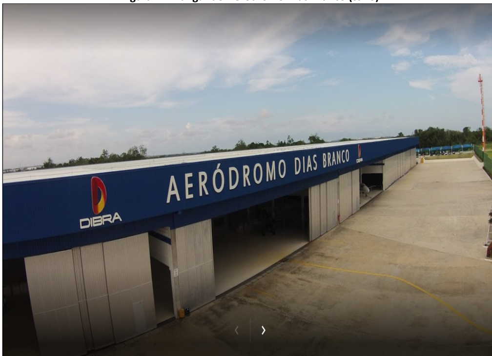
Figura 4 – Hangar do Aeródromo Dias Branco (SJDS)