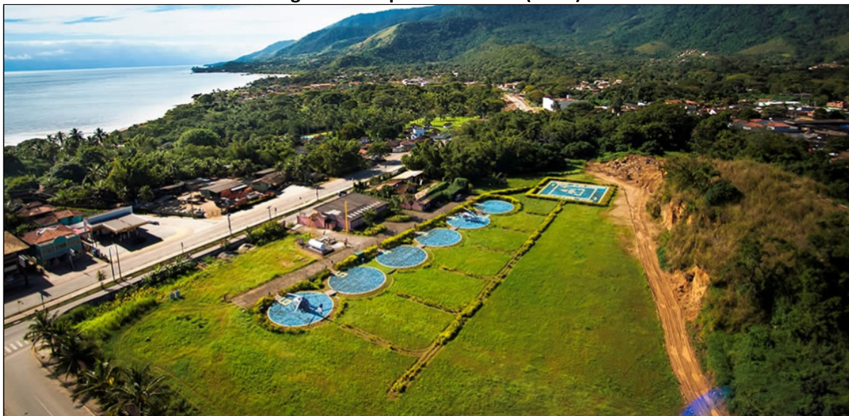
Figura 3: Heliponto Maroum (SJDO)