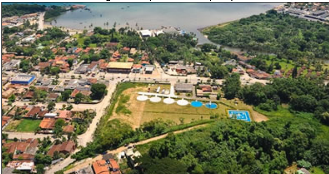
Figura 4: Heliponto Maroum (SJDO)