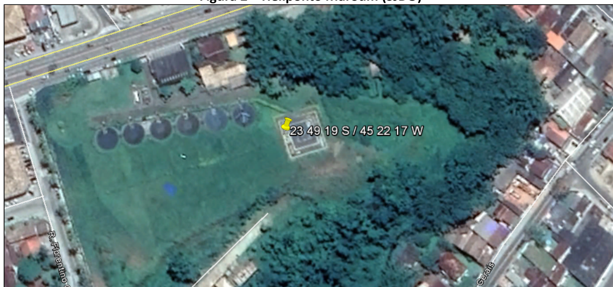
Figura 2 – Heliponto Maroum (SJDO)

Fonte: Google Earth , imagem de 09/12/2018, acesso em 25/02/2019.