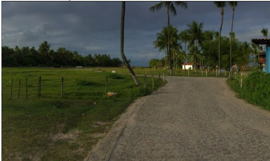
Figura 4: Aeródromo Lorenzo (SNCL) - Acesso.

11. As imagens abaixo, disponíveis no Google Maps [4] , mostram maiores detalhes do aeródromo em comento: