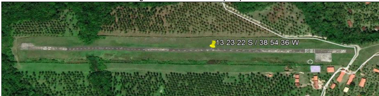
Figura 2 – Aeródromo Lorenzo (SNCL)