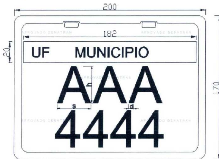
Figura nº 2