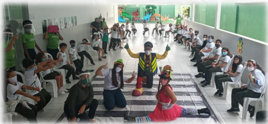
PROJETO DETRAN VAI À ESCOLA