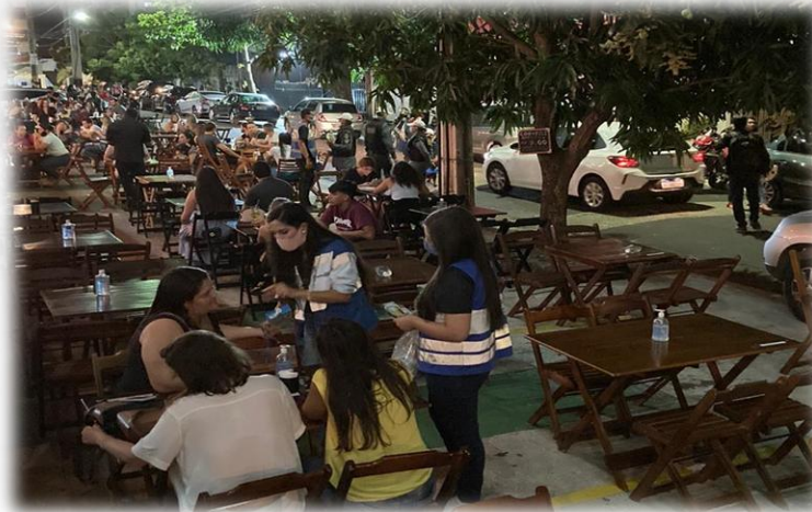
PROJETO DIREÇÃO CERTA