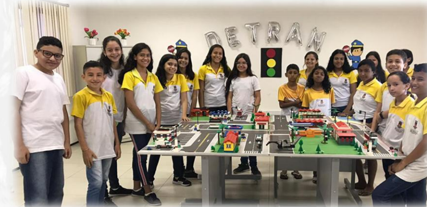
Projeto Escolas de Educação para o Trânsito