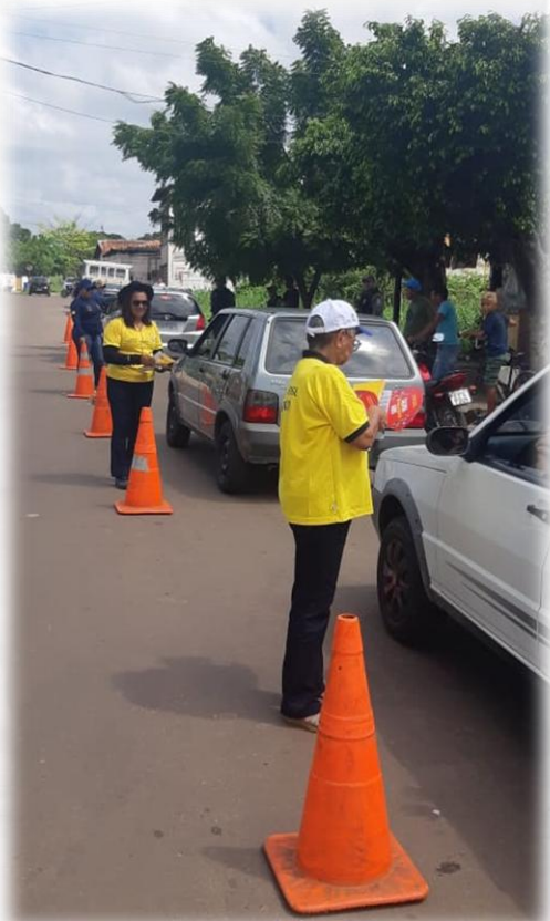
PROJETO DETRAN NAS PRAÇAS