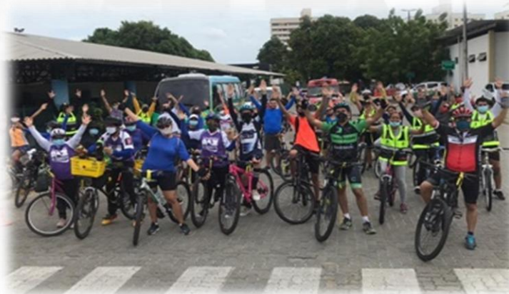
Grupo de Teatro Comédia Cearense