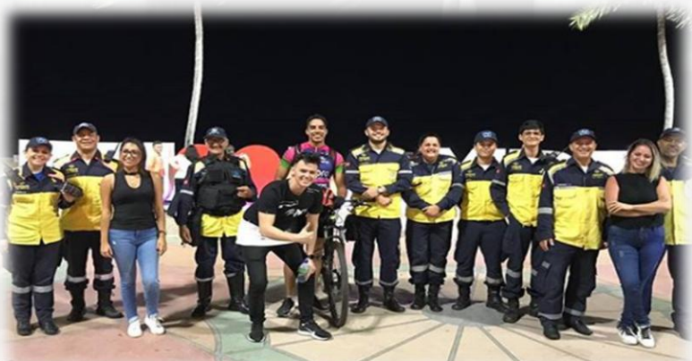
PROJETO OPERAÇÃO LEI SECA