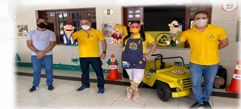
Turma da Lily