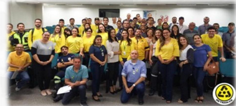
Projeto Multiplicadores de Educação para o Trânsito