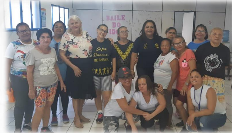
PROJETO IDOSOS NO TRÂNSITO