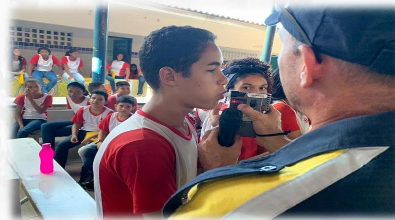
PROJETO MUNICIPALIZANDO O TRÂNSITO