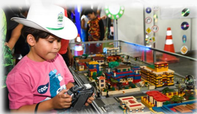
Passeio Ciclístico SNT