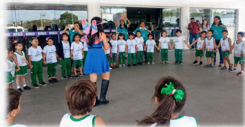
PROJETO DETRAN VOLANTE