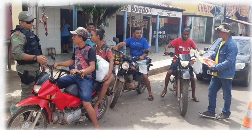
PROJETO OPERAÇÃO LEI SECA