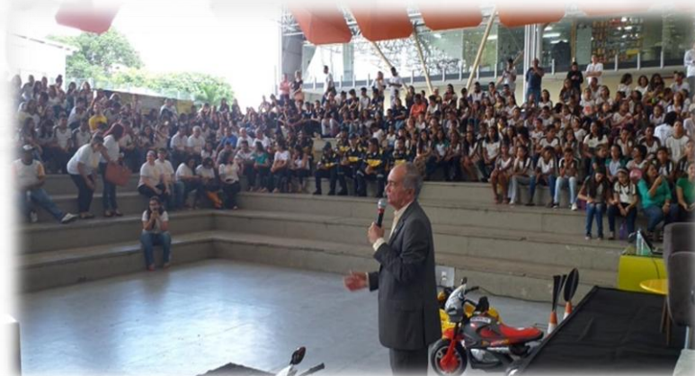
PROJETO ARENA TRÂNSITO