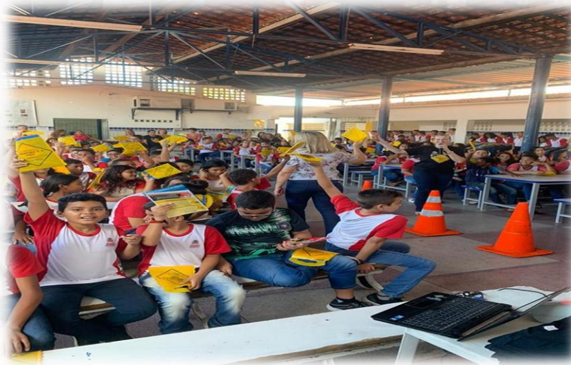
PROJETO EDUCANDO PARA O TRÂNSITO