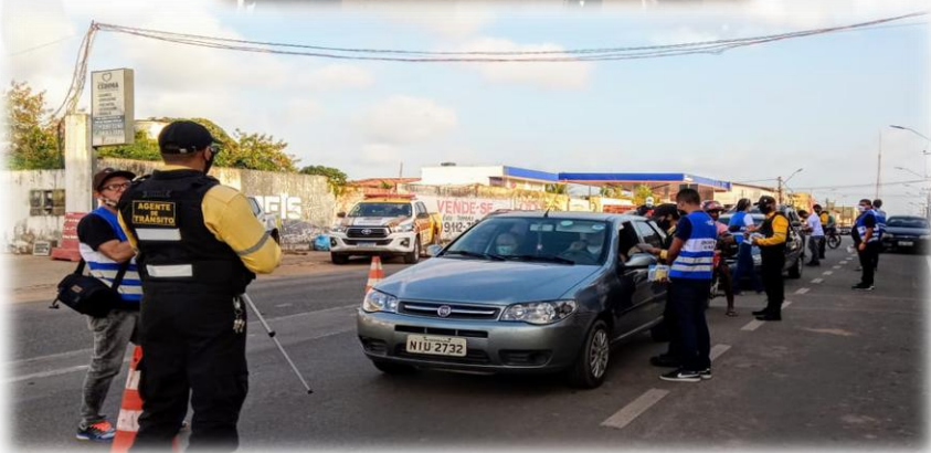
PROJETO SE LIGA NA VIA