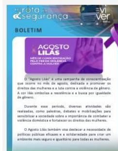
Figura 8 – Informes mensais