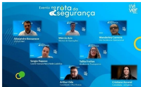
Figura 1 – 1ª Live 2022

Abaixo alguns materiais que evidenciam a execução das etapas do Programa Na Rota da Segurança.