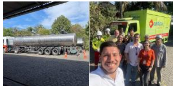
Figura 2 – Simulado 2022