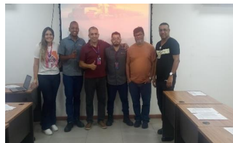
Figura 4 – Ciclo de Treinamento Check List 2023