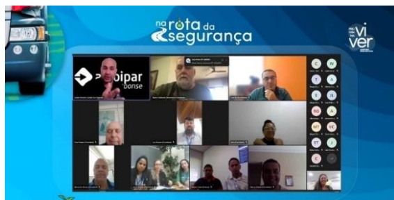
Figura 3 – Treinamento Anual de Segurança – 2022