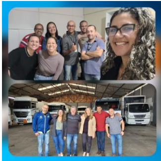
Figura 5 – Acompanhamento in loco nas transportadoras 2023