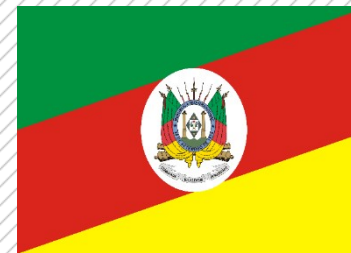
Rio Grande do Sul

Dos 368 municípios nota A_{icf} , 119 são do Rio Grande do Sul (32%).