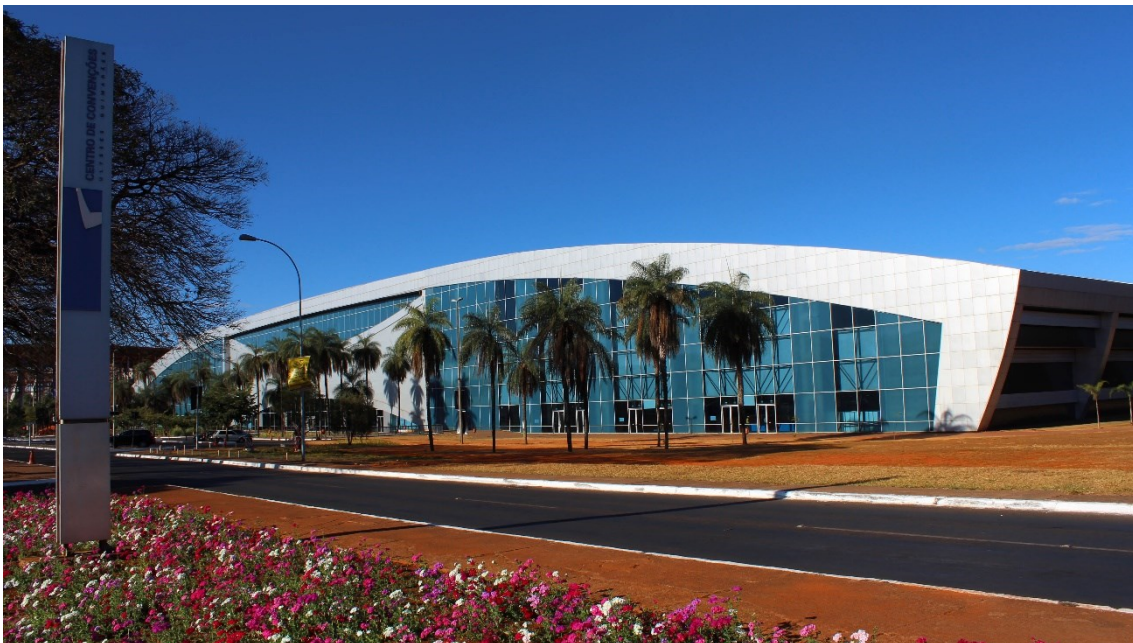
Figura: Foto da fachada do Centro de Convenções Ulysses Guimarães

Acesse a localização: https://g.co/kgs/bsXyxo5