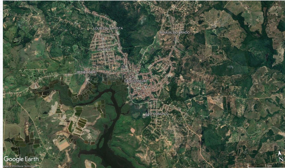
Fig. 7 – Sede de São Cristóvão