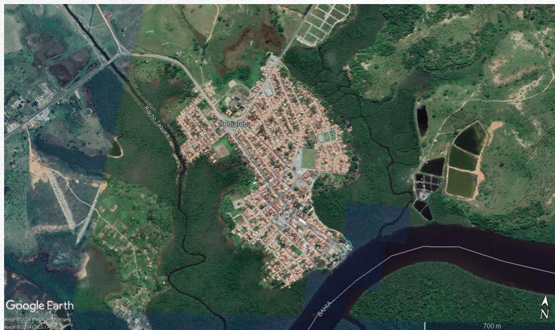
Fig. 4 – Sede de Indiaroba