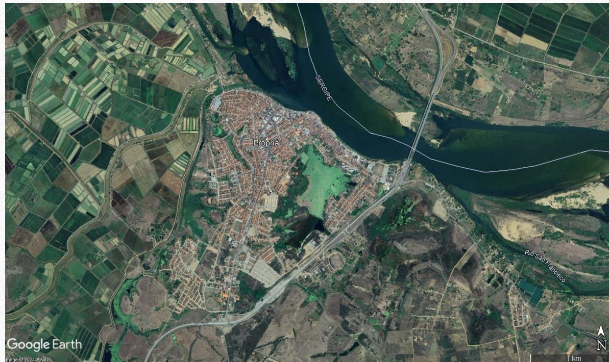
Fig. 10 – Sede de Propriá