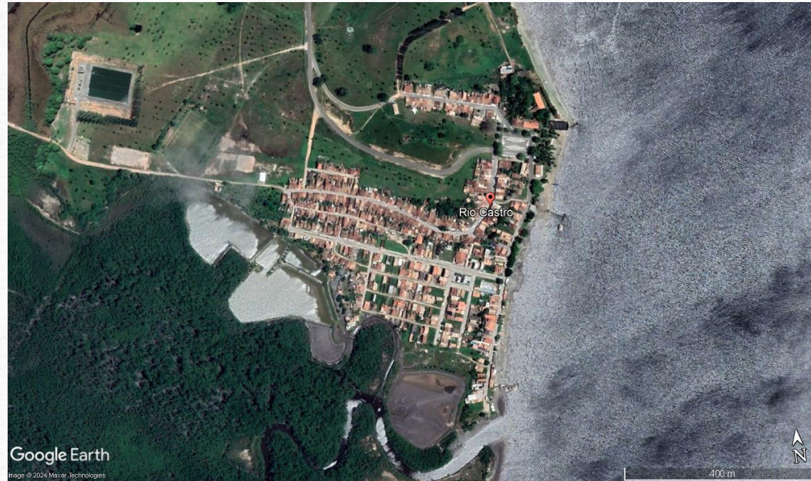
Fig. 6 – Crasto