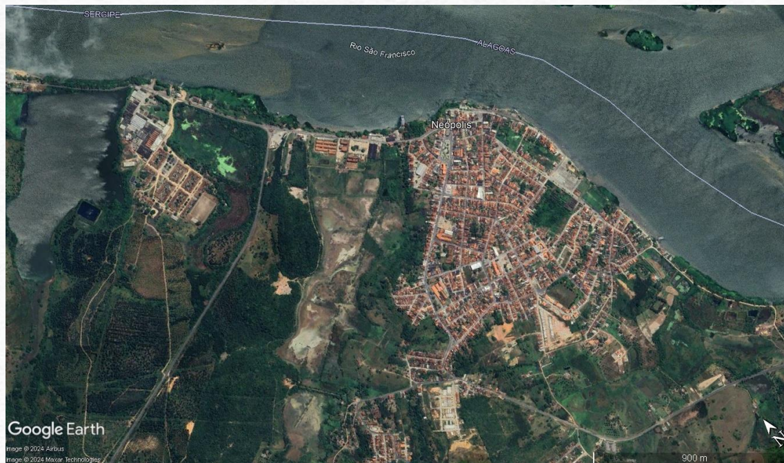
Fig. 9 – Sede de Neópolis