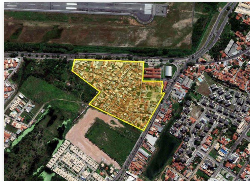
Fig.11 - Comunidade "malvinas", bairro Aeroporto