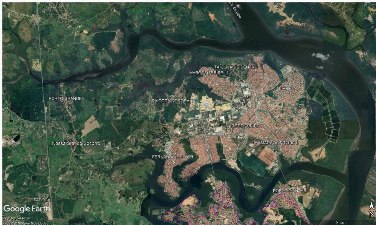
Fig. 8 – Sede de Nossa Senhora do Socorro