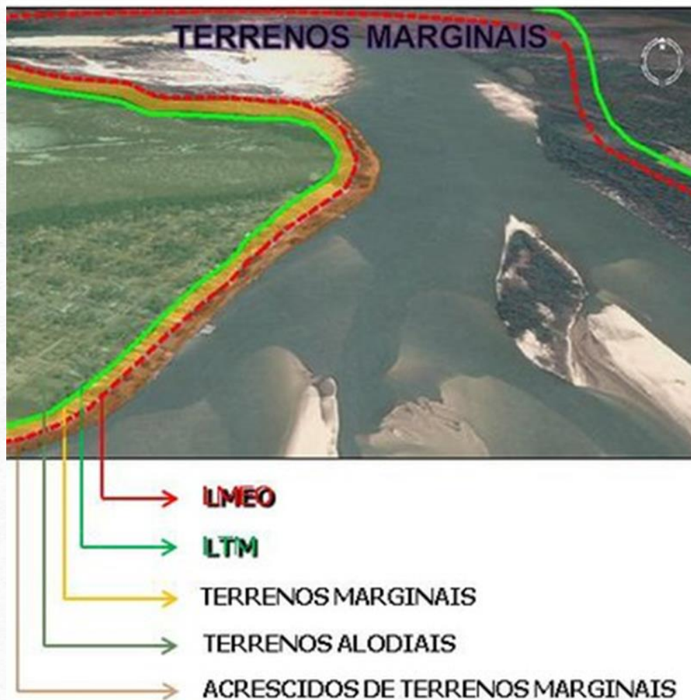
Fig. 3 – Terrenos marginais e seus Acrescidos