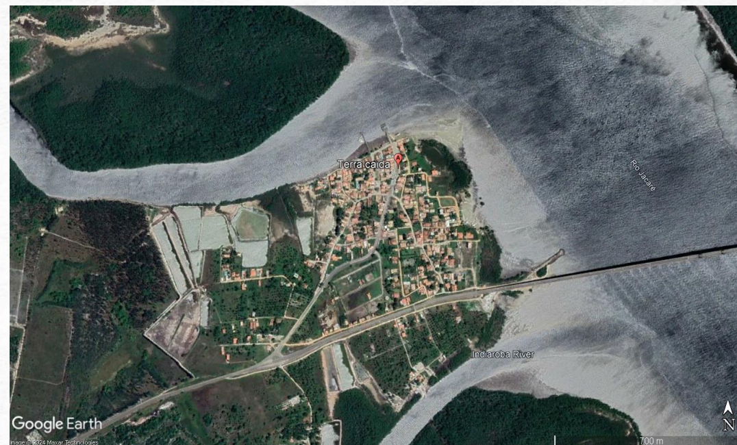
Fig. 5 – Terra Caída