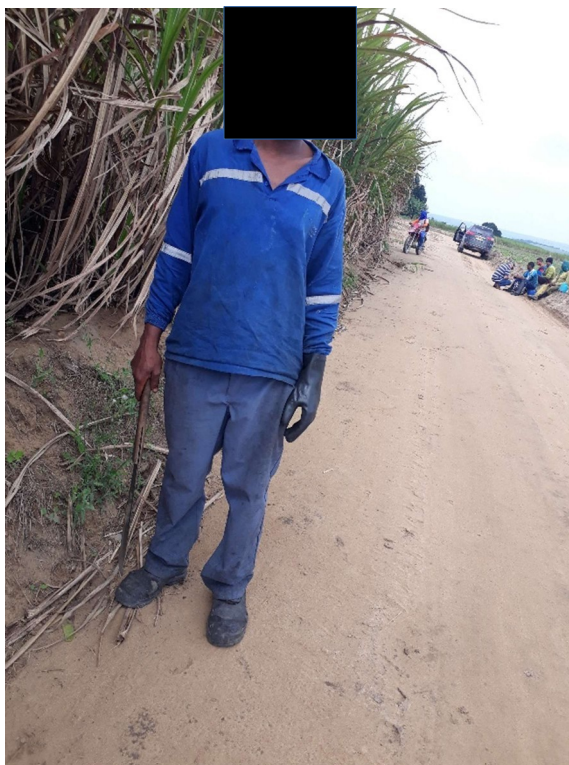
Figura 4: Bota rasgada, ausência de luva de proteção, perneira e óculos. EPI adquirido com recurso próprio.