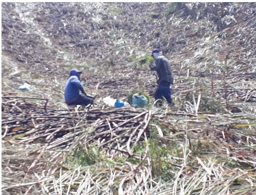
Figura 2: empregados fazendo refeição sem nenhuma proteção contra intempérie.

Em entrevista realizada com os trabalhadores estes declararam: "QUE não tem local para comer. QUE "a gente come no meio da palha"" Um outro trabalhador declarou: "QUE a tenda para refeição tem que vir no ônibus, mas que também não tem."