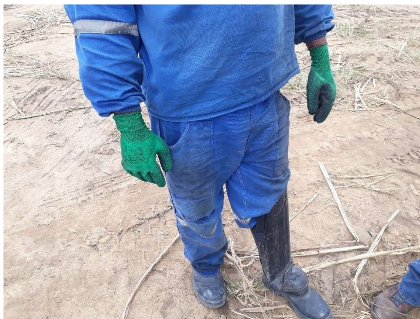
Figura 3: : Ausência de bota, luva de proteção, perneira. EPI adquirido com recurso próprio.

Em 09/12/2019, o autuado em epígrafe foi novamente notificado, através da Notificação para Apresentação de Documentos. 120/2019, a apresentar, no dia 12/12/2019, o comprovante de compra e entrega de equipamento de proteção individual dos 45 (quarenta e cinco) empregados atingidos. Todavia, na data marcada o empregador novamente não exibiu a documentação.