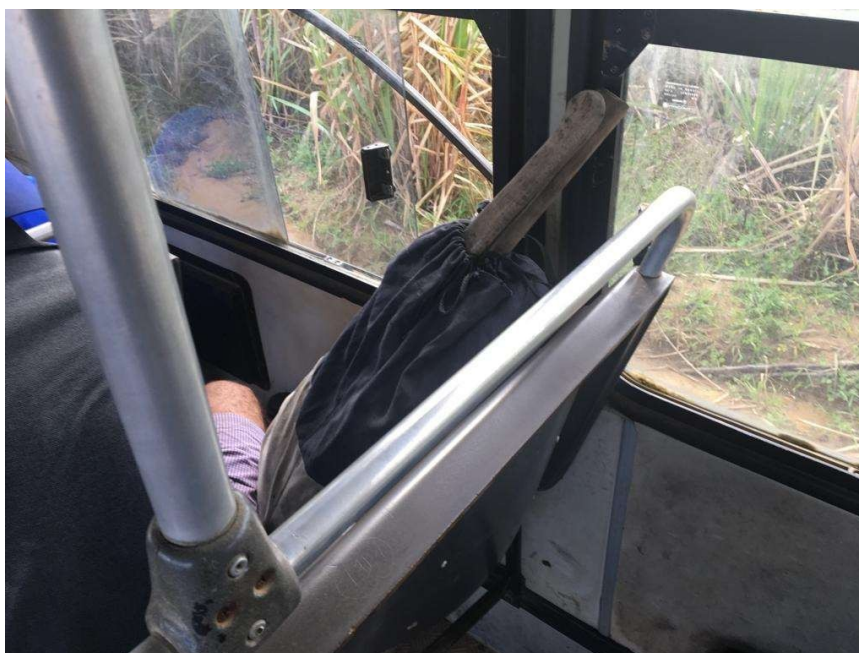
Figura 6: Ferramentas transportadas no interior do veículo com os empregados;

passageiros não observou o disposto no art. 13 da Lei nº 5.889/1973, c/c item 31.16.1, alíneas "a" e "d", da NR-31 da NR-31, com redação da Portaria nº 86/2005.