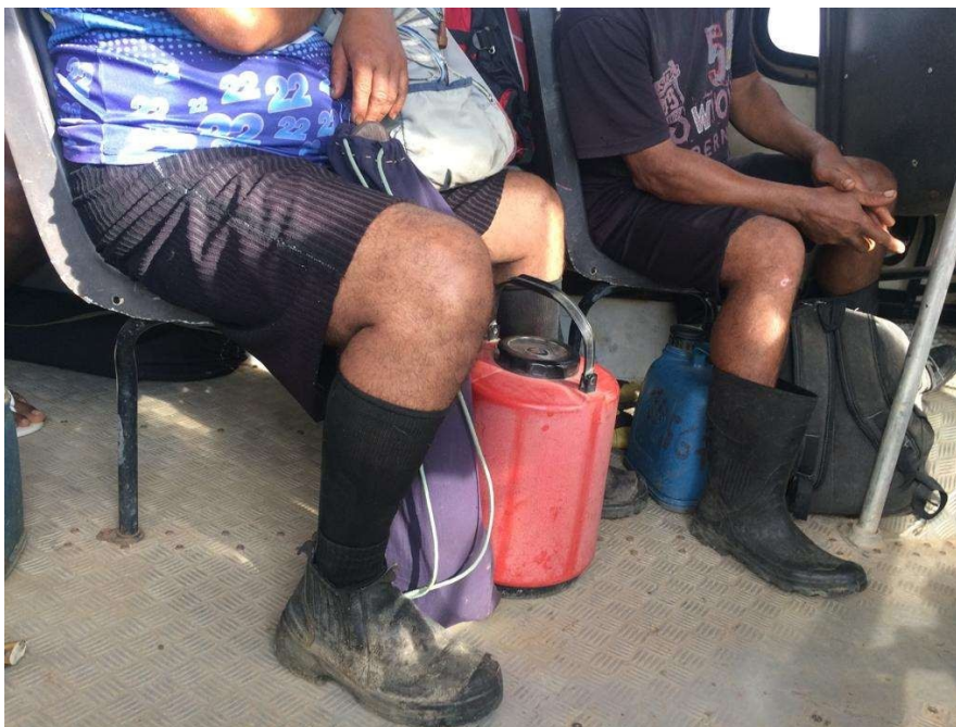
Figura 5: facão sem bairha, transportado em bolsa de tecido adquirida pelo empregado.