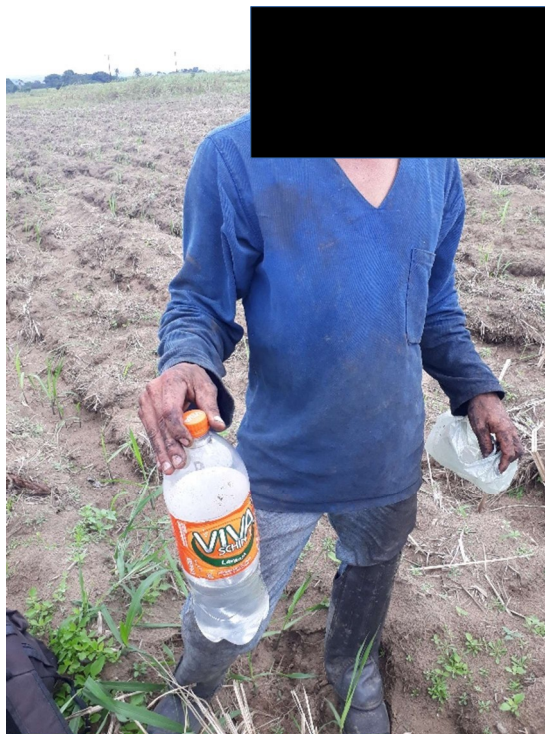
Figura 7: Água trazida pelo trabalhador armazenada em garrafa tipo PET.