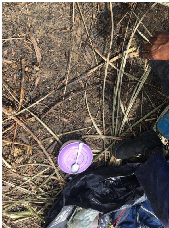
Figura 1: vasilha plástica para armazenamento de alimentos adquirida pelo empregador.

Em 09/12/2019, o autuado em epígrafe foi novamente notificado, através da Notificação para Apresentação de Documentos. 120/2019, a apresentação dia 12/12/2019, o comprovante de compra e entrega marmitas dos 45 (quarenta e cinco) empregados atingidos. Todavia, na data marcada o empregador novamente não exibiu a documentação.