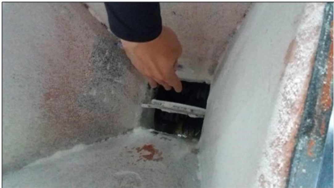
Imagens: Zonas de perigo das máquinas sem qualquer tipo de proteção.