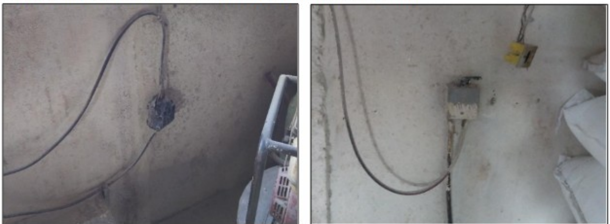
Imagens: Instalações elétricas das máquinas da fábrica de farinha.

As instalações elétricas do local também estavam em condições ruins, sem qualquer respeito as normas básicas do setor, notadamente a NBR 5410 (Instalações elétricas de Baixa Tensão). Dentre outras irregularidades encontradas, podem ser citadas: tomadas em mau estado de conservação e não identificadas quanto à tensão; fiações expostas e sem proteção por eletrodutos; disjuntores abertos, sem proteção por quadros; fios e derivações penduradas à baixa altura, com gambiarras, sem dupla proteção; ausência de quadro de distribuição; ausência de painel de controle das máquinas; ausência de DDRs.