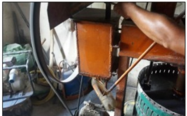
Imagens: Transmissões de força das máquinas completamente expostas.