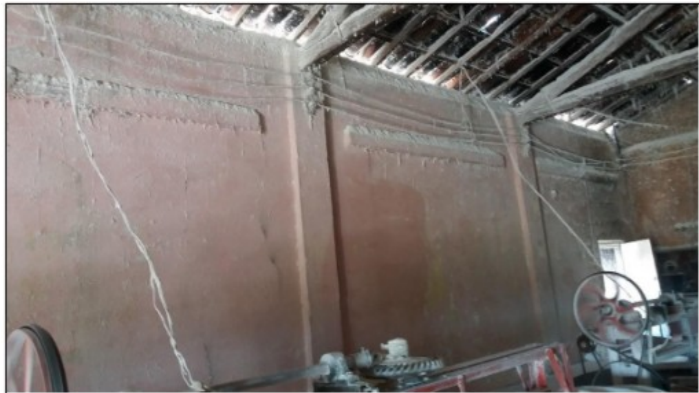
Imagens: Instalações elétricas das máquinas da fábrica de farinha.