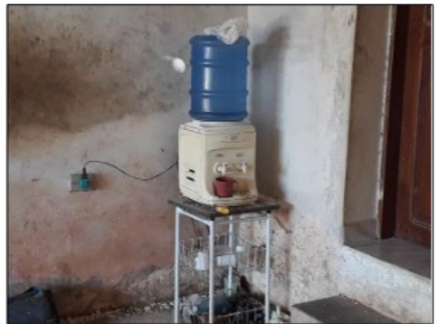
Imagens: Recipiente onde era armazenada a água fornecida para consumo. Copos coletivos usados pelos trabalhadores.