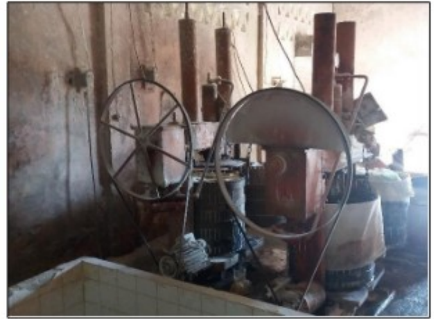
Imagens: Transmissões de força das máquinas completamente expostas.