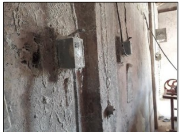
Imagens: Comandos de partida de duas máquinas da linha de produção, chave tipo "Lombard", cujo uso é proibido pela legislação.