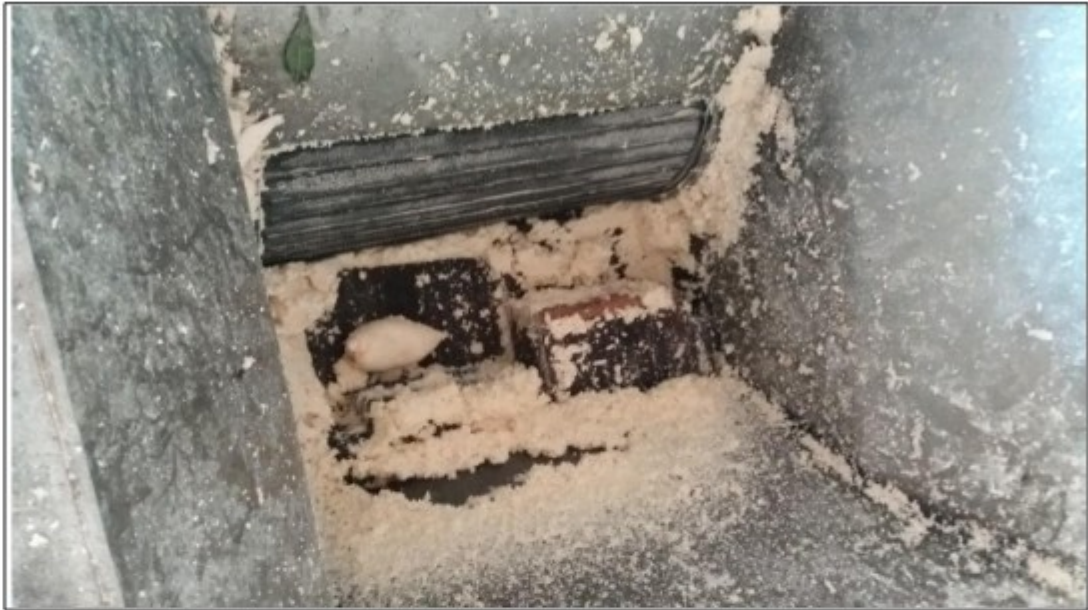
Imagens: Zonas de perigo das máquinas sem qualquer tipo de proteção.