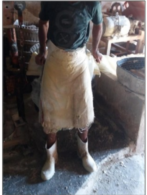
Imagens: Empregados laborando sem a utilização de EPI.

Além da adoção de medidas de caráter coletivo (como sistemas de exaustão e ventilação, por exemplo), os riscos aos quais estavam expostos os trabalhadores exigiam o fornecimento e o uso de equipamentos de proteção individual (EPI) selecionados tecnicamente por profissional qualificado, tais como luvas (para proteção contra lesões provocadas por ferramentas de corte e raspagem), calçados de segurança, proteção respiratória (máscaras), protetores faciais (durante a alimentação dos fornos), aventais, entre outros (rol meramente exemplificativo).