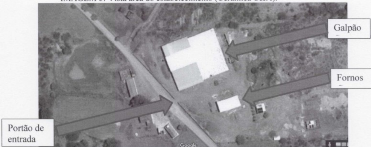
IMAGEM 5: Vista área do estabelecimento (Cerâmica C&A).

Obs: as imagens acima foram obtidas através do software Googlemaps.