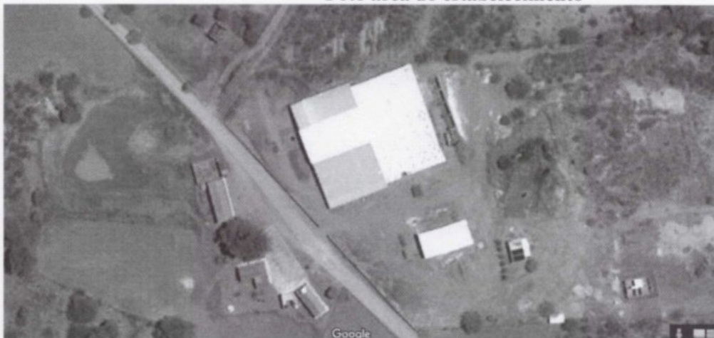
Foto área do estabelecimento

Empregador/razão social: [REDACTED] Empregador/nome de fantasia: Cerâmica R&A Empregador/CNPJ: 26.775.845/0001-42