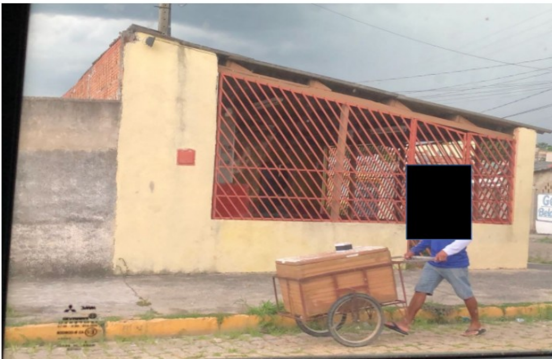
27/03/2018 - Trabalhador em atividade externa de venda de laticínios na região circunvizinha a Salto/SP.

SISTEMA "CREDIÁRIO" DE VENDA DE LATICÍNIOS, "PORTA-A- PORTA", POR VENDEDORES AMBULANTES