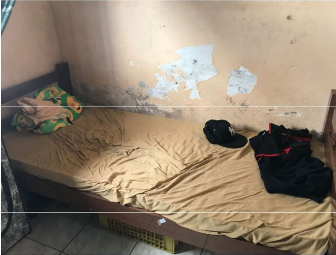
28-03-2018. [REDACTED] Cama improvisada. Panos amontoados improvisam travesseiro. Umidade na parede.

As condições degradantes pela manutenção do alojamento em condições indignas, além de constatadas in loco pela fiscalização o trabalho, são corroboradas pelos depoimentos dos trabalhadores: