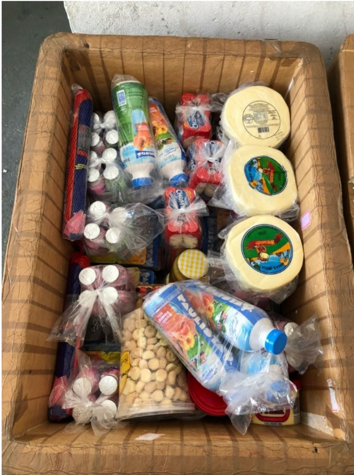
28/03/2018 - Caixa de isopor, com cerca de 45 KG de produtos lácteos prontos para venda.