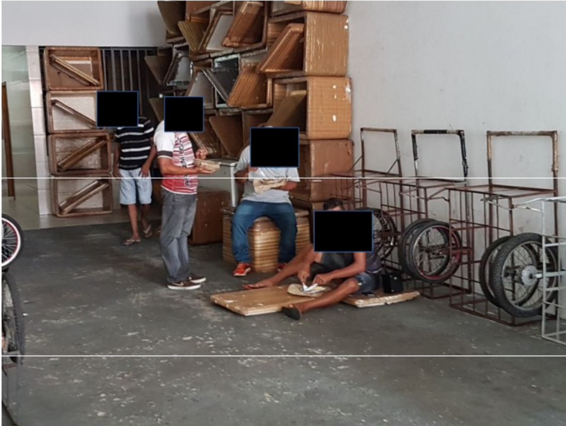
28/03/2018 - Condições em que são oferecidas as refeições aos trabalhadores.