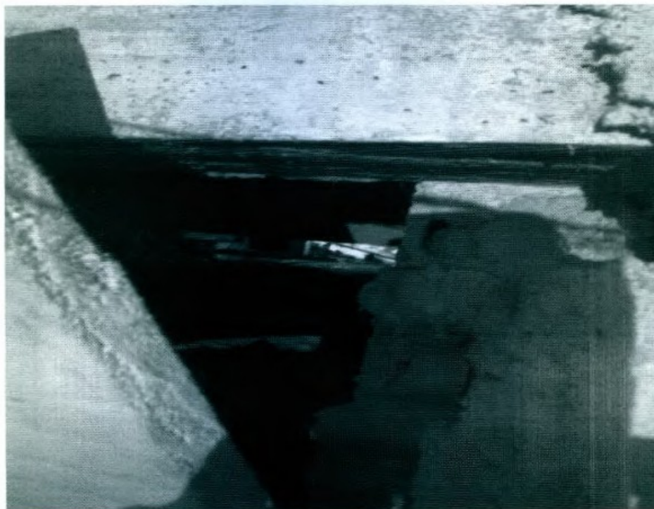
DETALHE DA FRESTA DE UM DOS QUARTOS

Constatamos ainda que as camas do quarto ocupados por 02 empregados não estavam em acordo com a Norma Regulamentadora nº 31 do MTb, além do espaçamento mínimo entre elas ser inferior a 1,00m (um metro) . Não eram disponibilizados armários para a guarda dos objetos pessoais dos empregados nem roupas de cama adequadas às condições climáticas locais. Em relação a estas condições, deve-se frisar que a propriedade situava-se em local de grande altitude, sujeita à baixas temperaturas, mesmo durante o verão. O chuveiro destinado ao banho, por este motivo, deveria ser elétrico mas estava estragado. O alojamento também não possuía nenhum cesto para coleta de lixo e papel higiênico no sanitário.