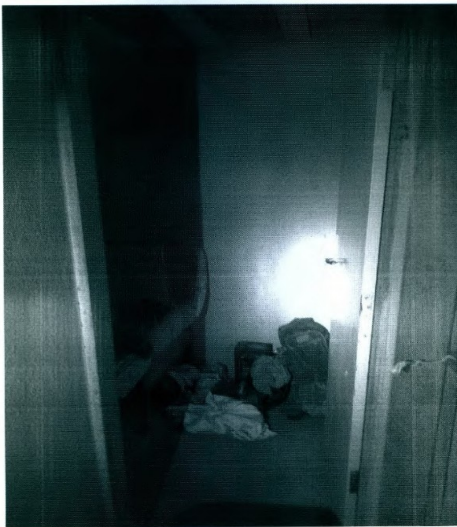
DETALHE DO QUARTO 2 – OCUPADO POR 01 EMPREGADO

programa Globo Rural, da Rede Globo de Televisão e pode ser encontrada no sítio http://g1.globo.com/economia/agronegocios/globorural/videos/t/edicoes/v/mosquito-maruim-tira-o-sossego-de-agricultores-do-es/3405034/ .