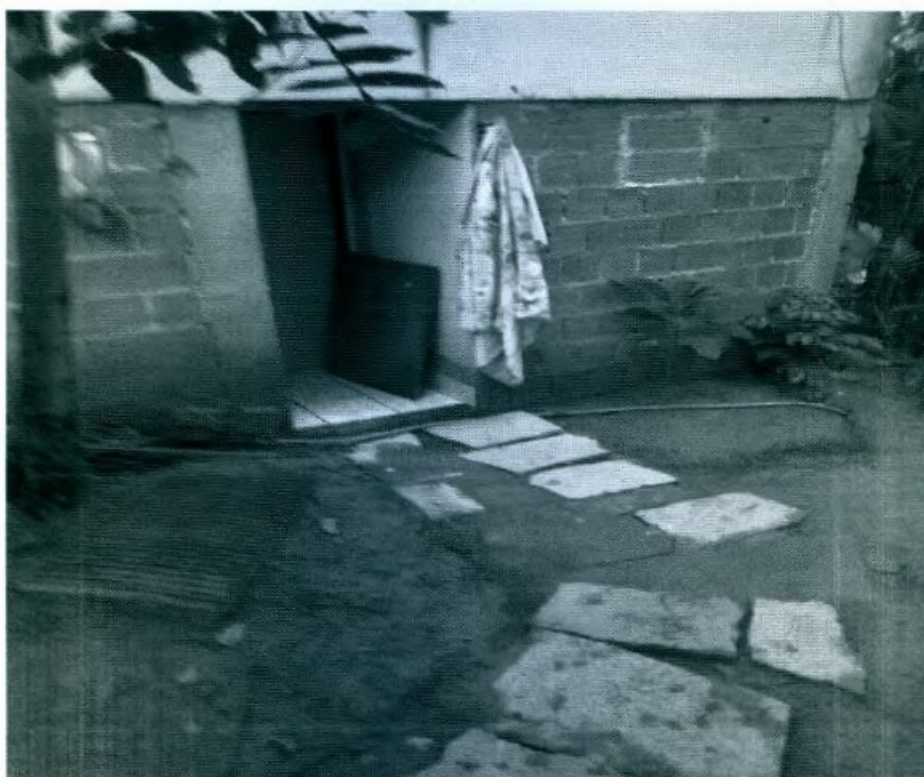
DETALHE DO ACESSO AO PORÃO ONDE FICAVAM 02 QUARTOS

Entrevistados, 03 empregados afirmaram terem vindo da Bahia, mais precisamente da cidade de Nilo Peçanha, distante mais de 1000 km (mil quilômetros) da propriedade, chegando nesta no dia 08 de novembro de 2017. Contaram que dispenderam o valor de R$ 240,00 ( duzentos e quarenta reais ) em passagens para chegar ao local. Informaram que nenhum deles possuía Carteira de Trabalho, apenas documento de Identidade. A remuneração prometida seria de R$ 1.800,00 (hum mil e oitocentos reais) por mês, mas que só teria sido pago o valor de R$ 1.320,00 (hum mil e vinte reais) por mês trabalhado.