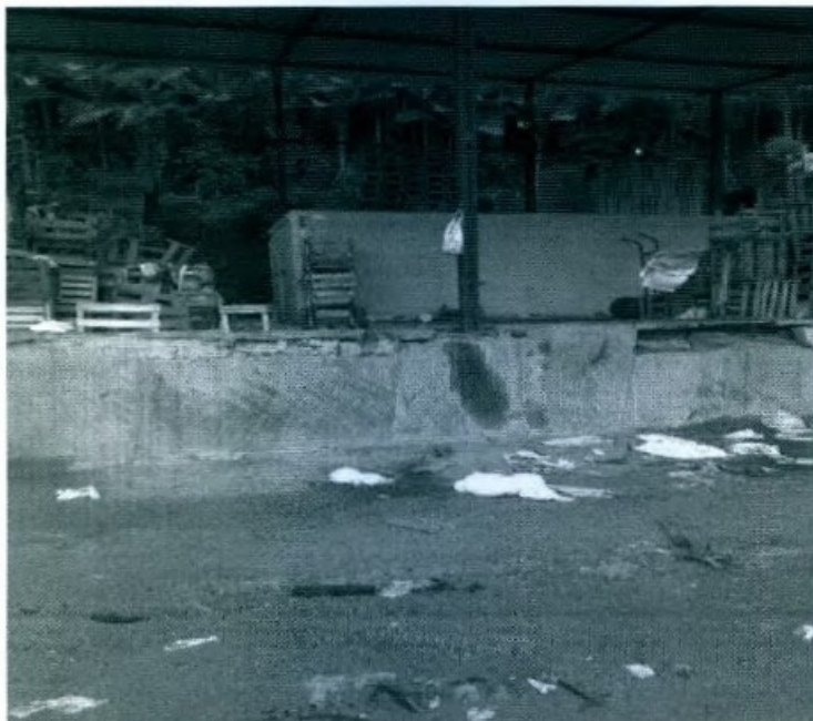
Registro fotográfico do galpão onde são embarcadas, nos caminhões, as

A propriedade rural dedica-se ao cultivo de banana e de café. No momento do início da ação fiscal, os empregados estavam realizando o serviço de desbrota de bananeiras, tecnicamente denominado desperfilamento , trabalho este que consiste na eliminação dos brotos (perfilhos), que nascem abundância nas touceiras das bananeiras.