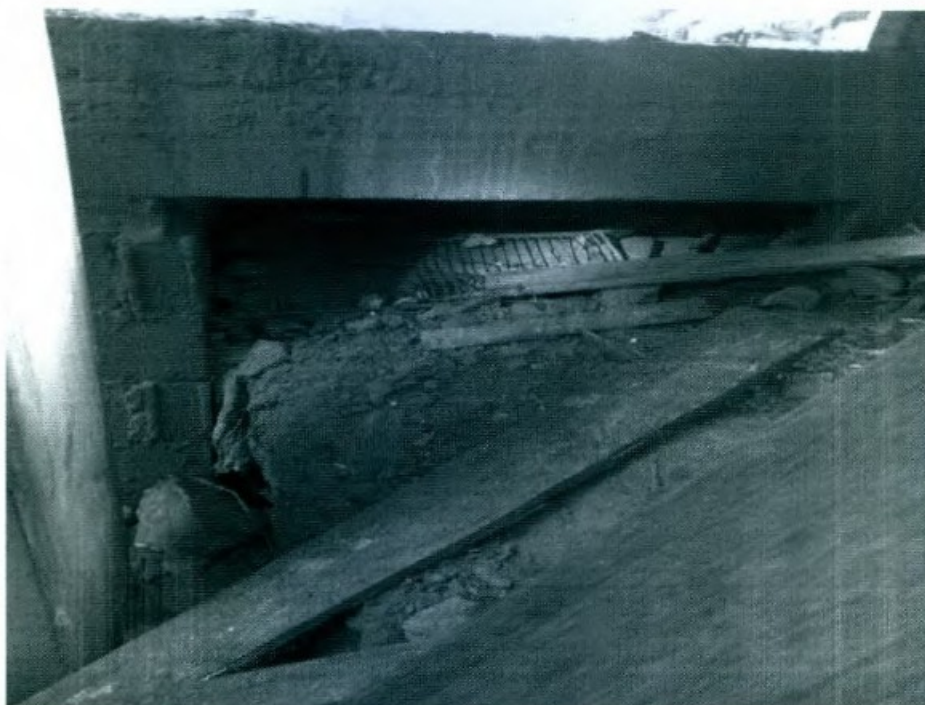
DETALHE DA FRESTA DE UM DOS QUARTOS- VISTA EXTERNA

Na frente de trabalho foi constatado que o empregador não fornecia os Equipamentos de Proteção Individual – EPIs adequados à atividade, em especial, botas e proteção contra a insolação, apesar do enorme risco de ofidismo presente na cultura da banana, nem estojo de primeiros socorros para o caso de ocorrência de acidentes. A água fornecida não era suficiente para o consumo dos trabalhadores durante toda a jornada de trabalho, constando de um galão pequeno destinado a 04 (quatro) empregados, que não era repostada quando findava. Não havia também qualquer sanitário tendo os trabalhadores que satisfazerem suas necessidades fisiológicas em meio ao bananal.