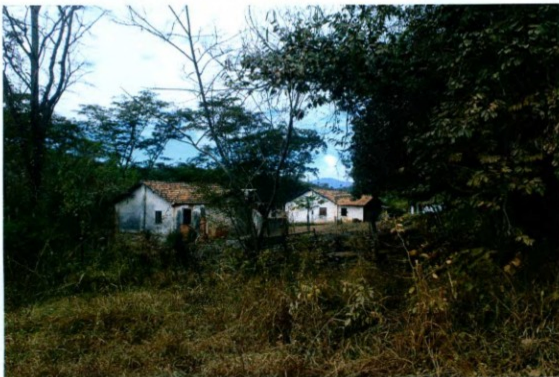
Vista das edificações da Fazenda Santa Helena