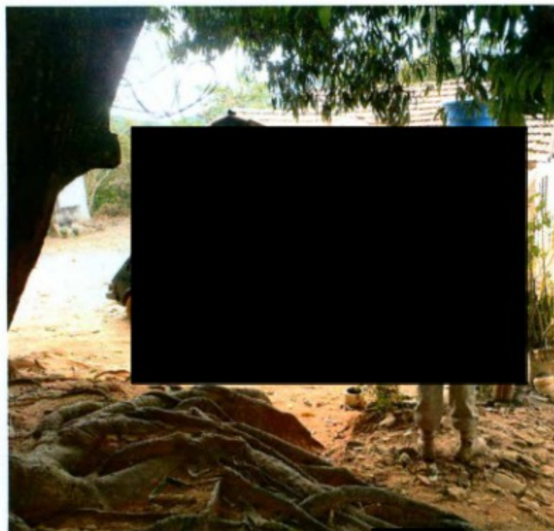
Chegada da equipe na habitação da Sr. [REDACTED]