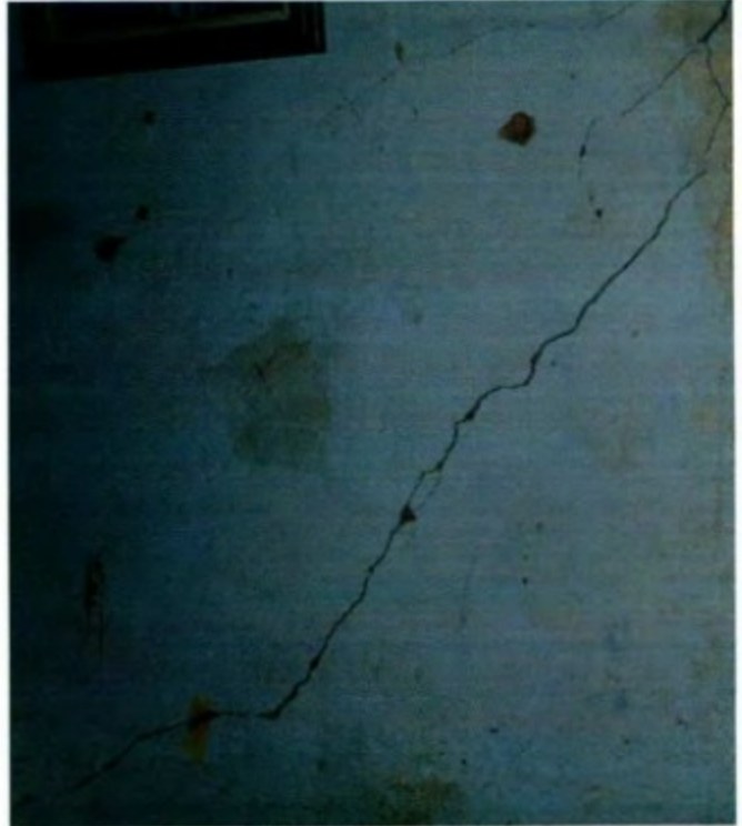
Rachaduras na habitação