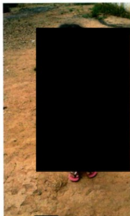
[REDACTED] eta de 4 anos.