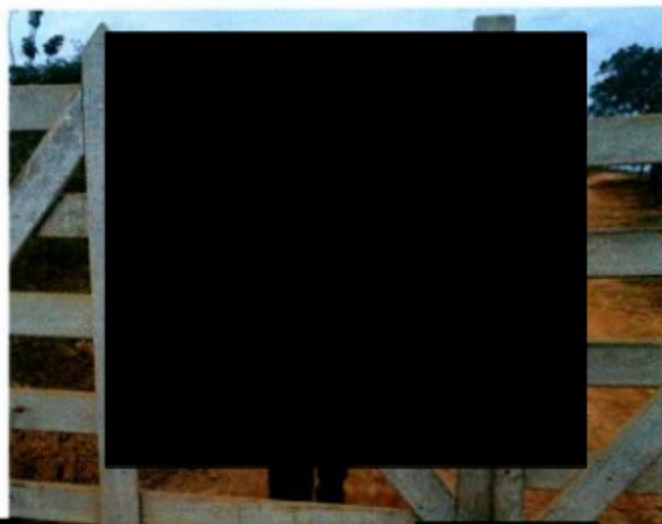
Segunda fazenda do vizinho de [REDACTED]

Anexamos a este relatório alguns documentos como: 1) Ofícios do MPT; 2) Termo de Declaração de [REDACTED] Denúncia registrada no Disque Direitos Humanos; 4) CNPJ da empresa de [REDACTED] Termo de Declaração de [REDACTED]