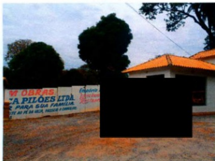
Primeira visita ao empório rural da Fazenda Pilão do primo de [REDACTED]