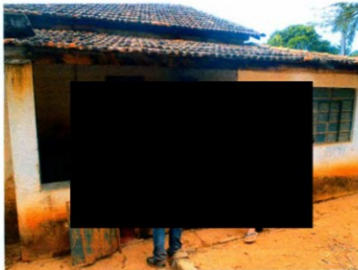
Vista de uma edificação desocupada da Fazenda Santa Helena