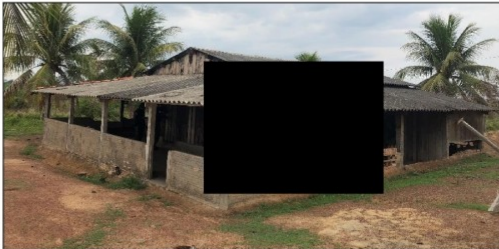
Foto 10: retiro localizado a aproximadamente 8 km da sede, nele não foram encontrados trabalhadores.