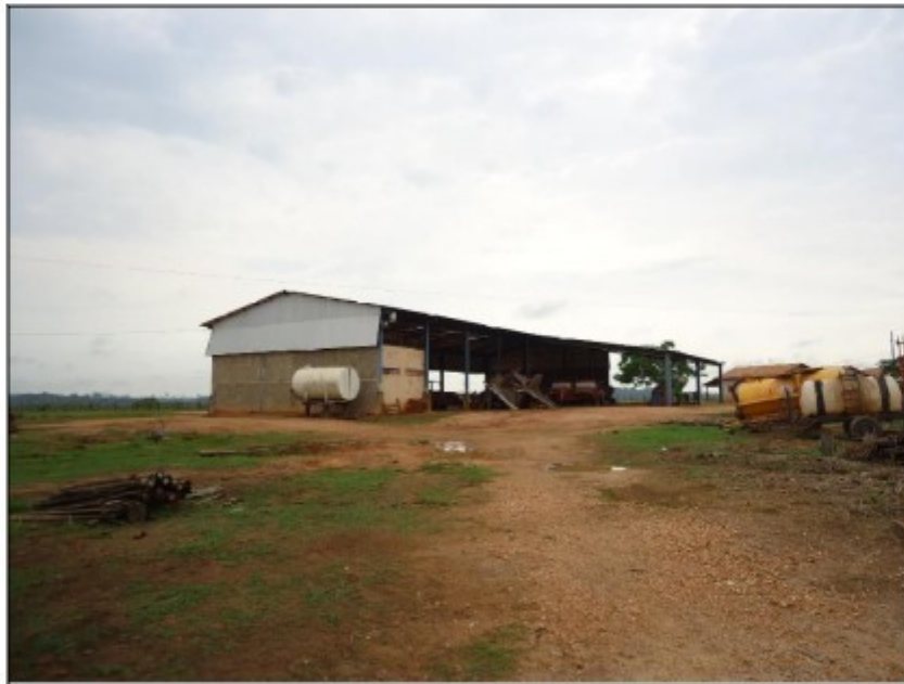
Foto 4: galpão de máquinas e implementos, onde também estavam depositados agrotóxicos.