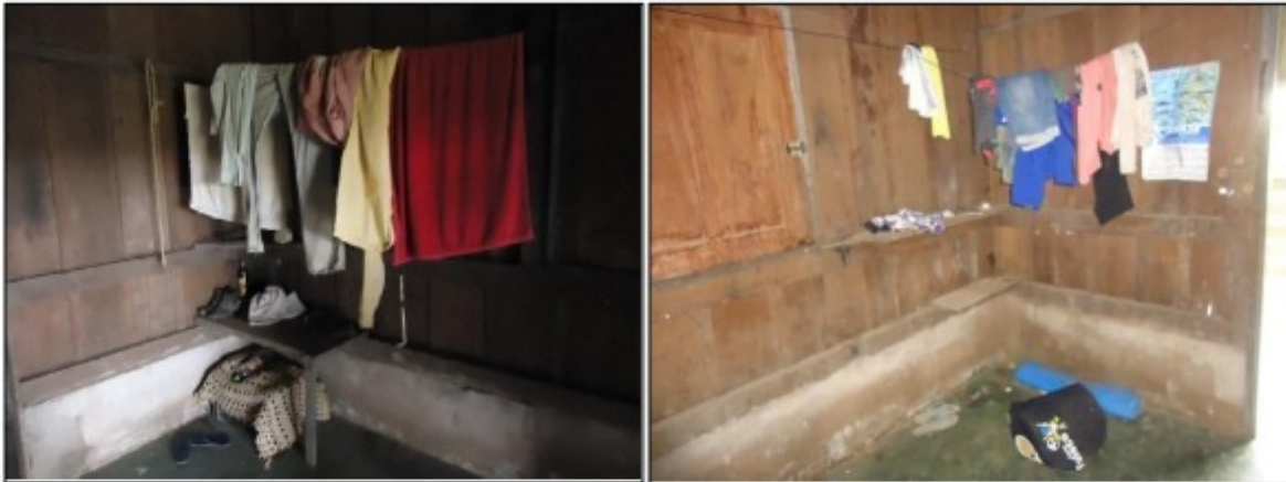
Fotos 2 e 3: pertences de trabalhadores alojados na edificação de madeira, pendurados em cordas devido à ausência de armários para a guarda de pertences pessoais.