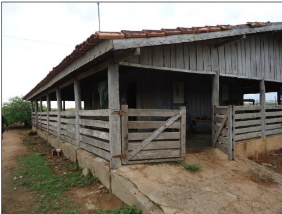
Foto 1: edificação de madeira utilizada como alojamento de cerqueiros, serventes e roçadores.

Abaixo seguem fotos dos locais inspecionados pelo GEFM.