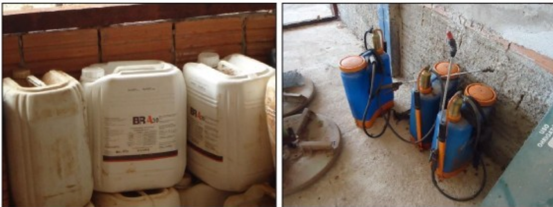
Fotos 5, 6, 7 e 8: armazenamento de agrotóxicos em local de acesso irrestrito no galpão de máquinas e implementos.