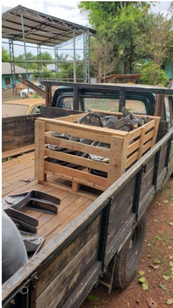
Veículo utilizado no transporte das peças metálicas. Ao fundo a cobertura metálica aonde são confeccionadas as embalagens de madeira.

conforme contrato apresentado na data da inspeção, que passou a desenvolver no local as mesmas atividades desenvolvidas anteriormente pela empresa [REDACTED] METALURGICA. Junto à porta de acesso ao galpão estavam sendo carregadas as peças metálicas cujo acabamento já havia sido feito. A atividade de carregamento estava sendo conduzida pelo Sr. [REDACTED] em camioneta de sua propriedade.