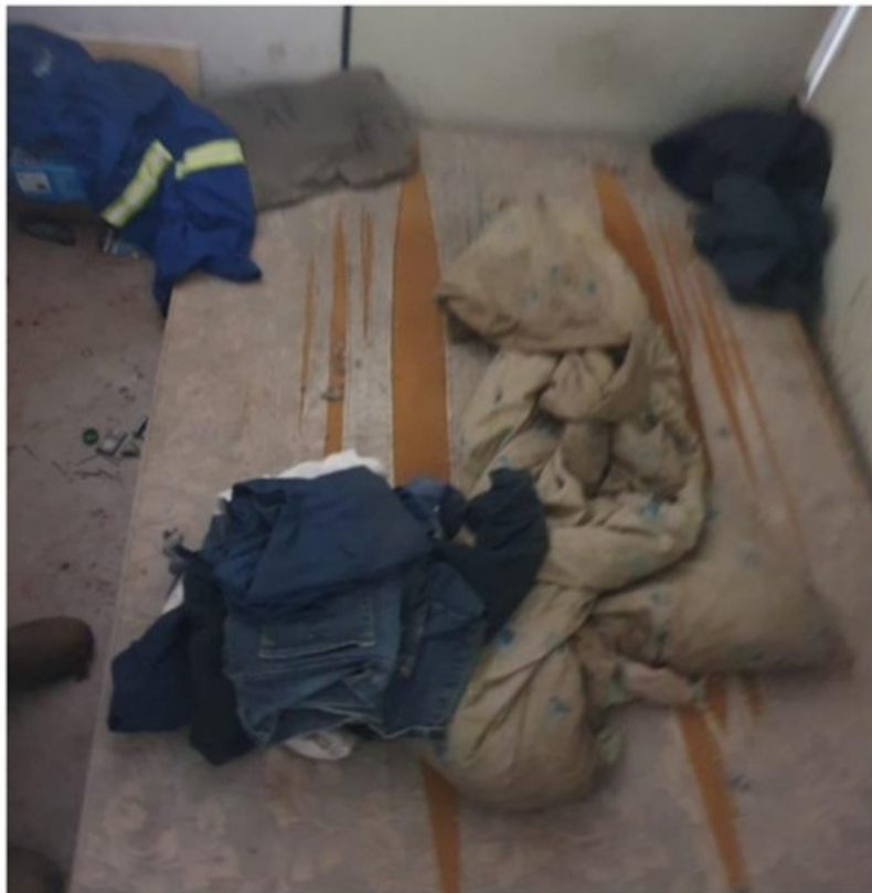
Colchão em contato direto com o piso do dormitório

Tal irregularidade, além de significar a ausência de conforto para o trabalhador, também se enquadra no indicador de submissão do mesmo a condições degradantes descrito neste item, potencializando a chance de contaminação do local de descanso por insetos e roedores.