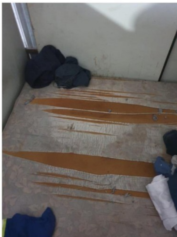
Condições encontradas no dormitório do alojamento

Considerando que o pernoite ocorria no interior da serralheria e que não havia serviço de limpeza, a poeira característica desse tipo de trabalho tomava conta do local. Os pertences do trabalhador ficavam espalhados desordenadamente sobre o colchão, mesa, cadeira, chão, dentro de sacolas, expostos à sujeira, uma vez que não havia armários fechados para a sua guarda. Toalhas ficavam penduradas na grande abertura (janela) que havia na parede. Essa