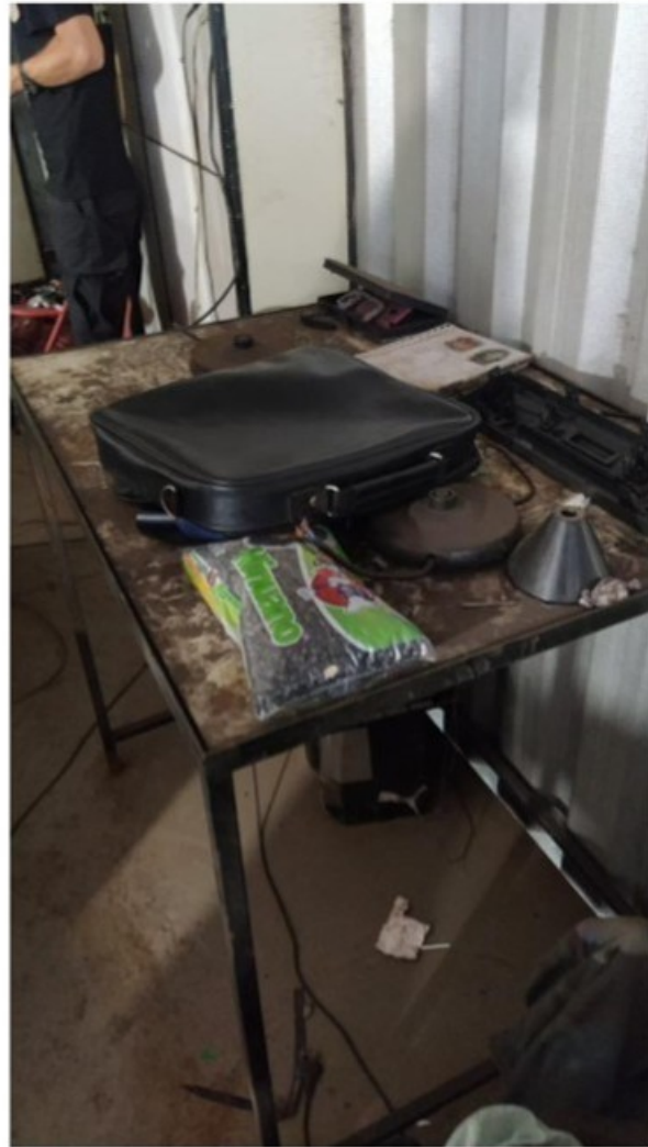
Mesa e bancada utilizadas pelo empregado alojado para a tomada das refeições