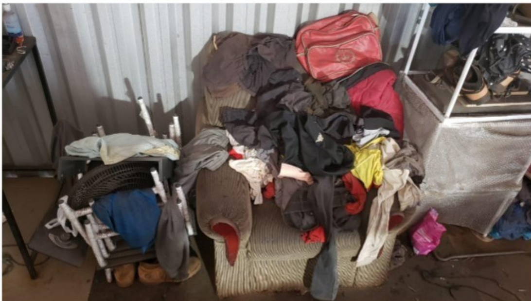
Poltrona utilizada para a guarda das roupas