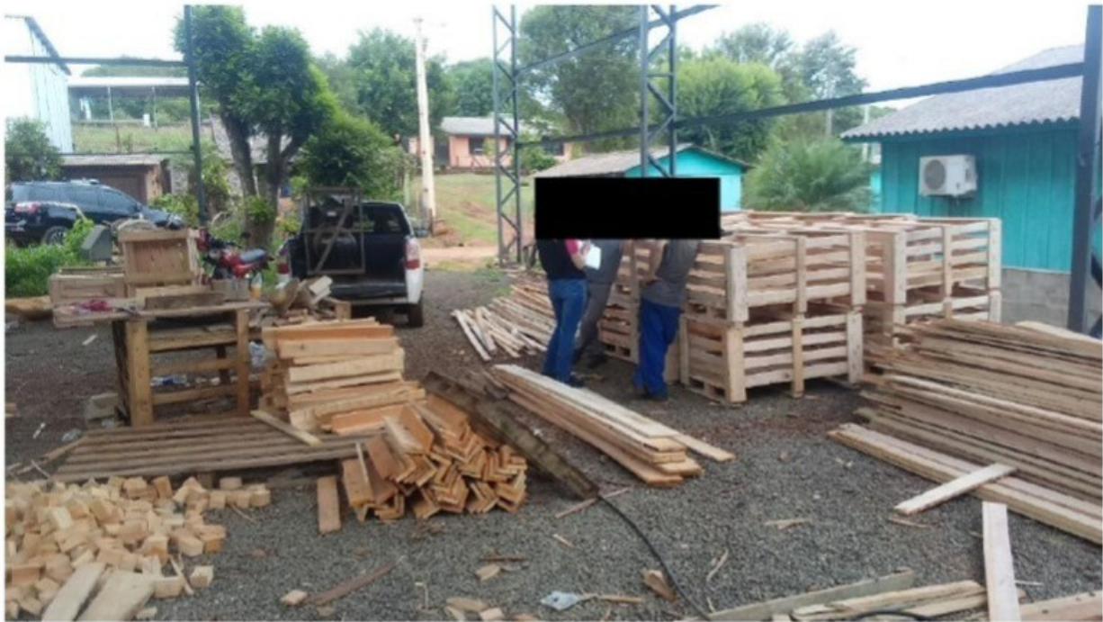
Trabalhadores no local de trabalho sendo entrevistados pela Fiscalização do Trabalho

[REDACTED] Após entrevista com esses trabalhadores, apurou-se haver vínculo de emprego entre os mesmos e a empresa para a qual estavam trabalhando, subordinados diretamente ao proprietário, Sr. [REDACTED]