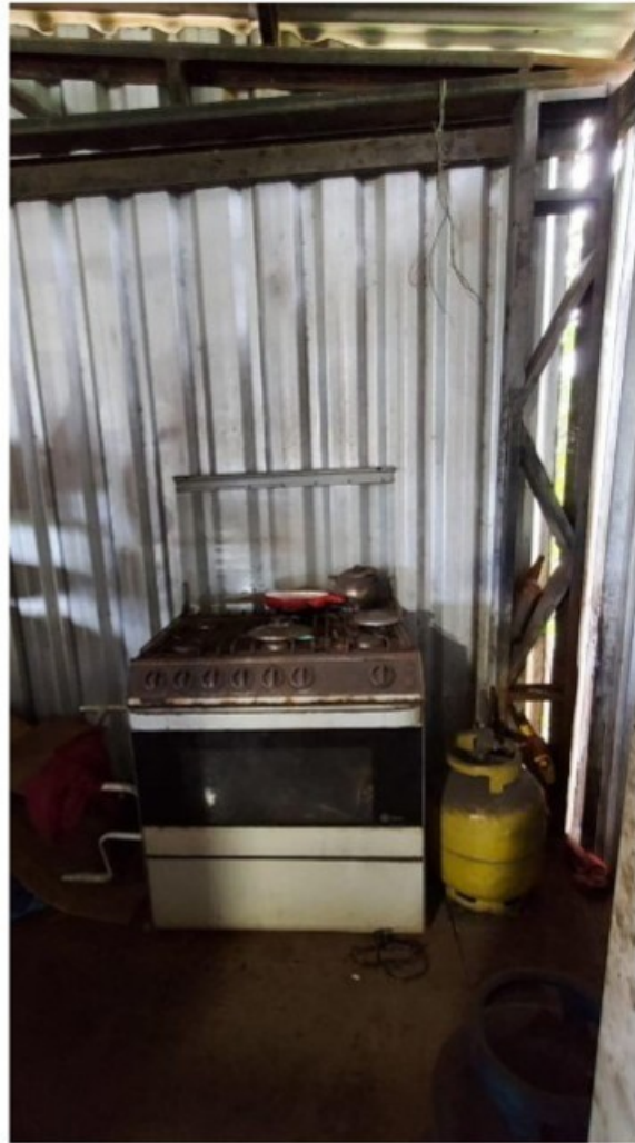
Fogão utilizado pelo empregado alojado para o preparo das refeições.

A inexistência de ponto de água com pia no ambiente de preparo das refeições contribui para a falta de higienização de alimentos e mãos durante seu preparo, sendo que o acesso à água se dava somente no banheiro do galpão metálico, descendo pela escada ao piso térreo, aonde há uma pia, um bebedouro com copos de uso coletivo, um vaso sanitário e um chuveiro, todos em péssimas condições de higiene.