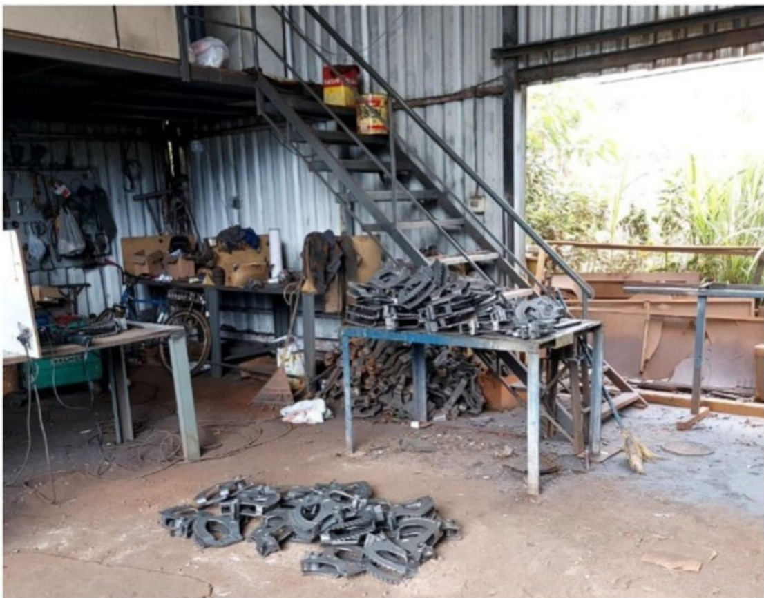
Escada de acesso ao alojamento