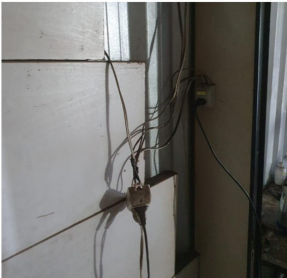
Ligação elétrica existente na entrada do dormitório.

No alojamento havia ligações elétricas improvisadas, com fiação exposta. Tal cenário acarretava risco de graves acidentes por choque elétrico e incêndio, sobretudo devido à possibilidade de impactos mecânicos, superaquecimento e perda de isolamento por atrito.