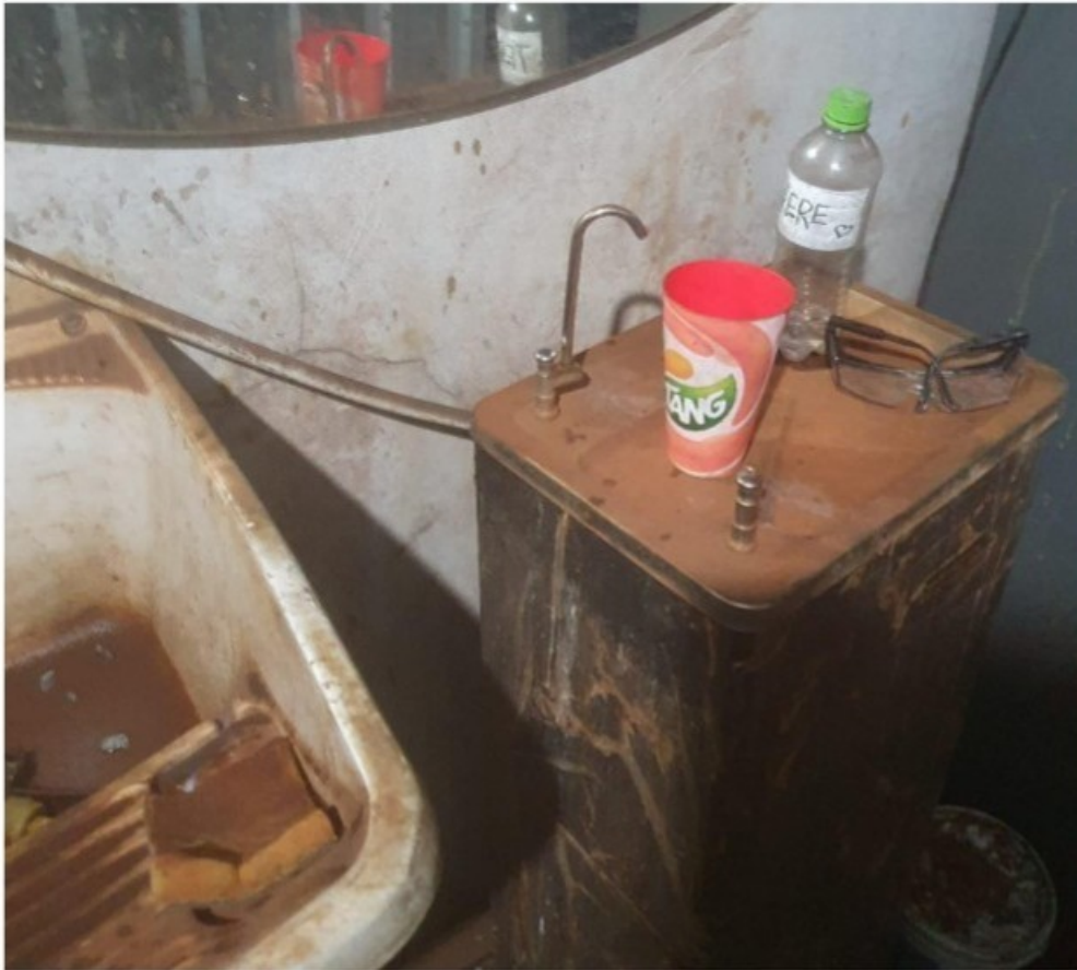
Bebedouro localizado na entrada das instalações sanitárias e copo coletivo utilizado pelo empregado alojado e demais trabalhadores do local.