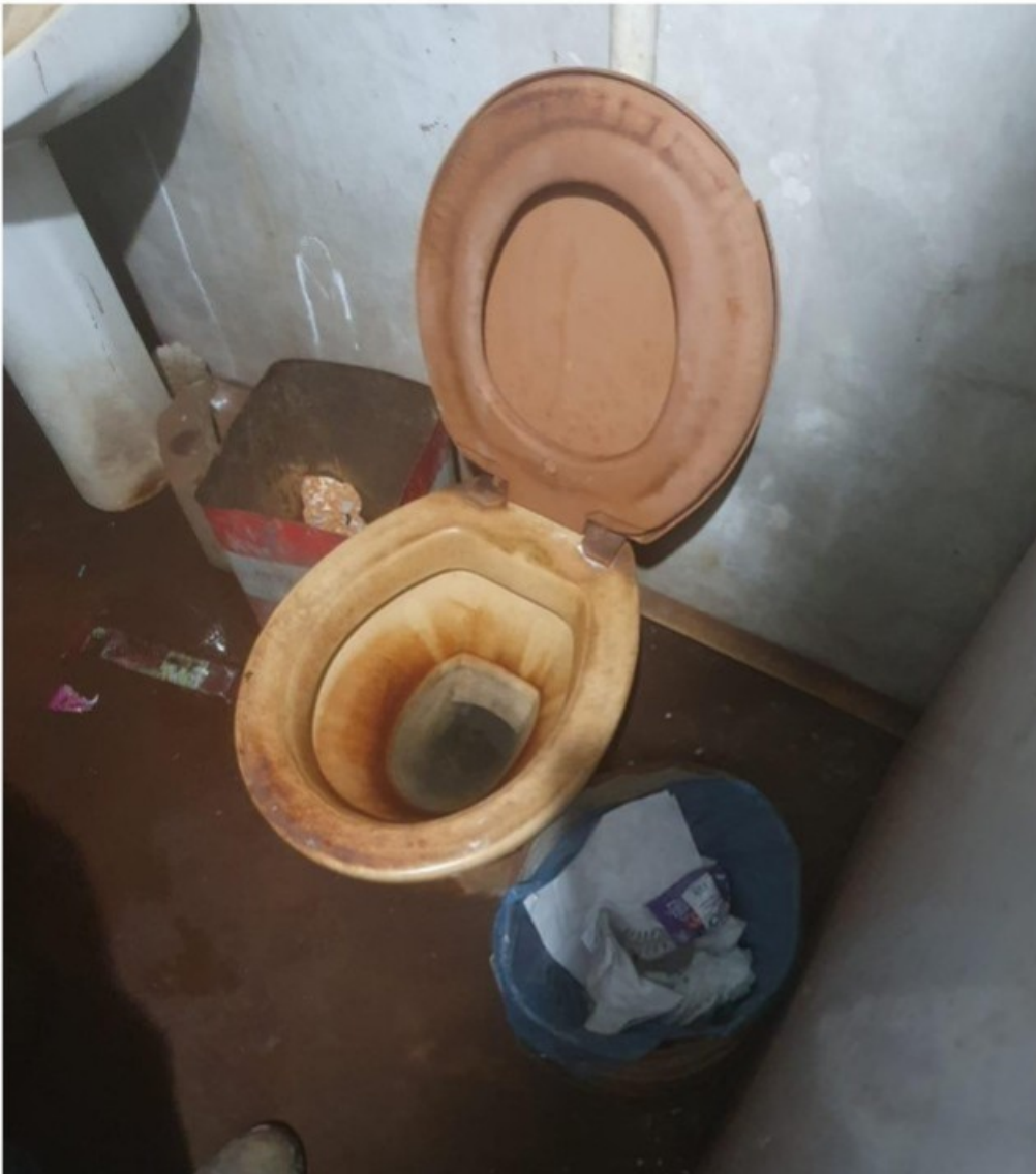
Instalações sanitárias disponibilizadas ao empregado alojado e aos demais trabalhadores do estabelecimento.

banheiro que atende à área de produção da serralheria/metalúrgica, em péssimas condições de higiene. O piso do banheiro tem acabamento bruto e muita sujeira acumulada, expondo o trabalhador e demais usuários a contato com agentes patogênicos.