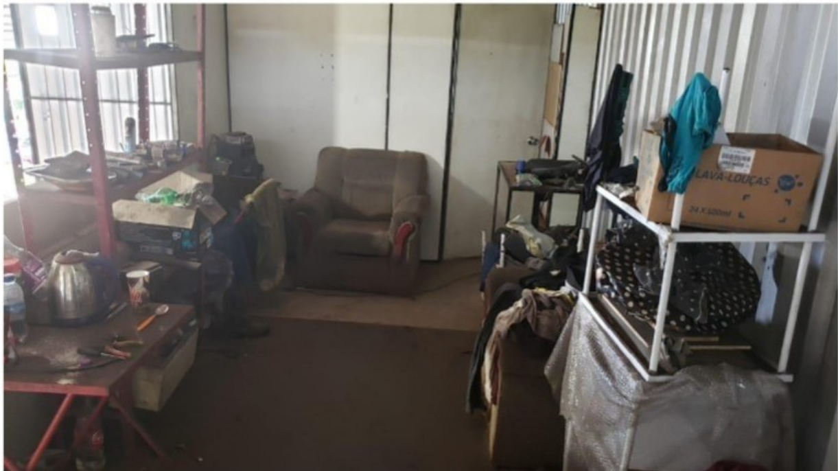
Condições encontradas no alojamento do trabalhador

O mezanino que serve como alojamento possui divisórias tipo Eucatex no lado voltado para a área de trabalho da serralheria/metalúrgica, com duas aberturas sem janelas, sendo uma para o ambiente de dormitório, outra para a área de vivência. Como não há janelas, tais ambientes ficam expostos a animais e insetos, bem como à grande quantidade de poeira oriunda da área de produção da serralheria. A ausência de vedação do local também compromete a privacidade e o conforto do alojado. No ambiente destinado ao dormitório, com cerca de 2mx2m, estava um colchão velho, sujo e com forro rasgado, assentado diretamente no piso, sem forros de cama, com amontoados de roupas e artigos de tecido visivelmente usados e muito sujos. No outro ambiente, havia poltrona com roupas amontoadas em cima, prateleira e mesa metálicas com ferramentas e peças metálicas misturadas a artigos pessoais, utensílios de cozinha e alimentos; um fogão à gás com botijão ao lado e uma geladeira, todos com aspecto de muito descuido e sujos, sendo inexistente ponto de água no alojamento. Foram vistos alguns gêneros alimentícios no local, restos de comida já preparada, não havendo produtos para limpeza das áreas de vivência (alojamento e banheiro).