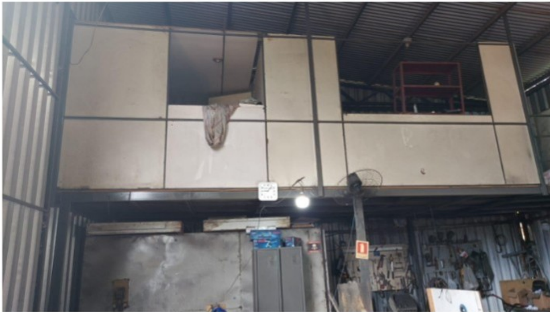
Vista externa do mezanino (alojamento)

No interior do galpão metálico foi localizado o local que estava sendo utilizado como alojamento pelo trabalhador [REDACTED] tratando-se de um mezanino, com acesso por escada metálica.