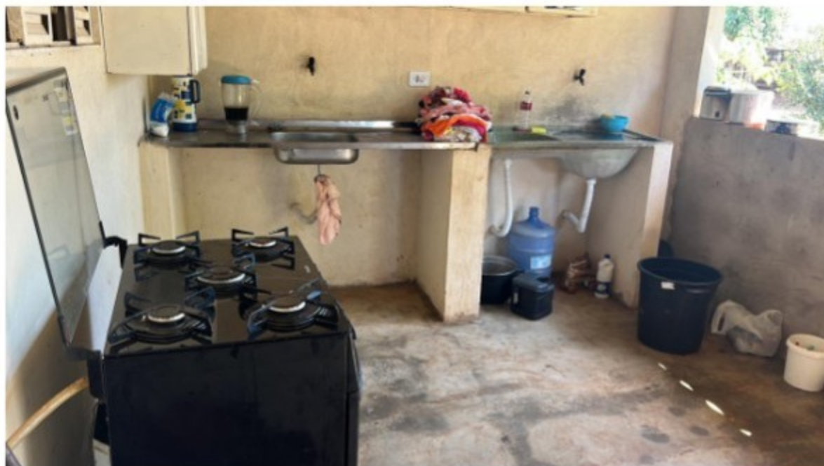
Interior da moradia