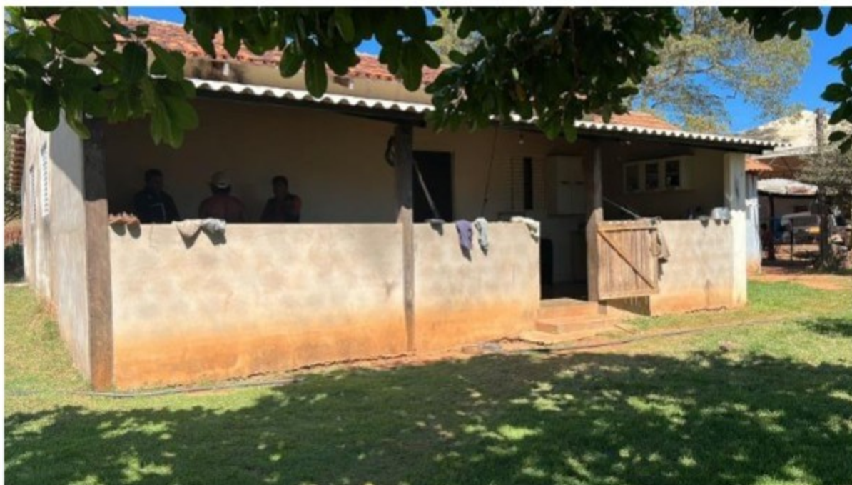
Fachada da casa em que o trabalhador indígena mora com sua família, dentro da fazenda.

A seguir apresentamos fotografias da moradia do trabalhador.