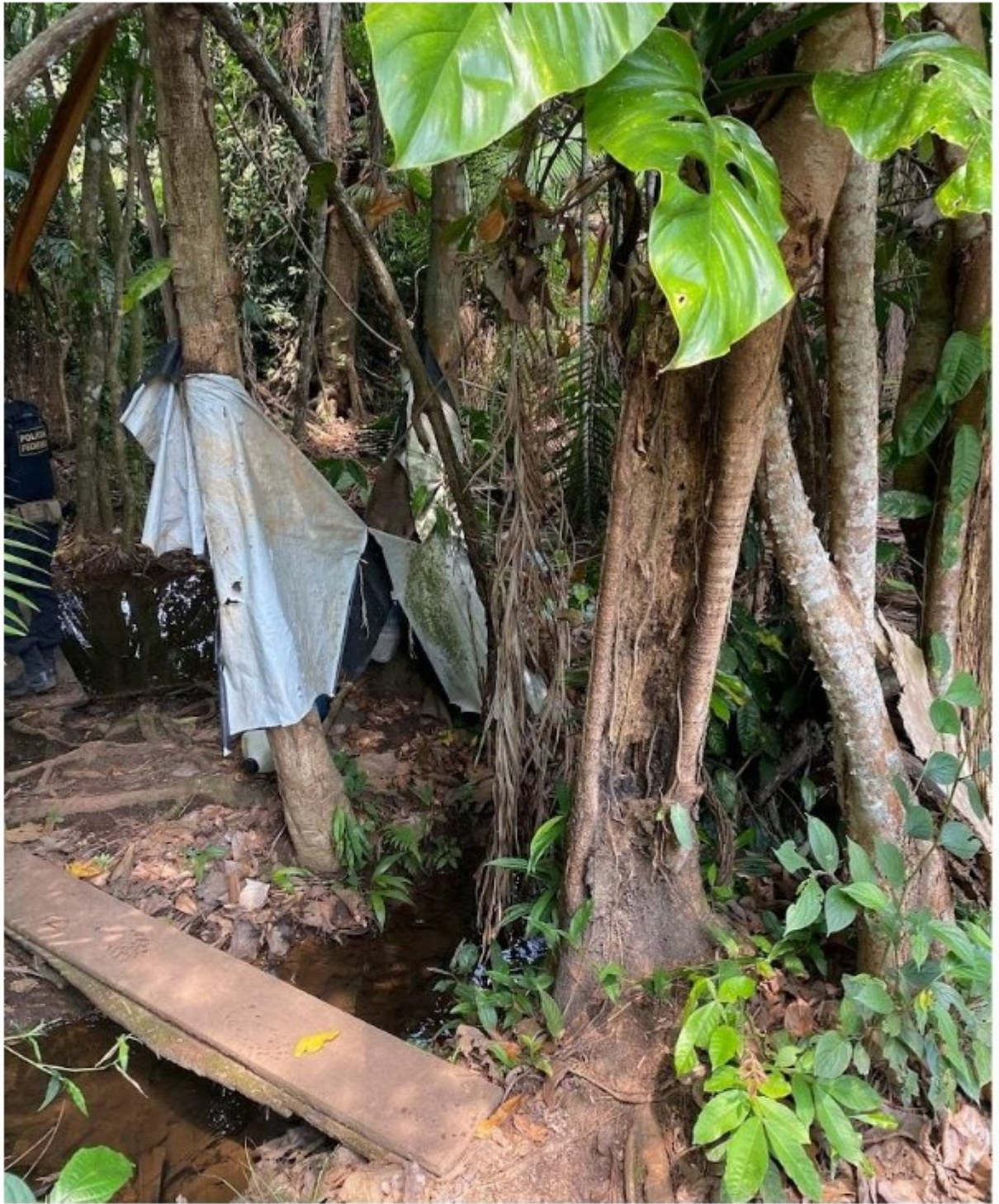
Local provavelmente utilizado para banho e como lavanderia