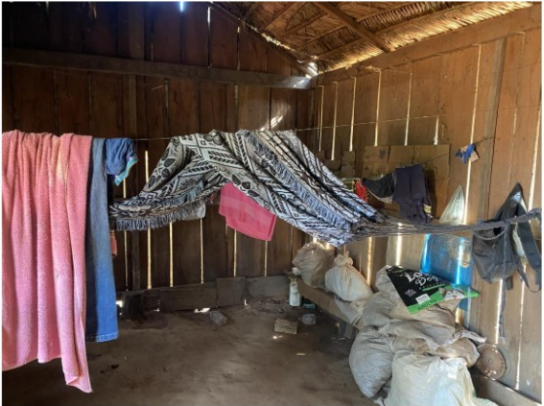
Local utilizado como dormitório de alojamento