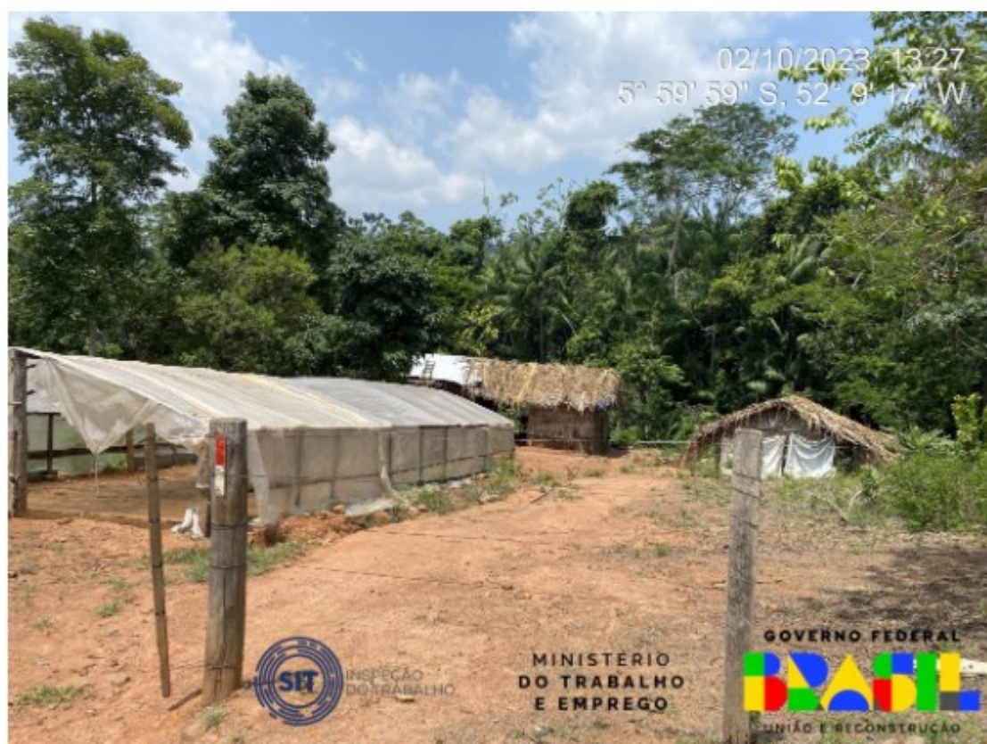
Aspecto geral da área de vivência inspecionada