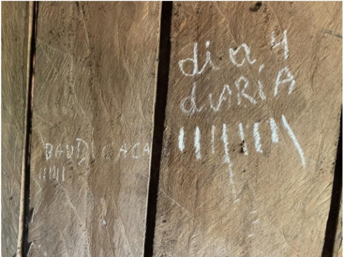
Anotação de diárias em parede do local utilizado como dormitório de alojamento