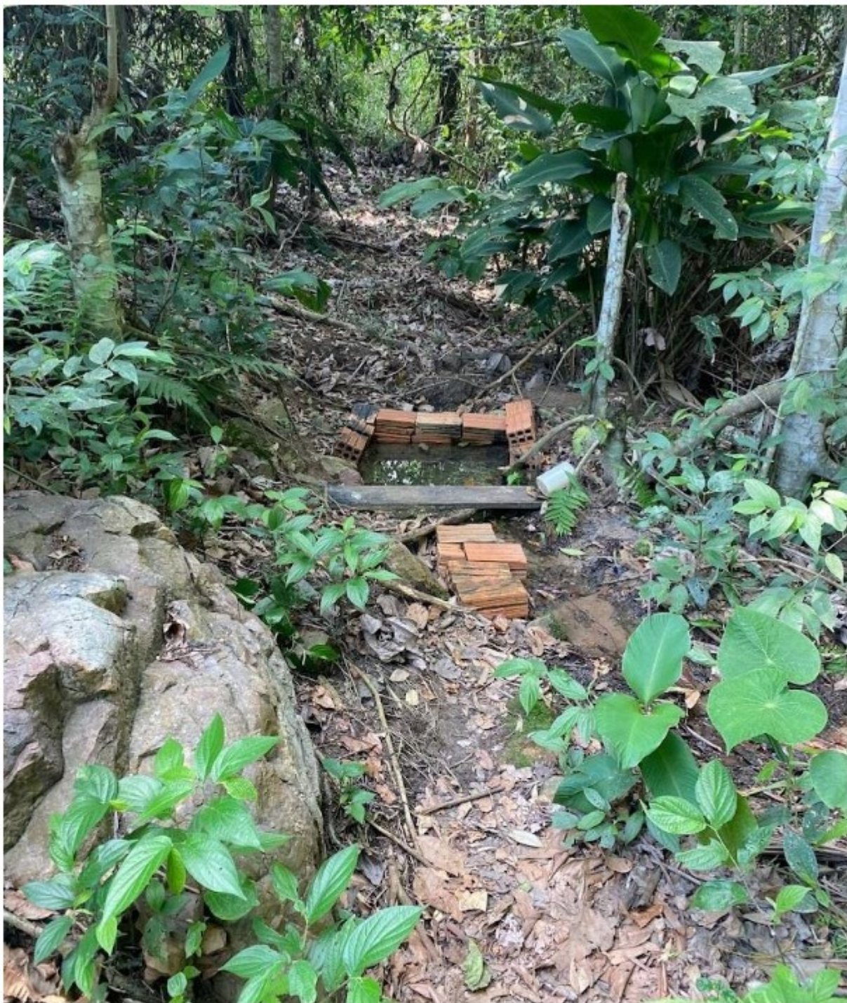
Cacimba de onde provavelmente era retirada a água para consumo humano