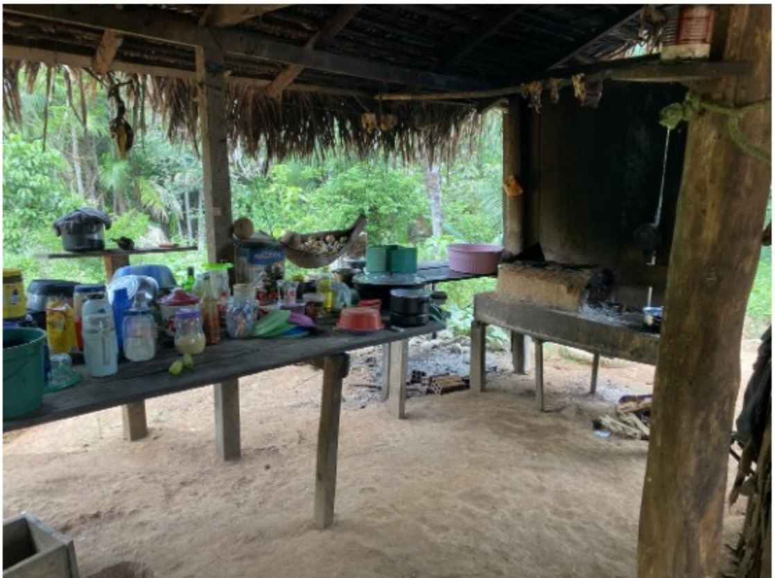
Locais de preparo e tomada de refeições