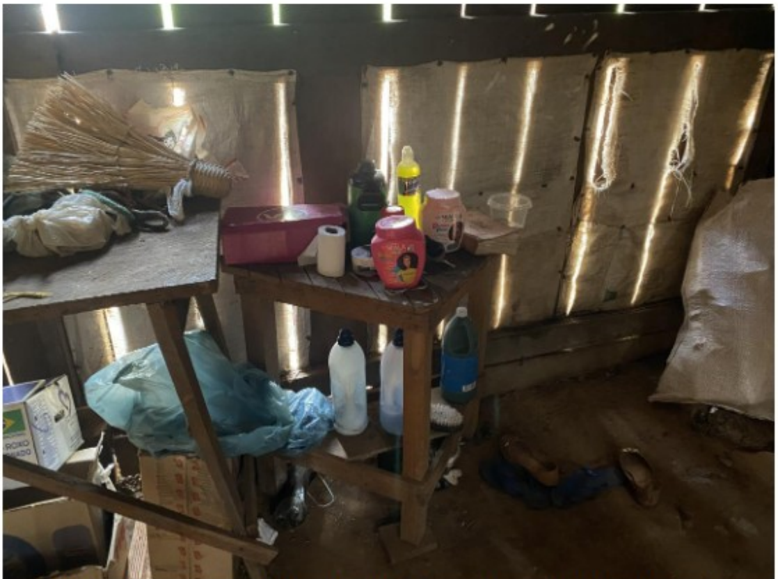
Objetos dos ocupantes do local utilizado como dormitório de alojamento