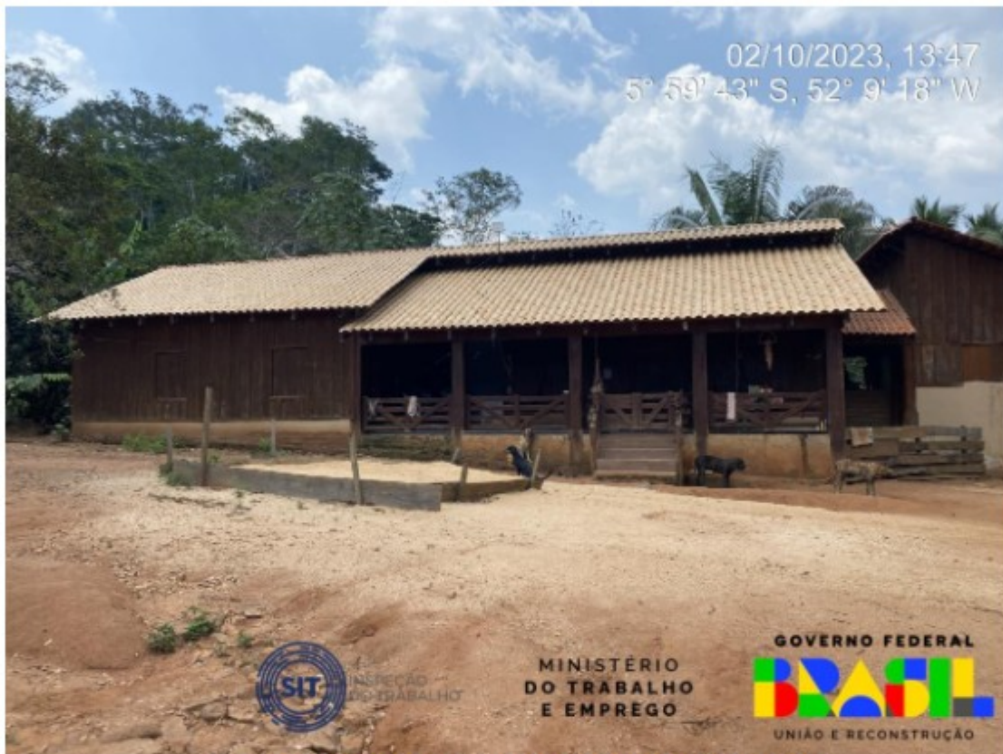
Edificação utilizada como sede do estabelecimento