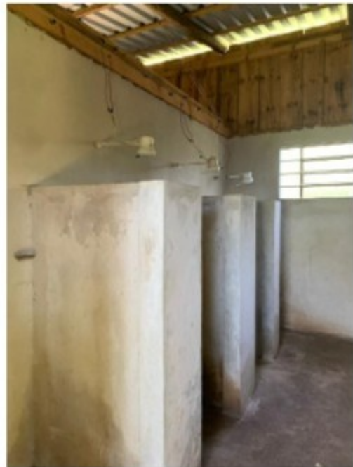
Figuras 1 e 2 – vasos sanitários e chuveiros das instalações sanitárias fixas