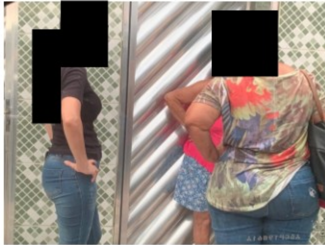
Equipe esteve na pousada