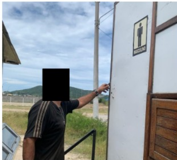
Sr. [REDACTED] diante do banheiro utilizado pelos trabalhadores

O Sr. [REDACTED] e Sr. [REDACTED] informaram que compram quentinha para os trabalhadores e para [REDACTED] Que fornecem o café da manhã com pão e manteiga e café e duas quentinhas (uma almoço e outra jantar) e um café da tarde.