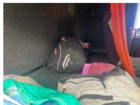
Trabalhador mostrando local de alojamento, em boleia de caminhão