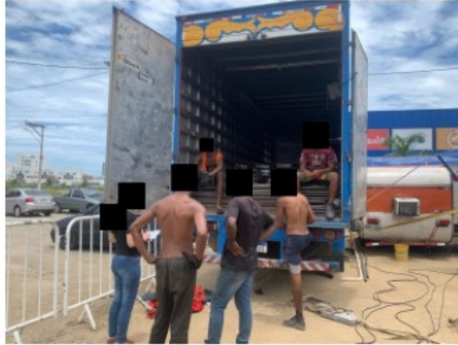
Trabalhadores sendo entrevistados no caminhão

Entrevistados, os trabalhadores então relataram que foram chamados para o trabalho pelo Sr. [REDACTED] conhecido como [REDACTED], residente em Nova Iguaçu, e que recebem R$ 60 de diária, tendo começado o trabalho no dia 29 de janeiro, com desmontagem de circo em Unai e montagem em São Pedro da Aldeia.