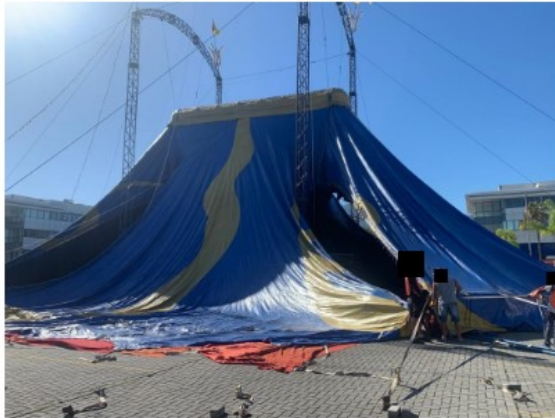
Montagem do circo no Shopping Up Town (Rio de Janeiro-RJ)

forma tendo dormido dentro de caminhões na noite anterior, data em que teve início a montagem do Circo no local.