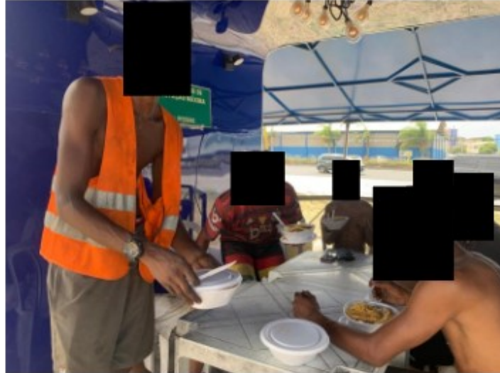
Trabalhadores almoçando às 14h, com as quentinhas

De imediato, a fiscalização determinou que os trabalhadores fossem acomodados em alojamento adequado e entrou em contato com a procuradora do Trabalho [REDACTED] relatando a situação. Em comum acordo, foi decidido por agendar audiência no dia 06/02/23, às 13h, na sede da PRT1, no Centro do Rio, para a qual o Sr. [REDACTED] e o Sr. [REDACTED] foram notificados, sendo requisitada também a presença dos trabalhadores que residem em Nova Iguaçu.