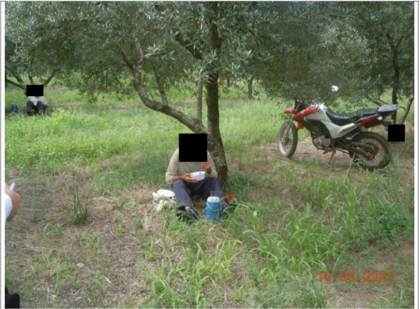
Os trabalhadores comiam e descansavam sob a sombra das oliveiras