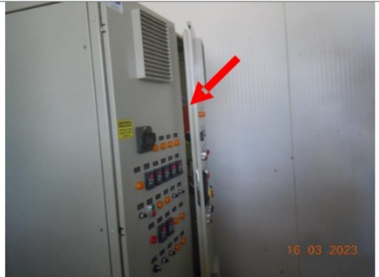
Porta de acesso a quadro ou painel de comando e potência de máquinas e equipamentos aberta