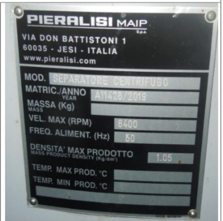
Centrifuga. Na parte superior dessa máquina o fechamento da zona de perigo era realizado apenas por meio de ganchos ou travas que podiam facilmente ser abertos de forma manual