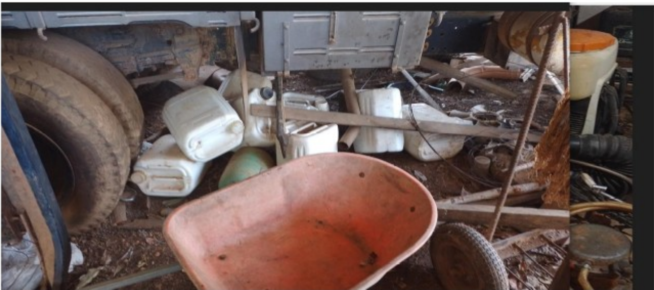
Fotografia -4 e 5: armazenamento de agrotóxicos e suas embalagens vazias, junto com outros insumos, utensílios, etc.. contrariando a legislação vigente, sobre a guarda dos referidos agrotóxicos, bem como de suas embalagens.