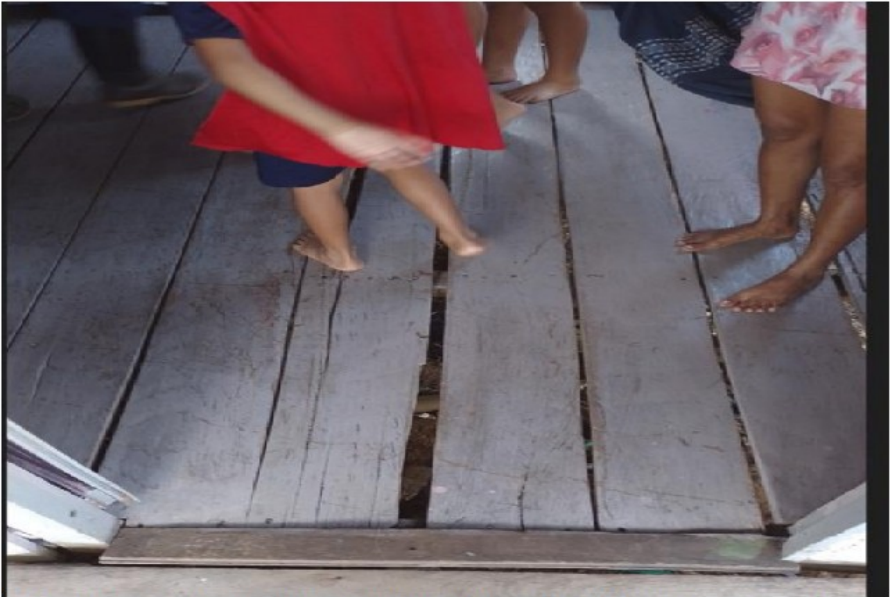
Fotografia 1- assoalho da residência do trabalhador apresenta brechas que permitem a queda de objetos e a entrada de animais peçonhentos ao interior da residência