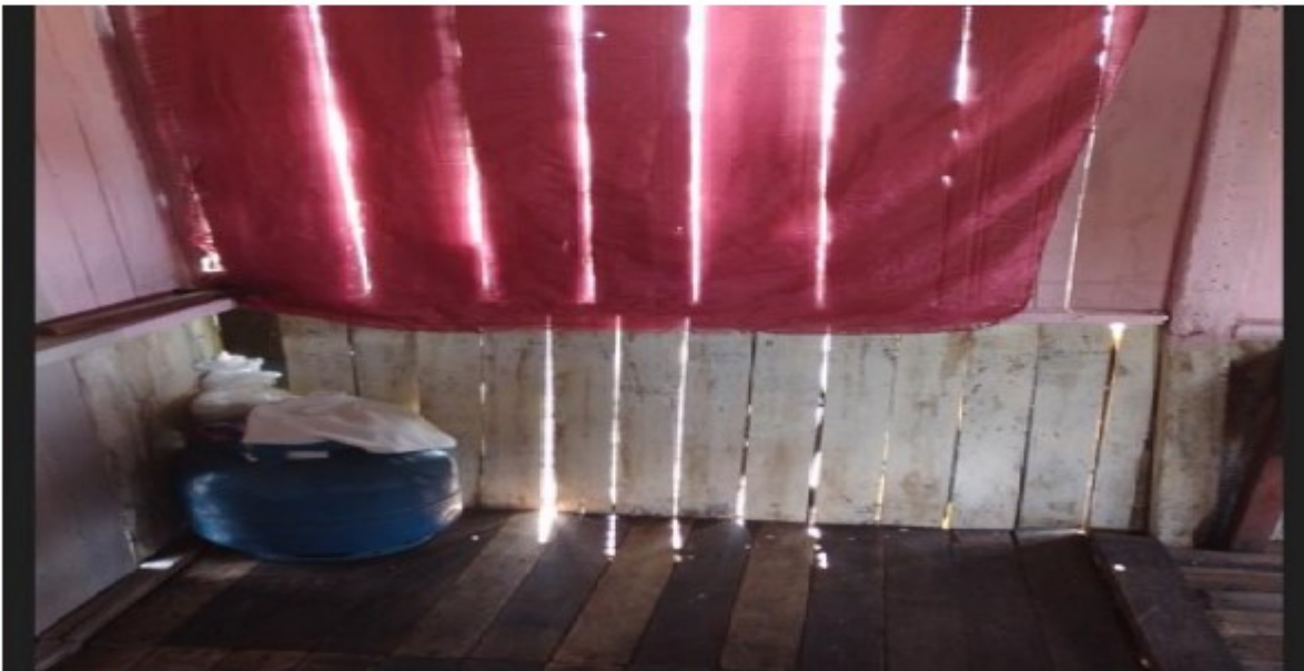
Fotografia 2- paredes da residência do trabalhador apresenta brechas que permitem a entrada de animais peçonhentos ao interior da residência, além de baixa resistência estrutural e incapacidade de proteger os moradores de intempéries