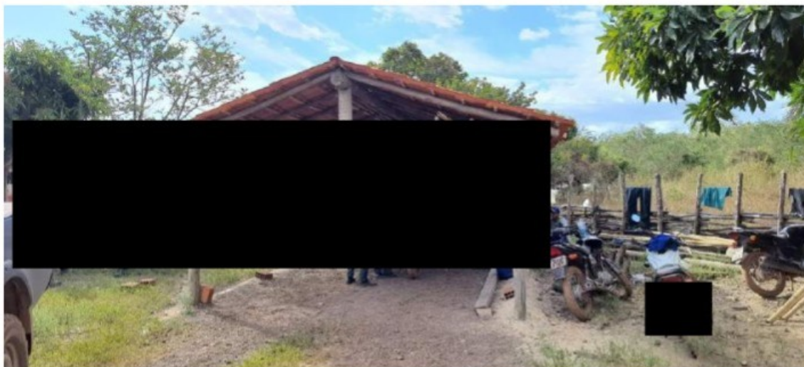
Local em que os trabalhadores estavam pernoitando