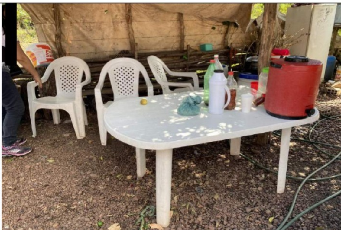
Local de consumo das refeições, aos fundos da casa do Sr. [REDACTED]