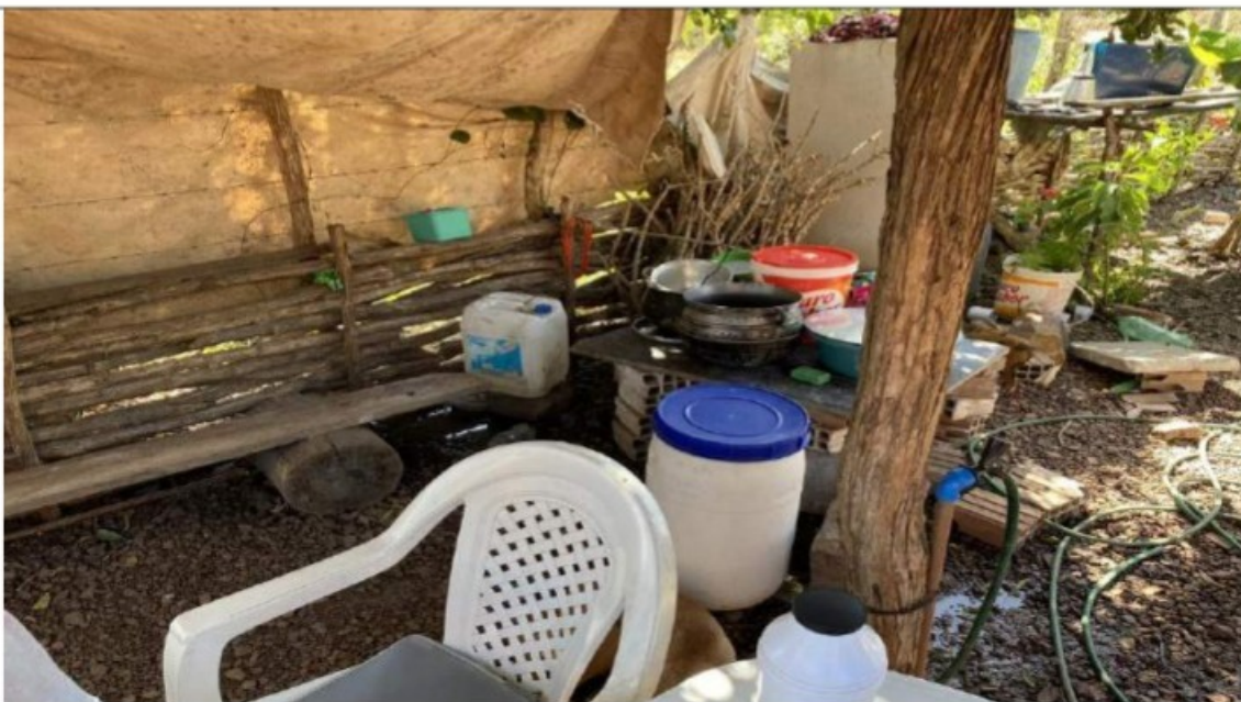
Local para higienização dos itens dos utensílios domésticos, com porcos e galinha circulando no local