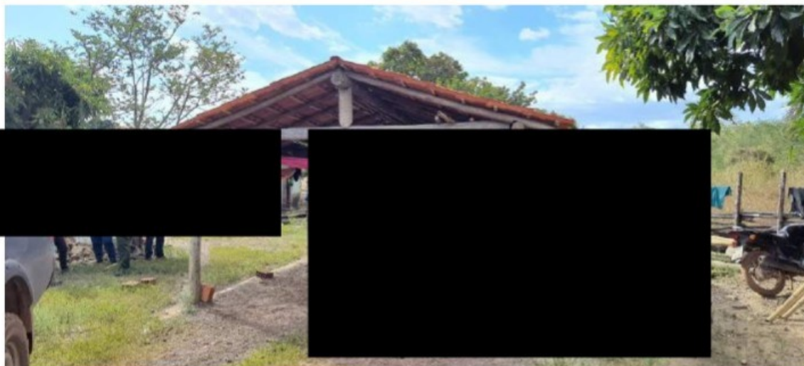
Local em que os trabalhadores estavam alojados

PERÍODO DA OPERAÇÃO: 15/08/2022 a 25/08/2022