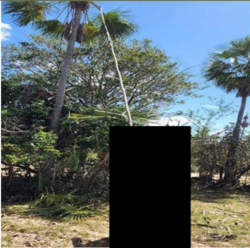
Frente de trabalho