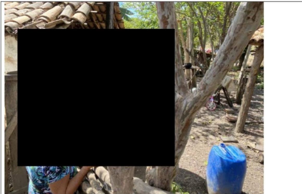
Local que dá acesso ao lugar que os trabalhadores utilizavam como banheiro, na vegetação aos fundos da casa