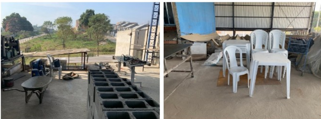
Refeitório em construção

Também foram inspecionados os vestiários, banheiros e local de refeições, sendo que o refeitório estava em obras e sendo instalado ao lado do escritório do estabelecimento.