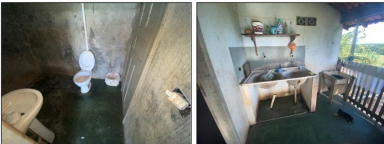
Imagens: Vista externa da moradia do vaqueiro e da cozinheira. Banheiro e lavanderia que eram utilizados por trabalhadores estranhos ao núcleo familiar.