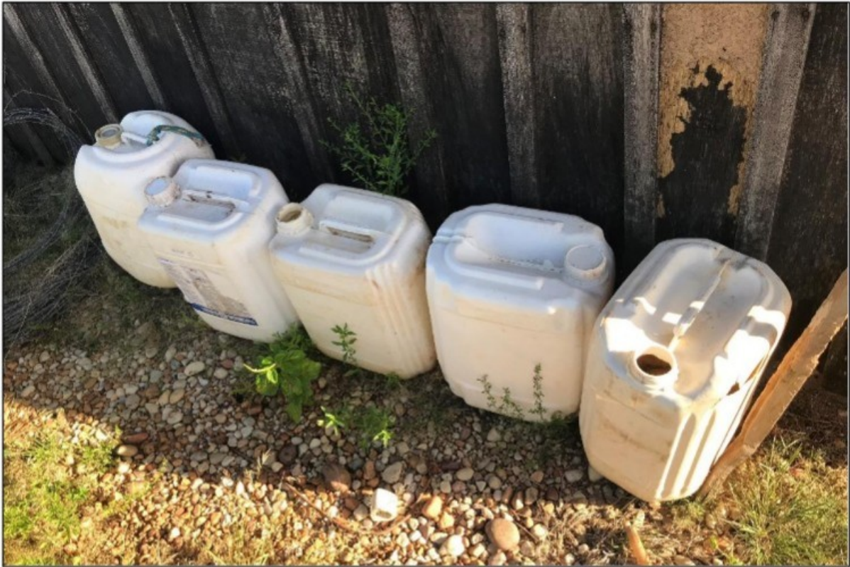
Imagem: Embalagens vazias de agrotóxicos foram encontradas a céu aberto e ao lado do alojamento.