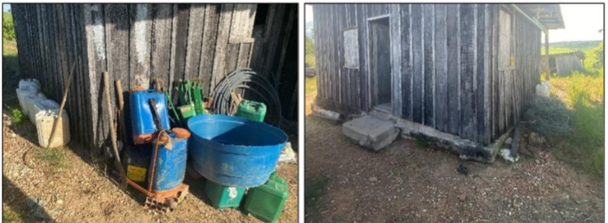
Imagem: Vasilhames de agrotóxicos, ferramentas de trabalho, arame farpado e outros materiais foram encontrados ao redor do local de pernoite dos empregados.

Da mesma forma, o alojamento não era mantido em condições adequadas de conservação, limpeza e higiene. Não houve disponibilização de lixeira com tampas nem material e equipamentos para higienização do ambiente; a limpeza havia sido feita no dia anterior pela cozinheira [REDACTED] a pedido do próprio trabalhador, devido à imensa sujeira em que se encontrava. Ao redor do barraco, encostados em sua parede e diretamente no solo, foram encontrados vasilhames de agrotóxico, bombas costais para sua aplicação, rolos de arame, ferramentas de trabalho diversas, vasilhame plástico tipo tambor com a parte superior cortada, o que propicia a criação de insetos. Tais circunstâncias contrariam o disposto no item 31.17.2, alínea "a", da NR-31.