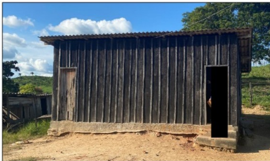
Imagem: Vista externa do alojamento fornecido aos empregados [REDACTED] ueiro.

Esse alojamento era composto por um único cômodo desguarnecido de móveis - exceto por uma bancada rústica de madeira e um velho armário de metal -, e era também utilizado como local de preparo e tomada de refeições, além de local de pernoite dos obreiros. Sobre a bancada, os trabalhadores deixavam sacos com alimentos, panelas, pertences de uso pessoal e um fogão a gás de duas bocas. Ao lado dela, no chão do local, havia dois botijões de gás, utilizados no preparo das refeições. No armário de metal eram acondicionados materiais diversos para uso no desenvolvimento das atividades laborais.