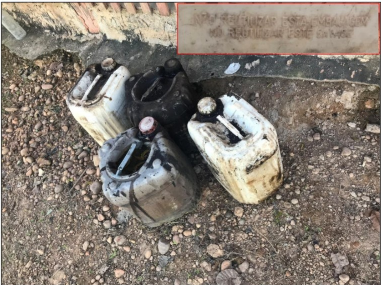
Imagem: Vasilhames de agrotóxicos eram reutilizados para armazenar piche. No detalhe, inscrição “NÃO REUTILIZAR ESTA EMBALAGEM”, que existia no vasilhame.

Foi verificada a reutilização na propriedade rural de vasilhame de ACLAMADO BR, herbicida seletivo de ação sistêmica, classificação toxicológica II (altamente tóxico), e de outro produto tóxico, cujo conteúdo original não foi identificado, pois estava com rótulo danificado, sendo observadas, no entanto, as marcações na embalagem, em alto relevo, do aviso “NÃO REUTILIZAR ESTA EMBALAGEM”. Os vasilhames citados estavam cheios de piche para passar nas estacas das cercas em construção na Fazenda e estavam localizados em frente à moradia familiar ocupada pelo empregado [REDACTED]