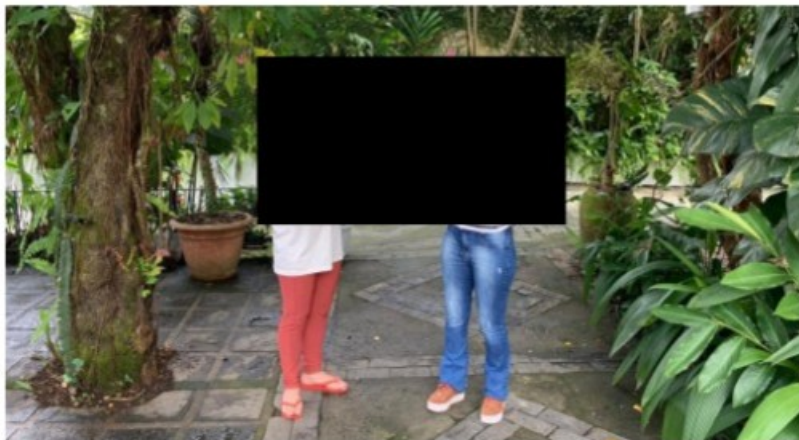
Entrevista com a Sra. [REDACTED] arrumadeira da Pousada

A partir da solicitação da fiscalização, a Sra. [REDACTED] entrou em contato com a proprietária da Pousada, que estava em sua residência e chegou ao local em cerca de 20 minutos, acompanhada pelo Sr. [REDACTED] apresentado à equipe como um "parente" da empresária que havia chegado ao local após a Sra. [REDACTED] ter sofrido um Acidente Vascular Cerebral (AVC), com o objetivo de ajudar na administração do negócio.