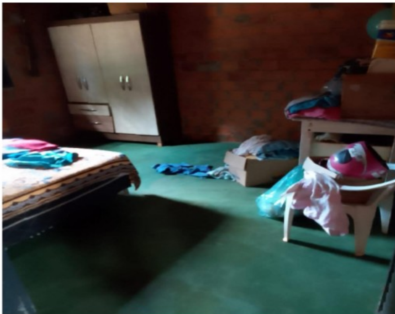
Quarto com cama e armário