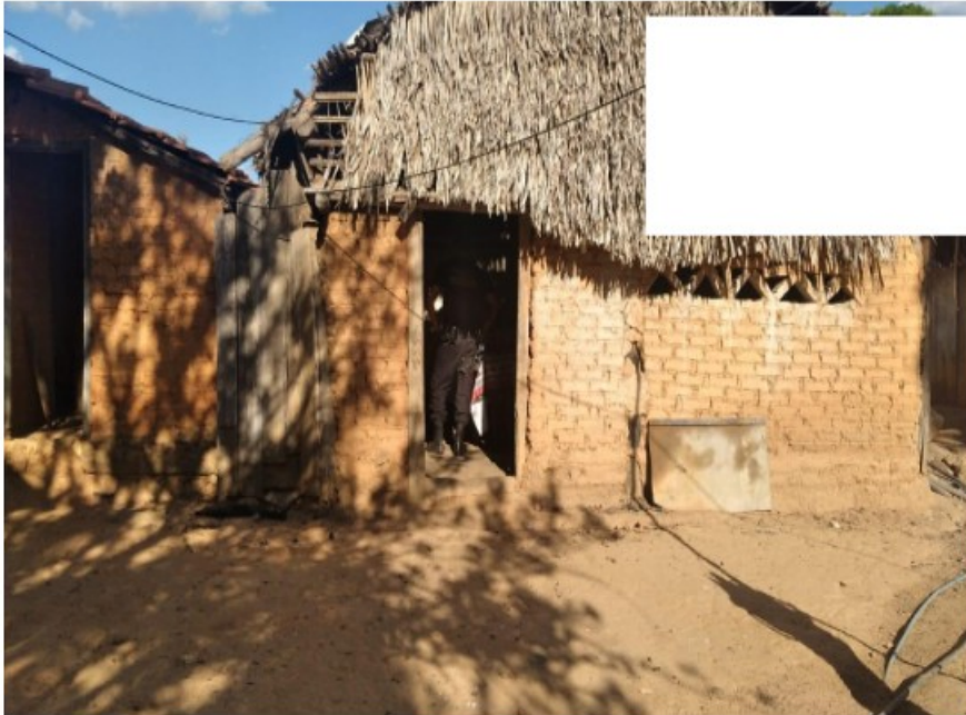
Casa antiga do vaqueiro

SERVIÇO PÚBLICO FEDERAL MTE- AUDITÓRIA FISCAL DO TRABALHO SUPERINTENDÊNCIA REGIONAL DO TRABALHO 302 NORTE, AV NS 02, LT 03, PALMAS/TO, CEP 77006-340 – TEL 3218-6015