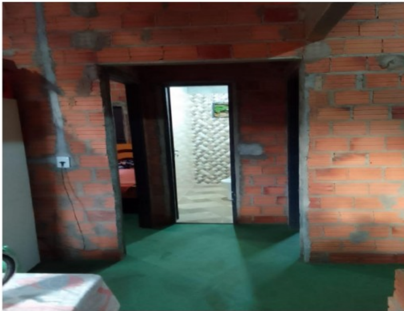
Nova casa com piso lavável

SERVIÇO PÚBLICO FEDERAL MTE- AUDITÓRIA FISCAL DO TRABALHO SUPERINTENDÊNCIA REGIONAL DO TRABALHO 302 NORTE, AV NS 02, LT 03, PALMAS/TO, CEP 77006-340 – TEL 3218-6015