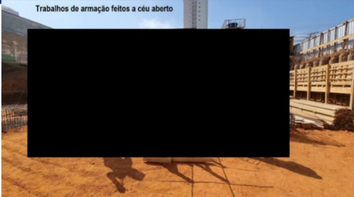
Trabalhos de armação feitos a céu aberto

32) NR-18, item 18.9.1 c/c 18.9.4.1 e 18.9.4.2 É obrigatória a instalação de proteção coletiva onde houver risco de queda de trabalhadores ou de projeção de materiais e objetos no entorno da obra, projetada por profissional legalmente habilitado (a área de circulação entre a escavação e a área de vivência não está com proteção contra quedas). A proteção, quando constituída de anteparos rígidos com fechamento total do vão, deve ter altura mínima de 1,2 m (um metro e vinte centímetros). A proteção, quando constituída de anteparos rígidos em sistema de guarda-corpo e rodapé, deve atender aos seguintes requisitos: a) travessão superior a 1,2 m (um metro e vinte centímetros) de altura e resistência à carga horizontal de 90 kgf/m (noventa quilogramas-força por metro), sendo que a deflexão máxima não deve ser superior a 0,076 m (setenta e seis milímetros); b) travessão intermediário a 0,7 m (setenta centímetros) de altura e resistência à carga horizontal de 66 kgf/m (sessenta e seis quilogramas-força por metro); c) rodapé com altura mínima de 0,15 m (quinze centímetros) rente à superfície e resistência à carga horizontal de 22 kgf/m (vinte e dois quilogramas-força por metro); d) ter vãos entre travessas