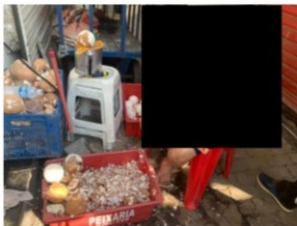
A Sra. [REDACTED] durante a verificação física no estabelecimento

A partir dos dados recebidos, a equipe esteve no local e verificou a presença da Sra. [REDACTED] [REDACTED] que no momento da entrevista estava descascando cocos. Indagada, a Sra. [REDACTED] informou que é proprietária do estabelecimento e atua na Feira de São Cristóvão há 46 anos, sendo uma das primeiras comerciantes do local.