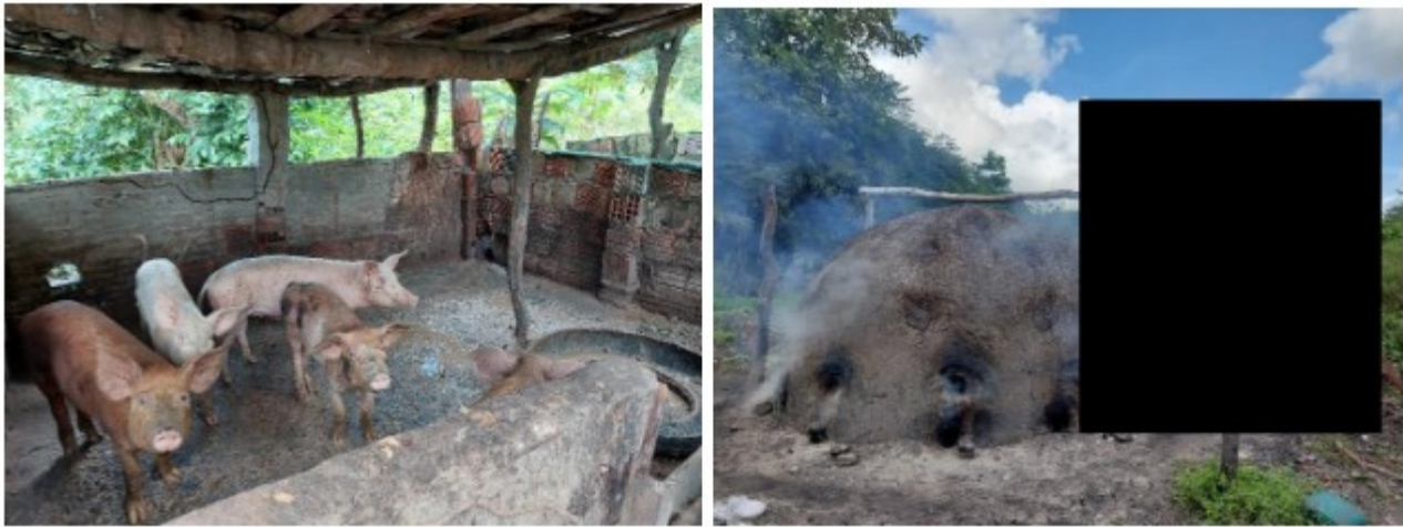
Figura 1 e 2 Atividades exploradas no sítio Poró: criação de suínos e produção de carvão vegetal.