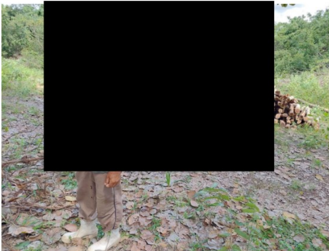
Figura 3 Trabalhadores [redacted] laborando na retirada de madeira.

Através das entrevistas com os trabalhadores e com o proprietário, constatamos a utilização de mão de obra sem a devida formalização do contrato de trabalho, apesar de presentes todos os requisitos da relação de emprego: a) subordinação (prestavam serviços ao empregador, do qual recebiam ordem direta ou indiretamente, b) pessoalidade, c) onerosidade (recebiam a contraprestação pelos serviços prestados, d) habitualidade (trabalhavam de segunda a sexta em horários predeterminados pela empregador).