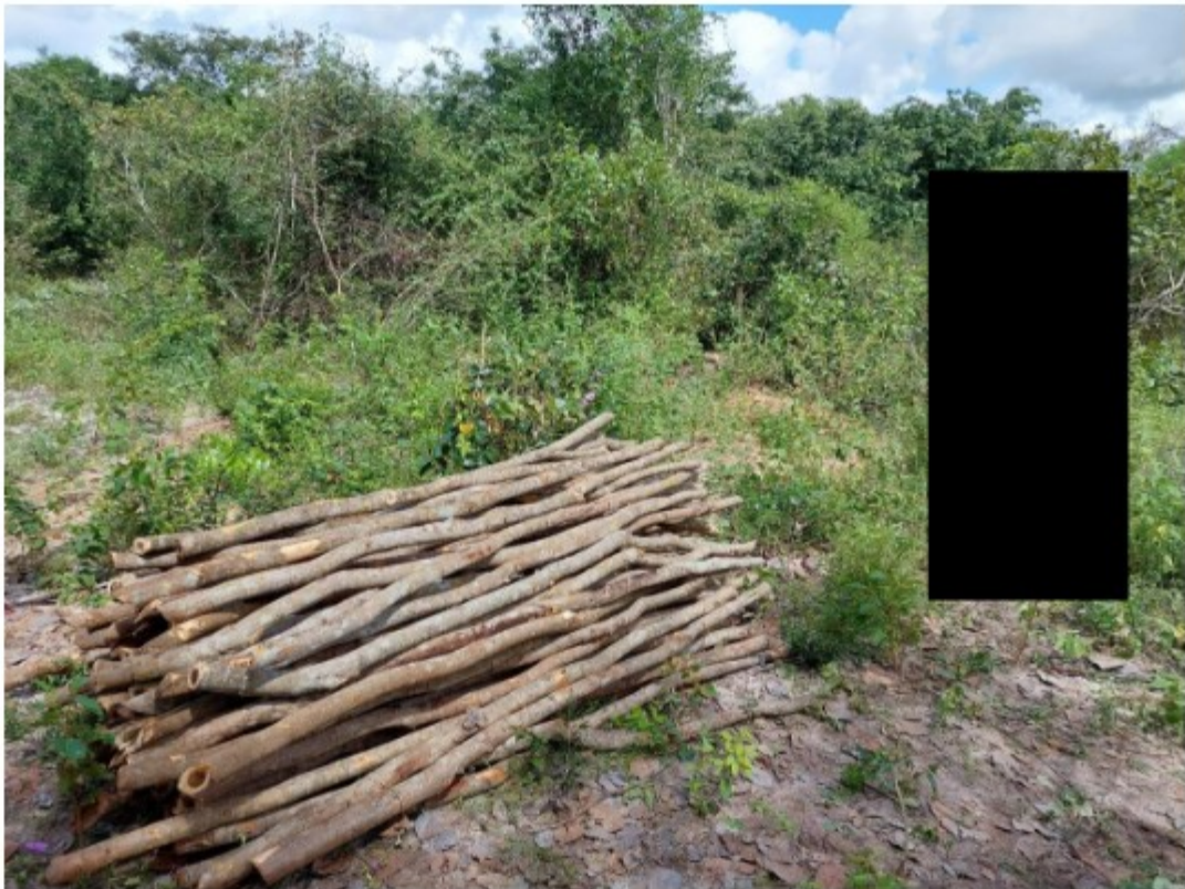
Figura 4 Trabalhador laborando no corte de madeira sem qualquer EPI - Equipamento de Proteção Individual.