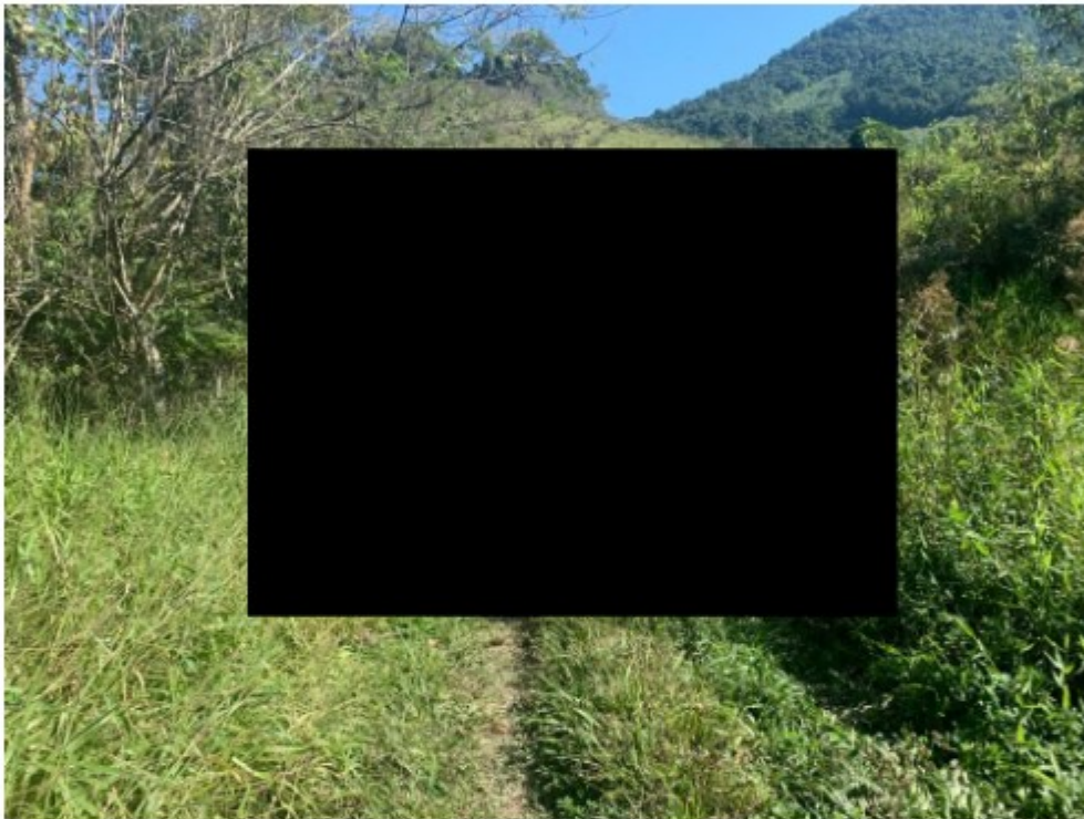
Busca foi realizada em área rural com muitas propriedades

Superada a etapa de busca, após quatro horas de procura, a equipe da Auditoria-Fiscal do Trabalho deslocou-se ao mercado Vidal, no distrito de Papucaia, para tentar localizar a sobrinha do trabalhador, citada também na denúncia.