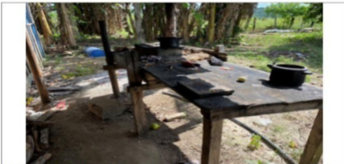
Local para preparo dos alimentos dos trabalhadores

Assim, de um modo geral, apesar das irregularidades encontradas, as condições de trabalho e vida oferecidas aos trabalhadores que ali prestavam serviço eram ruins, mas passíveis de regularização por medidas simples, e não chegavam a ser degradantes. As fotos a seguir ilustram a realidade encontrada pelo GEFM: