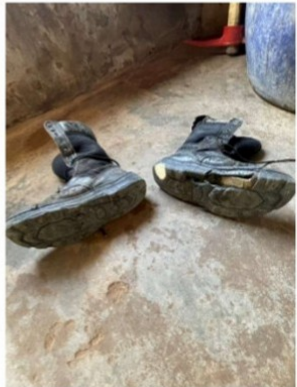
Figura 21 - Botas do trabalhador. Ganhou há muitos anos, Figura 22 - Solado da bota danificado, mas não do patrão.