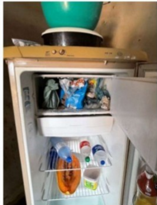
Figura 9 - Detalhe do congelador da geladeira.