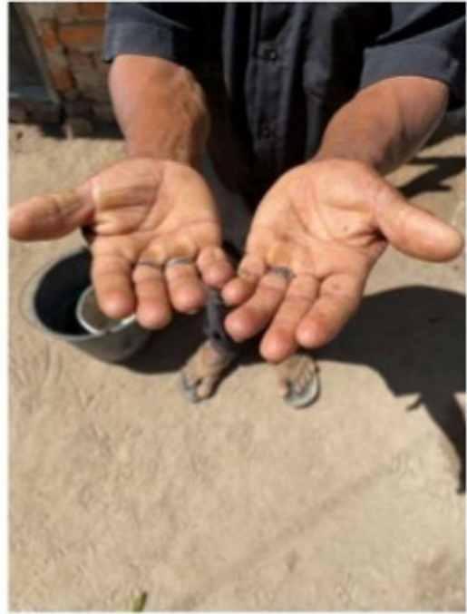
Figura 19 - Palmas das mãos do trabalhador.