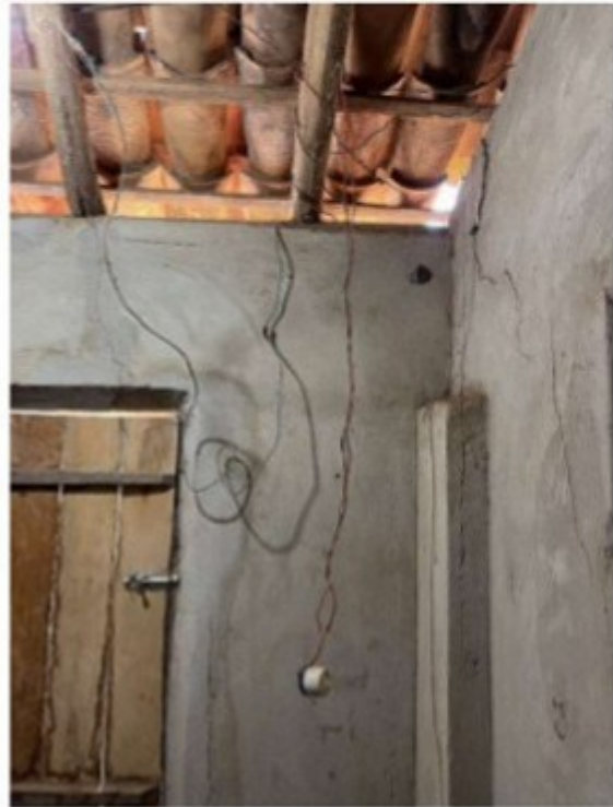
Figura 3 - Instalação elétrica precária no quarto do trabalhador.