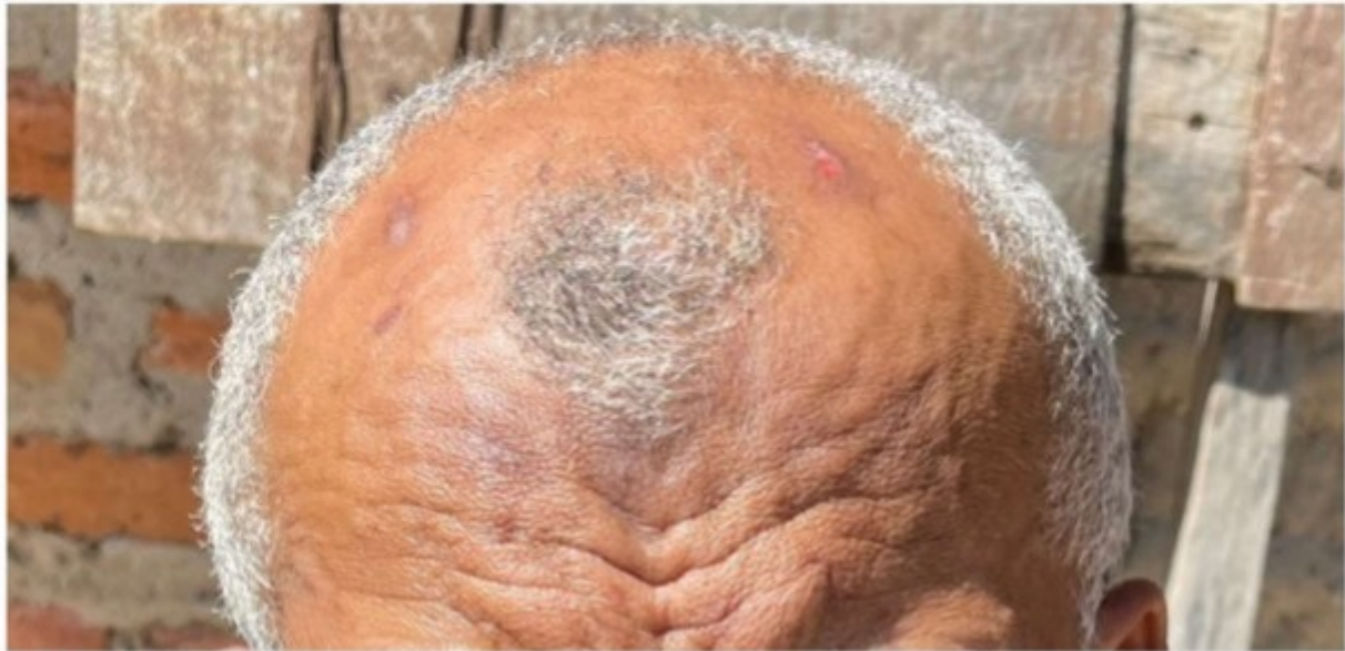
Figura 20 - Feridas na cabeça do trabalhador em decorrência de grave doença há cinco meses.