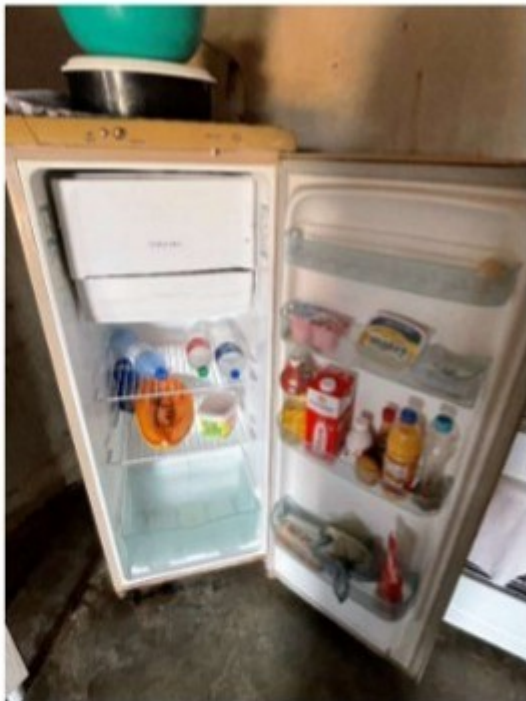
Figura 8 - Geladeira.