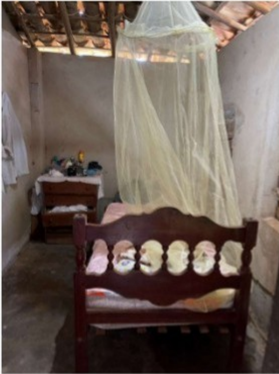
Figura 2 - Quarto do trabalhador. Ausência de vedação de teto.