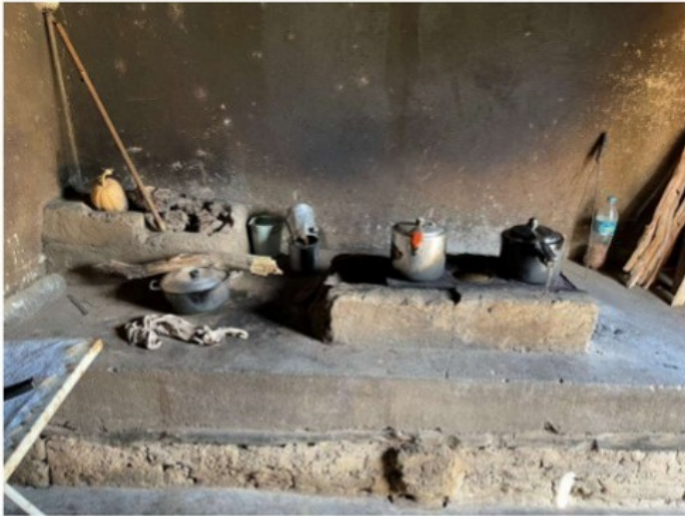
Figura 10 - "Cozinha" à disposição do trabalhador. Fogareiro de lenha.