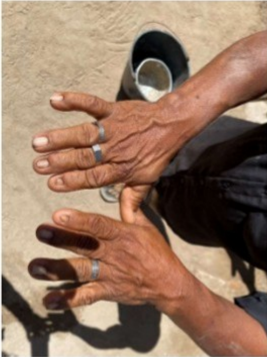
Figura 18 - Dorsos das mãos do trabalhador.