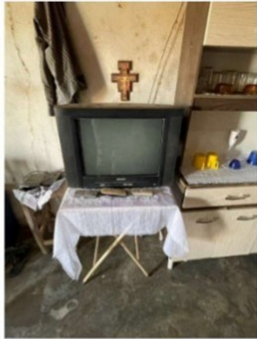
Figura 7 - Televisão que o trabalhador não tinha permissão para usar para não gastar o "cartão da TV".