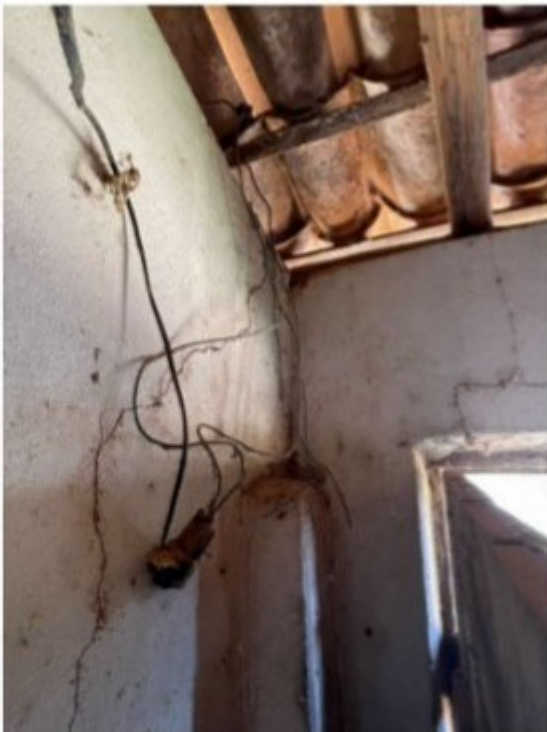
Figura 4 - Instalações elétricas precárias na sala.