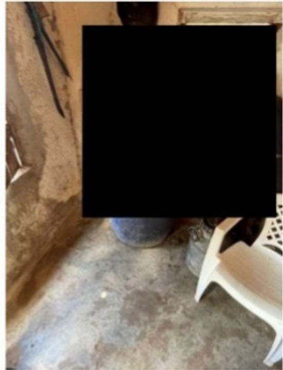
Figura 13 - Bombona de armazenamento da água para consumo direto.