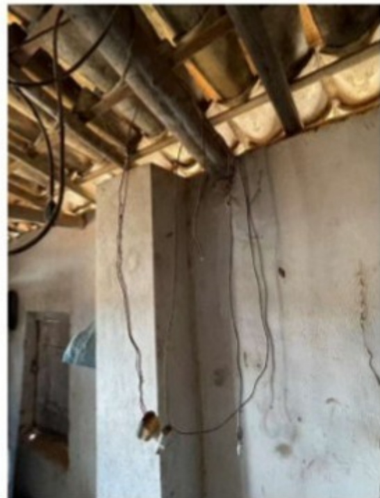
Figura 5 - Outras instalações elétricas precárias na sala.