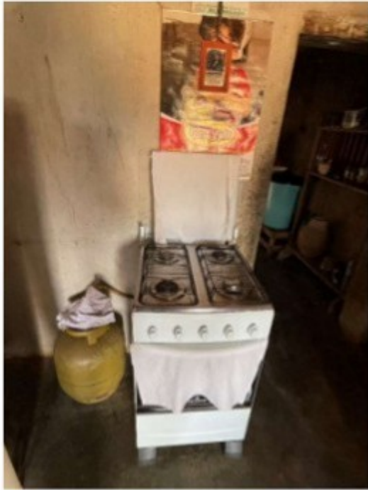
Figura 6 - Fogão que o trabalhador não tinha autorização para usar para não gastar o gás.