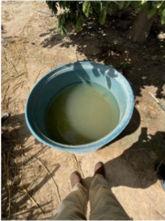
Figura 12 - Água utilizada na higienização dos utensílios domésticos e para o banho do trabalhador.