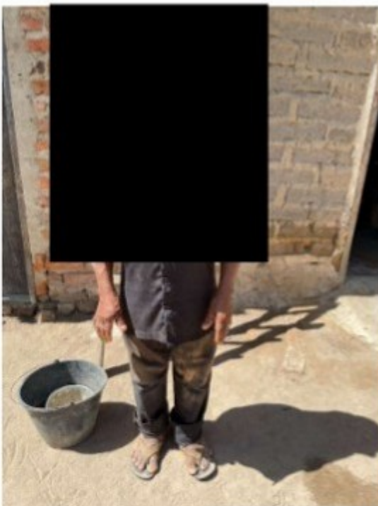
Figura 16 - O trabalhador