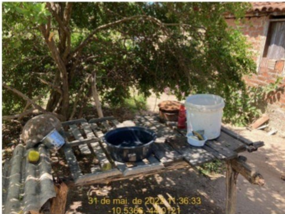
Figura 11 - Local de "higienização" dos utensílios da cozinha.