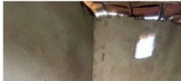
Figura 15 - Banheiro sem chuveiro, nem água encanada.