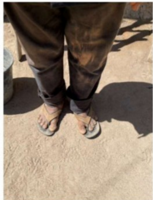
Figura 17 - Pés do trabalhador.