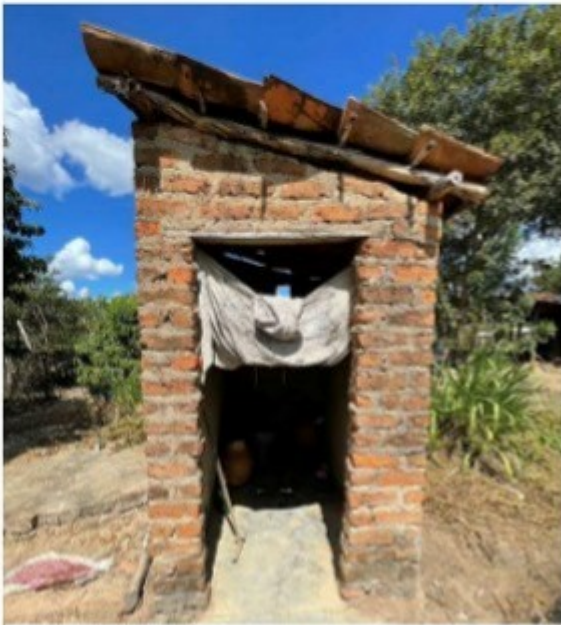
Figura 14 - Banheiro.