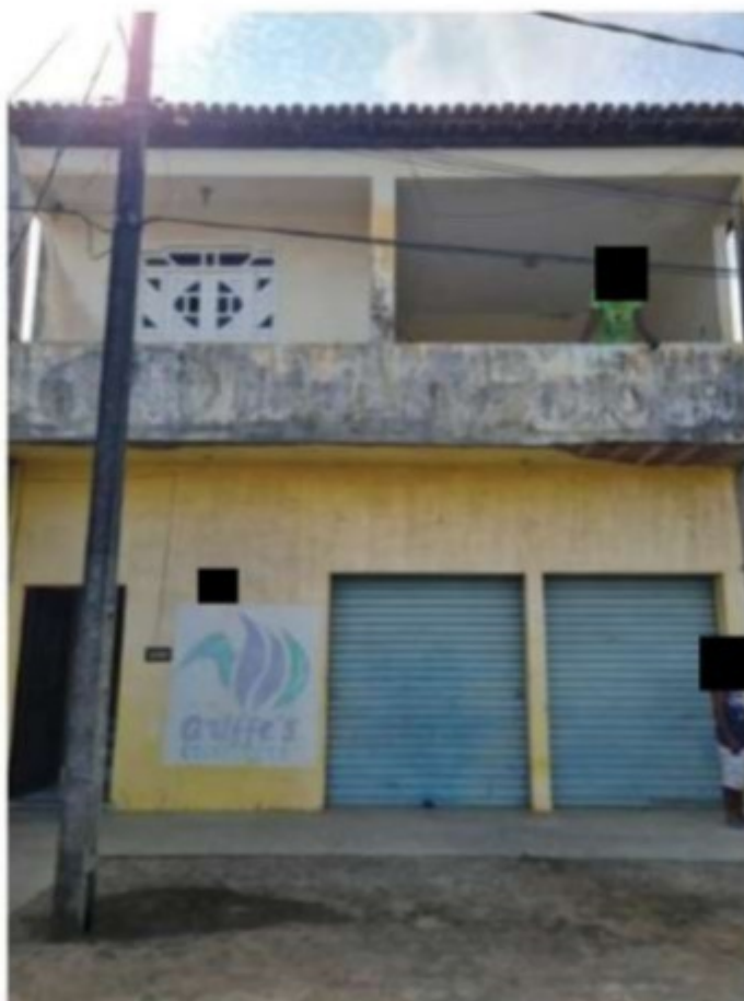
Alojamento/casa da Av. Quintino Bocaiuva, [REDACTED] (Rod SE 339), em Capela/SE.

Não se via, na relação de emprego, em especial dos trabalhadores migrantes, alojados, trazidos pela empresa para cortar cana em Sergipe, o mínimo resquício de preservação do valor social do trabalho.