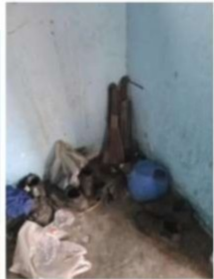
Imagens acima: Ambientes do alojamento/casa de 10 dos 11 trabalhadores resgatados.

Importante salientar que, após a fiscalização do dia 25 de janeiro de 2022, por entender que as condições do alojamento eram precárias e inadequadas, mantendo os trabalhadores, incluindo ao menos três gripados, sem um mínimo de distanciamento, ventilação, higiene e limpeza, foi determinado pela equipe de fiscalização a imediata retirada dos trabalhadores da casa/alojamento, os quais foram acomodados pela empresa em epígrafe, na Pousada Coco Verde, imediatamente vizinha a casa/alojamento, com o fornecimento de três refeições diárias até a finalização do presente resgate.