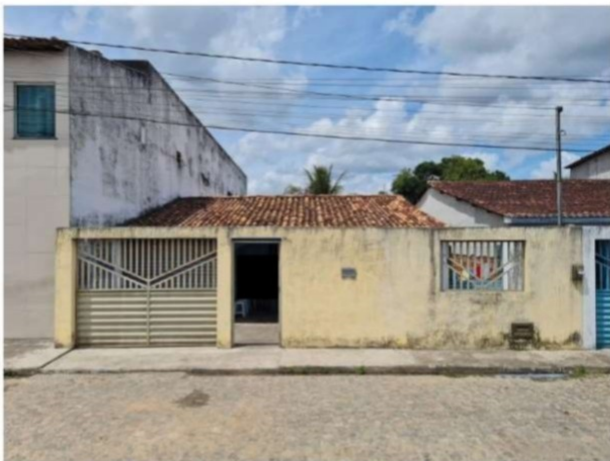
Alojamento/casa localizada na Rodovia Manoel Vieira Dantas [REDACTED] Capela/SE

Nessa casa, que alojava 10 trabalhadores, as camas eram insuficientes, havia colchões dispostos diretamente no chão, ou simplesmente plásticos estendidos no chão para servirem de "cama". Também verificamos a inexistência de qualquer armário, que deveriam possuir compartimentos individuais, a fim de permitir a guarda, a separação e a organização das roupas pessoais e vestimentas dos trabalhadores. Os pertences pessoais estavam guardados em mochilas, sacolas, malas no chão ou por cima das camas. Estas não possuíam roupa de cama, que não foi fornecida pela empresa. Quem possuía algum lençol ou coberta era porque tinha trazido de casa. Tampouco havia janelas para ventilação em dois "quartos" adaptados. E inexistência de recipientes para a coleta de lixo nos quartos ou área social da casa. Observamos também pelo menos três trabalhadores visivelmente com suspeita de gripe (doença infectocontagiosa), já que corizavam e tossiam muito, e não tinham sido submetidos a avaliação médica para permanência na casa/alojamento, tampouco recebido, por parte da empresa, qualquer máscara ou outro tipo de proteção facial. A instalação sanitária não dispunha de sabão ou sabonete, papel toalha, papel higiênico e lixeira, estando longe de ser mantido em condição de conservação, limpeza e higiene. Na verdade, o banheiro estava muito sujo, com forte odor, sem que a empresa tenha disponibilizado algum funcionário específico para manter e