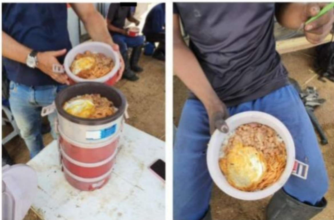
Imagens acima: Quentinhas fornecidas pela empresa aos trabalhadores alojados, nas frentes de trabalho de corte de cana, no canavial, com arroz, feijão, macarrão e um único ovo.

Assim, tal desconto a título de alimentação no valor de R$ 300,00 por mês não só configura retenção parcial do salário do trabalhador, induzido ou coagido a adquirir bens ou serviços do empregador ou preposto, como também são valores referentes a gastos que, com as características acima expostas, deveriam ser legalmente suportados pelo empregador e não serem cobrados ou descontados do trabalhador.