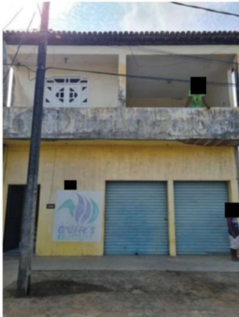
Alojamento/casa da Av. Quintino Bocaiuva, [REDACTED] (Rod SE 339), em Capela/SE.

Esse alojamento/casa também não possuía nenhum empregado designado pela VF para realizar a limpeza e arrumação, bem como a empresa também deixou de fornecer ao trabalhador roupas de cama e armários.