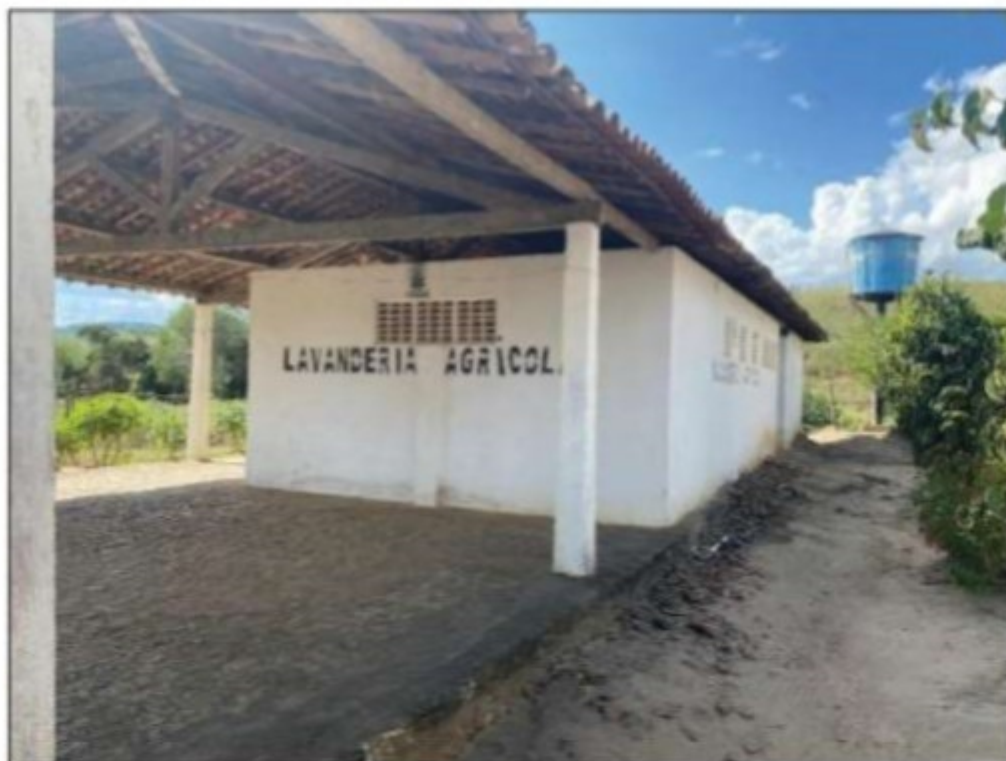
Imagem: Edificação que servia de lavanderia e de local para banho dos aplicadores de agrotóxicos.

Havia outra lavanderia no estabelecimento rural, situada nas coordenadas geográficas 08°58'10.6"S 35°59'35.6"W, que foi apresentada à equipe de fiscalização pelo empregado [REDAZIDA] técnico de segurança, como local para banho para todos os trabalhadores envolvidos em trabalhos com defensivos agrícolas, após finalizadas todas as atividades envolvendo o preparo ou aplicação de agrotóxicos e/ou aditivos e/ou adjuvantes e/ou produtos afins.