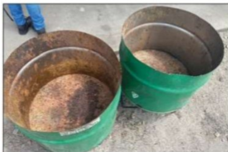
Imagem: Lixeiras que ficavam ao lado do local para refeições não possuíam tampas.

Por fim, embora existissem no ambiente dois recipientes de metal pintados na cor verde (feitos com um tambor cortado ao meio), que serviam para a coleta do lixo, tais lixeiras não continham tampa, situação que vai de encontro ao item "f" do item 31.17.4.1 da NR-31.