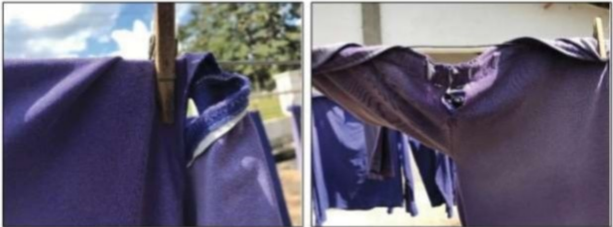
Imagens: Roupas que eram fornecidas aos aplicadores de agrotóxicos estavam em péssimo estado de conservação.