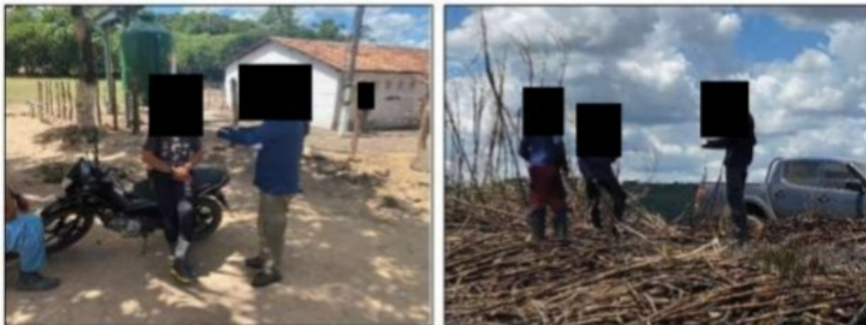
Imagens: Integrantes do GEFM entrevistando trabalhadores no dia da inspeção na Usina.

14/02/2022, às 09:00 horas, na sede da Superintendência Regional do Trabalho em Alagoas (local posteriormente alterado para a sede do Procuradoria Regional do Trabalho da 19ª Região, situada à Rua Professor Lourenço Peixoto, nº 90, Quadra 36, Loteamento Stella Maris, Maceió/AL), os documentos referentes ao cumprimento das obrigações trabalhistas.