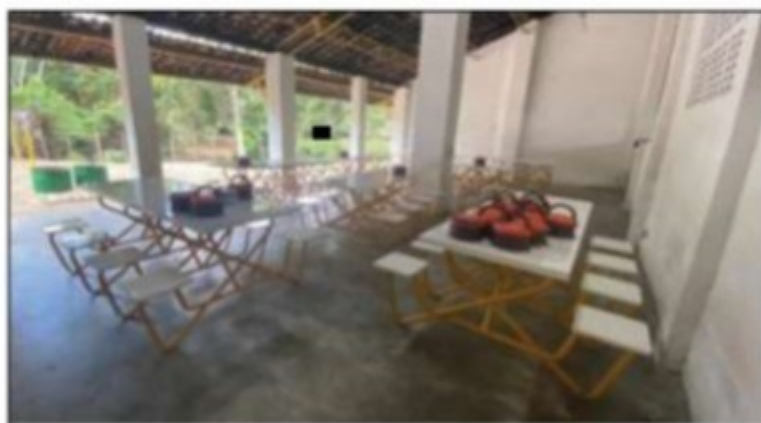
Imagem: Local onde os empregados realizavam as refeições. Não havia água para higienização, nem para beber.

Além disso, não existia no local bebedouro ou filtro no qual os trabalhadores pudessem obter água potável para beber, fato que vai de encontro ao disposto na alínea "e" do item 31.17.4.1 da NR-31.