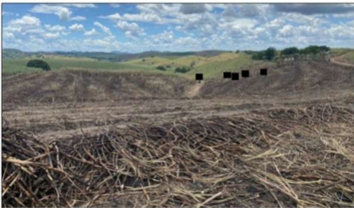
Imagem: Uma das frentes de trabalho em que os cortadores de cana foram encontrados. Não havia instalações sanitárias.

Outrossim, as inspeções realizadas pela equipe fiscal permitiram verificar a veracidade das informações prestadas pelos empregados quanto à inexistência de instalação sanitária, haja vista que nas frentes de trabalho não existia sequer fossa seca, também permitida pela legislação, de modo que os trabalhadores eram obrigados a utilizar o mato das imediações para satisfazerem suas necessidades de excreção.