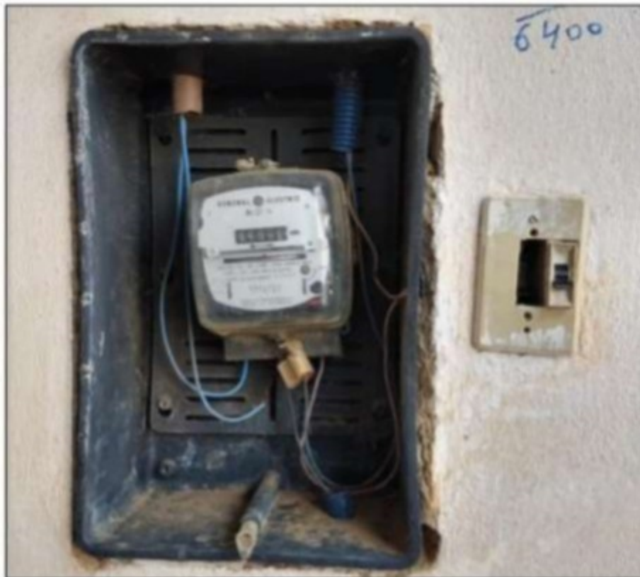
Imagem: O quadro de distribuição de energia da lavanderia não continha tampa e apresentava fios expostos e até desencapados.

(porta de acesso), deixando à mostra e acessível a qualquer pessoa a fiação elétrica ali existente, que estava solta e desencapada (continha partes vivas expostas), condição incapaz de prevenir perigos de choque elétrico e outros tipos de acidentes. A referida caixa de luz ficava no corredor de passagem entre dois cômodos da edificação, local de circulação dos trabalhadores que utilizavam os chuveiros para fazer o asseio no final do expediente de trabalho, além da empregada que fazia a lavagem das roupas, Sra. [REDACTED]