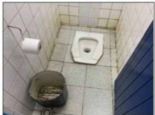
Imagens: Superior, vista externa das instalações sanitárias; inferiores, bacias turcas que haviam no local.