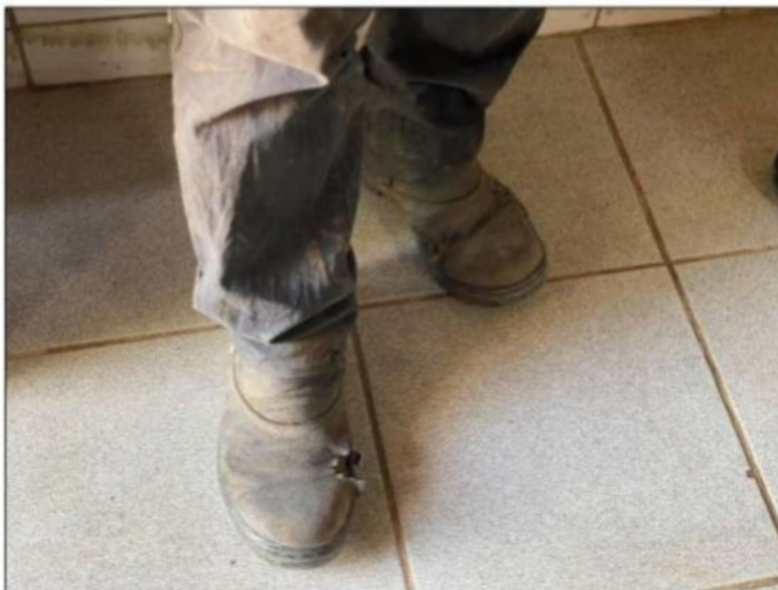
Imagem: Botas do trabalhador estavam em péssimo estado de conservação e não haviam sido substituídas pelo empregador.

Durante a inspeção na cozinha do estabelecimento, o GEFM entrevistou o empregado zelador, que estava utilizando uma bota de segurança em péssimas condições de conservação, contendo furos, razão pela qual não oferecia a segurança adequada ao trabalhador. Quando indagado sobre as condições do EPI, ele informou que o empregador não efetuou a substituição do equipamento.