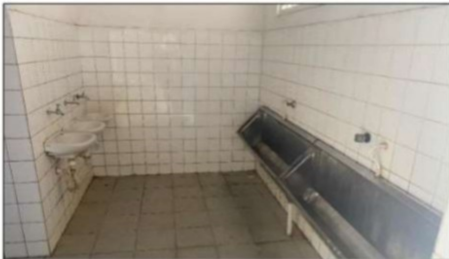
Imagem: As instalações sanitárias não estavam guardadas de sabão ou sabonete e de papel toalha.

Além disso, não foram encontrados sabão ou sabonete nem papel toalha para secagem das mãos, situação que contraria o disposto no item 31.17.3.3, alínea "d", da NR-31. As entrevistas com os trabalhadores ainda revelaram que o empregador não forneceu sabão ou sabonete e nem papel toalha aos empregados, de modo que os itens de higiene utilizados por eles eram adquiridos com recursos próprios.