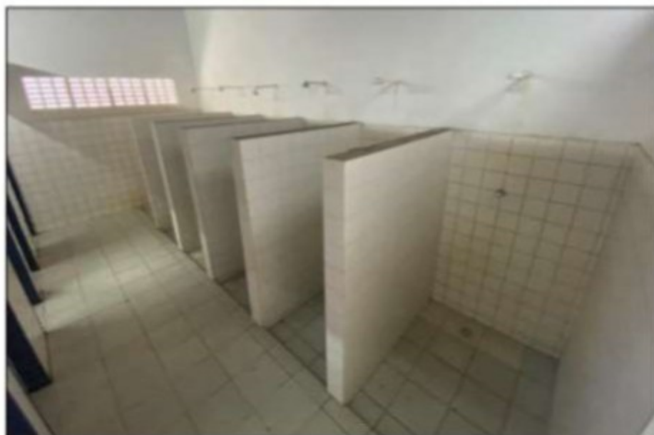
Imagem: Os compartimentos dos chuveiros não possuíam portas.

Por fim, os compartimentos individuais dos chuveiros não possuíam portas, acarretando o devassamento da privacidade dos trabalhadores, bem como não dispunham de suportes para sabonete e para toalha. Tais situações contrariam o disposto nos itens 31.17.3.4, alínea "c", e 31.17.3.4.1 da NR-31.