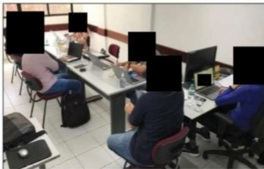
Imagens: Integrantes do GEFM recebendo e analisando documentos apresentados pela empresa.

No dia 14/02/2022 o representante da empresa, Sr. [REDAZIDO] nomeado por meio de Carta de Preposição (CÓPIA ANEXA) , compareceu à PRT da 19ª Região acompanhado do advogado [REDAZIDO] nomeado por meio de Procuração (CÓPIA ANEXA) , quando apresentaram os documentos requisitados em NAD, salvo os comprovantes de acesso dos trabalhadores aos órgãos de saúde com a finalidade de prevenção e profilaxia de doenças endêmicas e de aplicação de vacina antitetânica e outras. Os documentos foram analisados e devolvidos na mesma oportunidade.