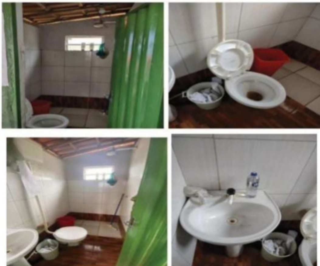
Foto 26 a 29: Banheiro dos trabalhadores, no momento da inspeção estava sem água