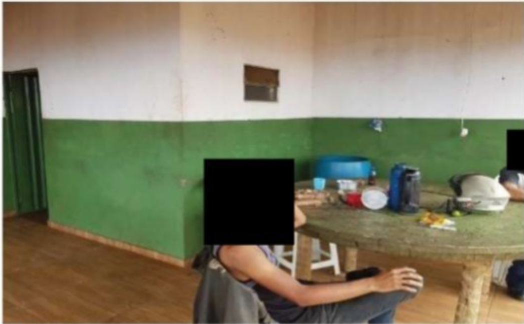
Foto 11: Mesa que ficava na área externa da casa que servia de alojamento para três trabalhadores