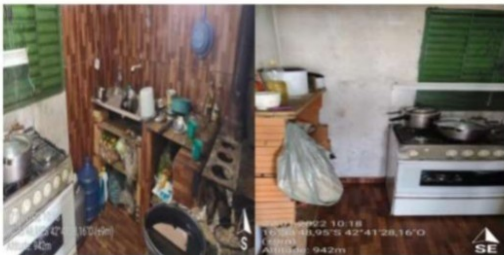
Fotos 12 e 13 : Cozinha utilizada pelos três trabalhadores alojados