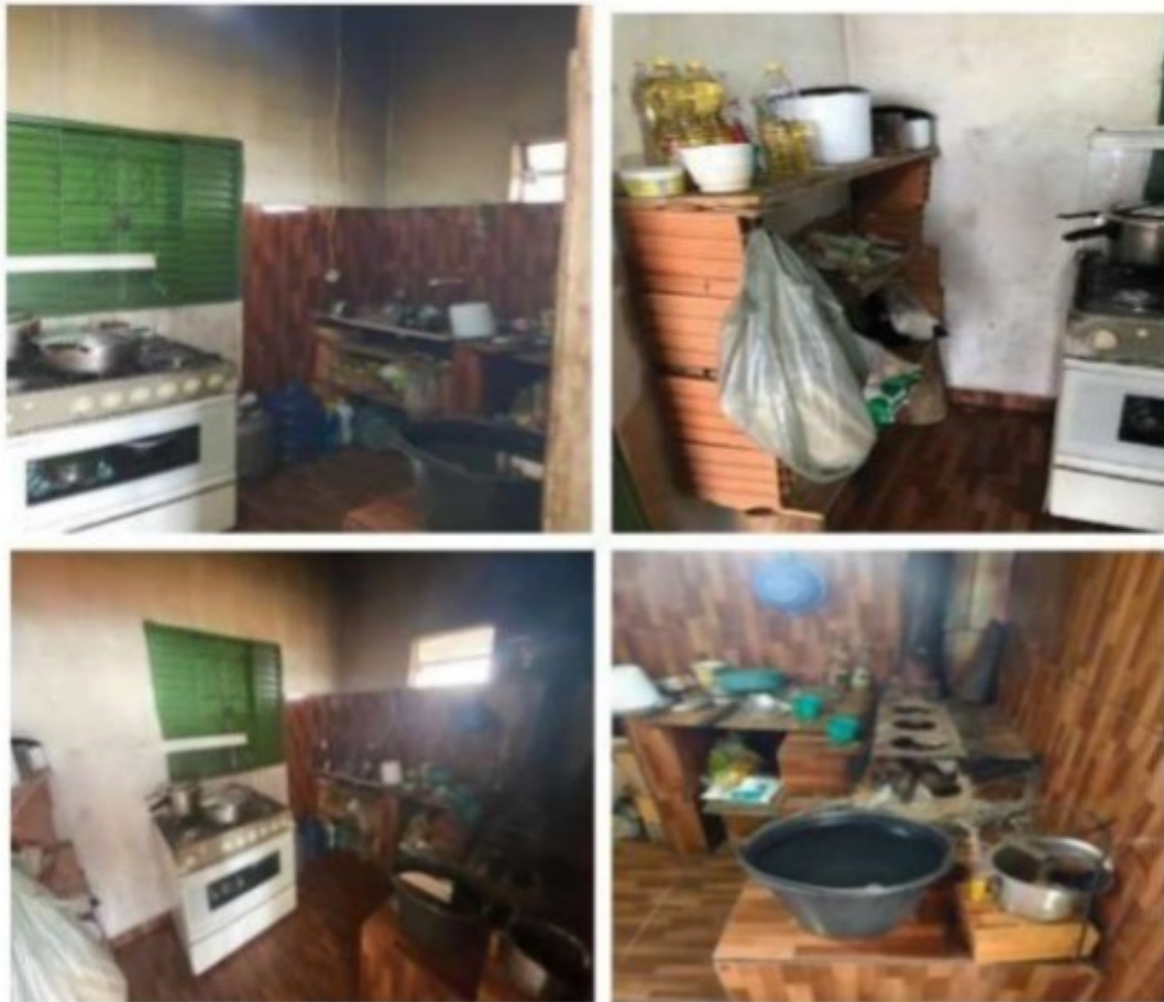
Fotos 14 e 17: Cozinha utilizada pelos três trabalhadores alojados