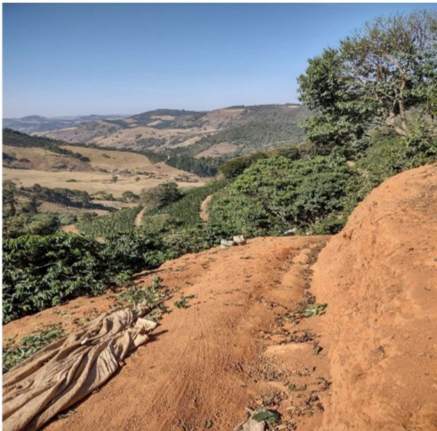
Fotos 1 e 1: frente de trabalho de colheita manual de café no [REDACTED]