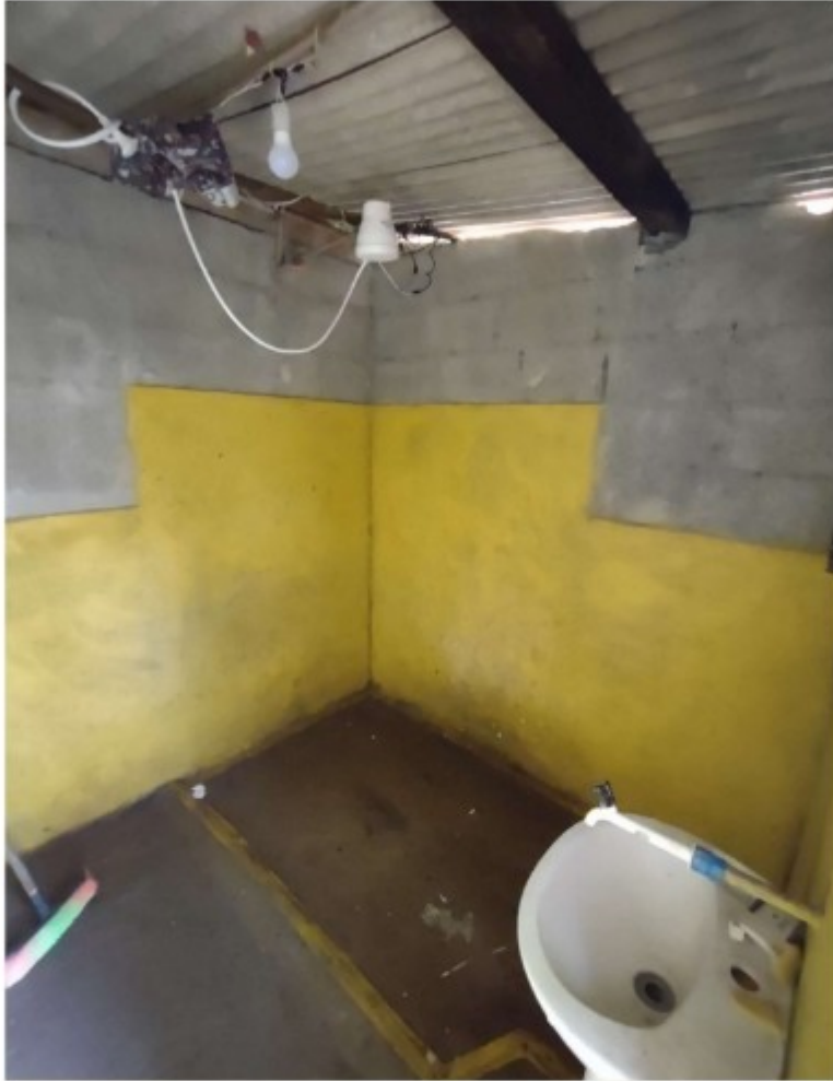
Fotos 6 e 7: Instalações elétricas com risco de choques no alojamento.

Ministério da Economia Secretaria do Trabalho Subsecretaria de Inspeção do Trabalho Divisão de Fiscalização para Erradicação do Trabalho Escravo Grupo Especial de Fiscalização Móvel-GEFM