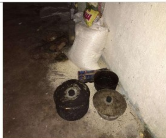
Foto 10: Panelas e alimentos utilizados pelo trabalhador – ausência de locais adequados para guarda e armazenamento