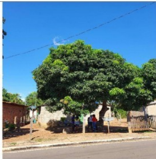
Foto 13: Casa de trabalhadores em Nossa Senhora do Livramento/MT para onde o trabalhador foi levado, após o resgate.