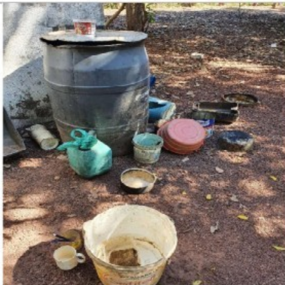
Foto 02: galão de água e vasilhas utilizadas para consumo de água e refeições