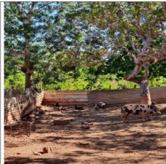
Foto 12: chiqueiro situado próximo à cada onde o trabalhador dormia – o local estava infestado de urubus, pois os porcos eram alimentados com ossadas bovinas e carnes de descarte, que também eram ofertadas ao trabalhador.

MINISTÉRIO DA ECONOMIA SECRETARIA ESPECIAL DE PREVIDÊNCIA E TRABALHO SECRETARIA DE TRABALHO SUBSECRETARIA DE INSPEÇÃO DO TRABALHO SUPERINTENDÊNCIA REGIONAL DO TRABALHO NO ESTADO DE MATO GROSSO