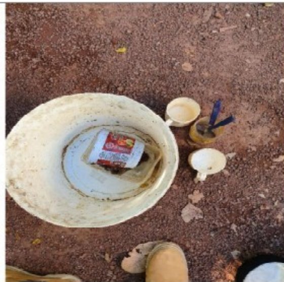
Foto 04: utensílios usados para consumo de água e preparo e consumo de refeições