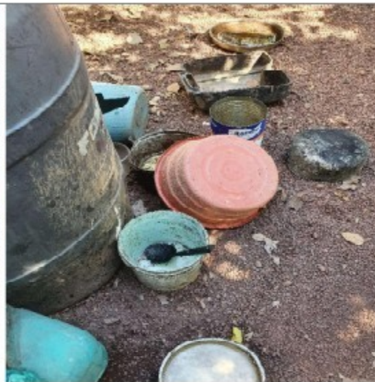
Foto 05: utensílios usados para consumo de água e preparo e consumo de refeições