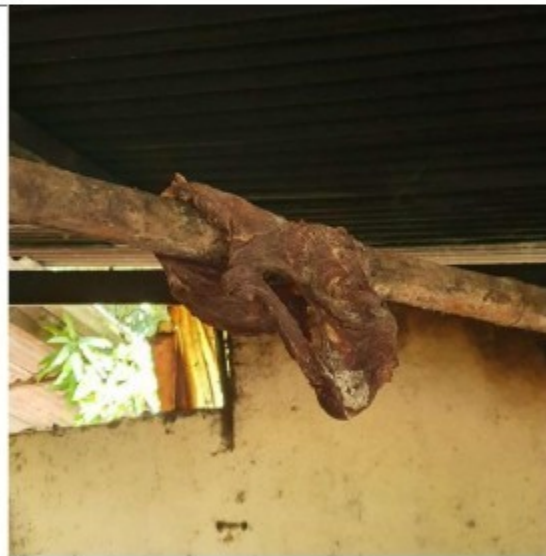
Foto 07: carne de descarte ofertada para o trabalhador e armazenada ao ar livre