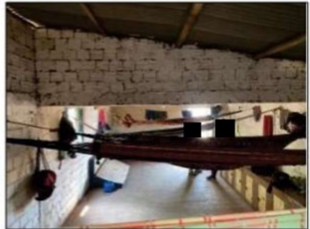
Imagens: Interior do quarto maior da UPC 1, onde dormiam onze trabalhadores.