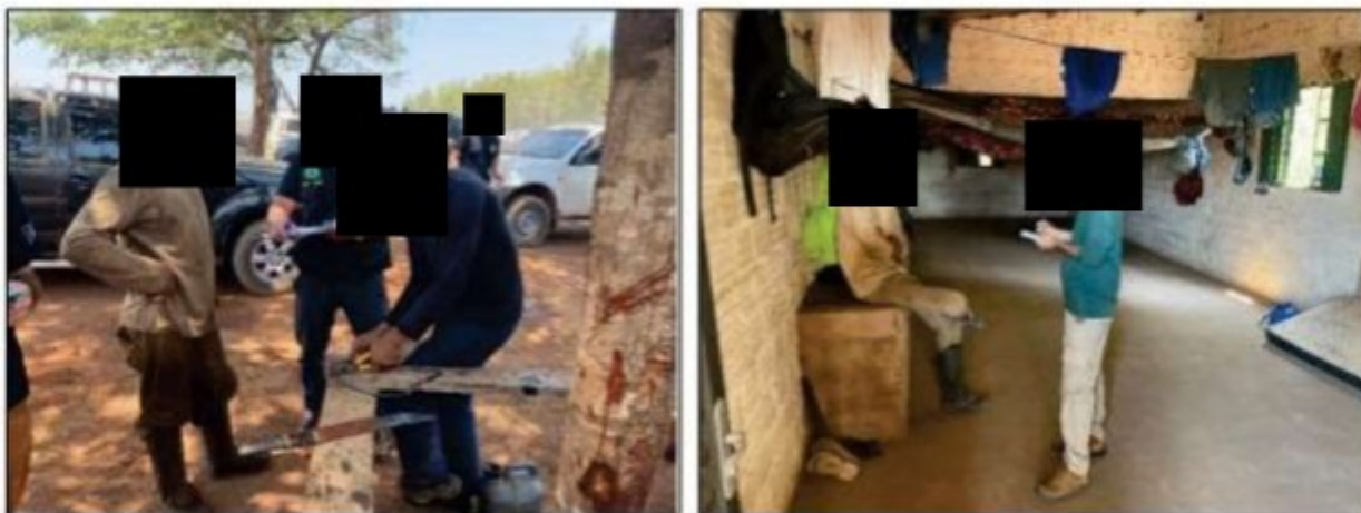
Imagens: Integrantes do GEFM entrevistam trabalhadores ao lado da UPC I e dentro de um dos alojamentos.

No dia da visita do GEFM às fazendas, os trabalhadores lá encontrados foram entrevistados e os ambientes de trabalho e as áreas de vivência foram inspecionados. Ao final das inspeções, a equipe fiscal emitiu e entregou ao representante da empresa a Notificação para Apresentação de Documentos – NAD nº 355259170921/04 (CÓPIA ANEXA) , requisitando que os documentos relativos à esfera trabalhista do estabelecimento fossem apresentados no dia 21/09/2021, às 14h00min, na sede da Delegacia de Polícia Federal em Imperatriz, cujas instalações foram cedidas para utilização por parte da Auditoria-Fiscal do Trabalho.