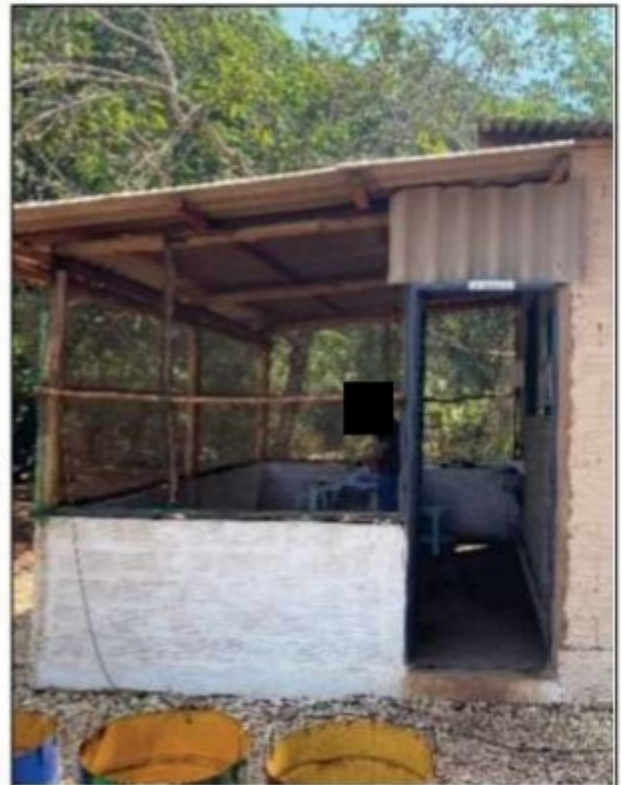
Imagens: Local para refeições que ficava anexo ao alojamento da UPC 1. A quantidade de cadeiras e mesas não era suficiente para atender a todos os empregados.