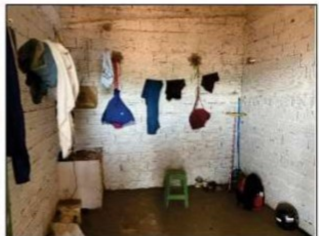
Imagens: Interior do quarto menor da UPC 1, que era ocupado pelos dois encarregados.

A segunda área de vivência ficava instalada no mesmo local onde funcionava a UPC 2. Possuía estrutura semelhante à descrita no parágrafo anterior, porém com um tamanho