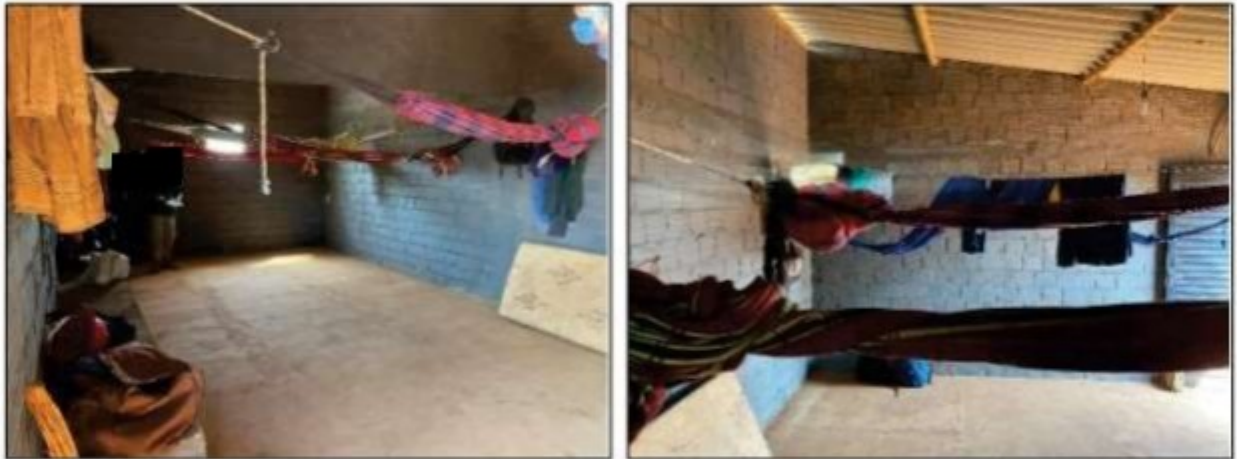
Imagens: Interior do quarto maior da UPC 2, onde dormiam quatro trabalhadores.

menor. Nesta área de vivência havia dois quartos, um maior, de cerca de 4,5 x 9 metros, e um menor, que media cerca de 4,5 x 3 metros. No quarto maior, onde estavam alojados 4 trabalhadores, existia uma janela tipo vitrô, com medida 60 x 40 centímetros. No quarto menor, onde ficava alojado o encarregado [REDACTED] não havia janela.