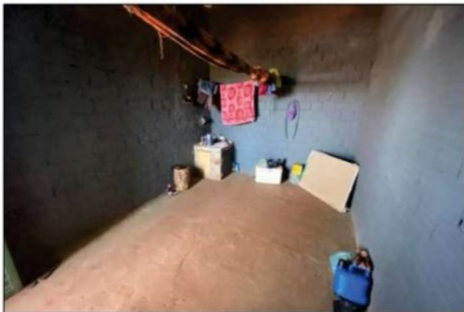
Imagem: Interior do quarto menor da UPC 1, que era ocupado pelo encarregado.

As situações descritas, inexistência de janelas nos alojamentos, demonstram que tais áreas de vivência não possuíam iluminação e ventilação adequadas, podendo causar desde problemas físicos até emocionais aos trabalhadores ali alojados, sobretudo considerando as altas temperaturas típicas da região, bem como o calor e a grande quantidade de fumaça proveniente dos fornos, o que deixava os ambientes inapropriados para o descanso noturno dos trabalhadores.