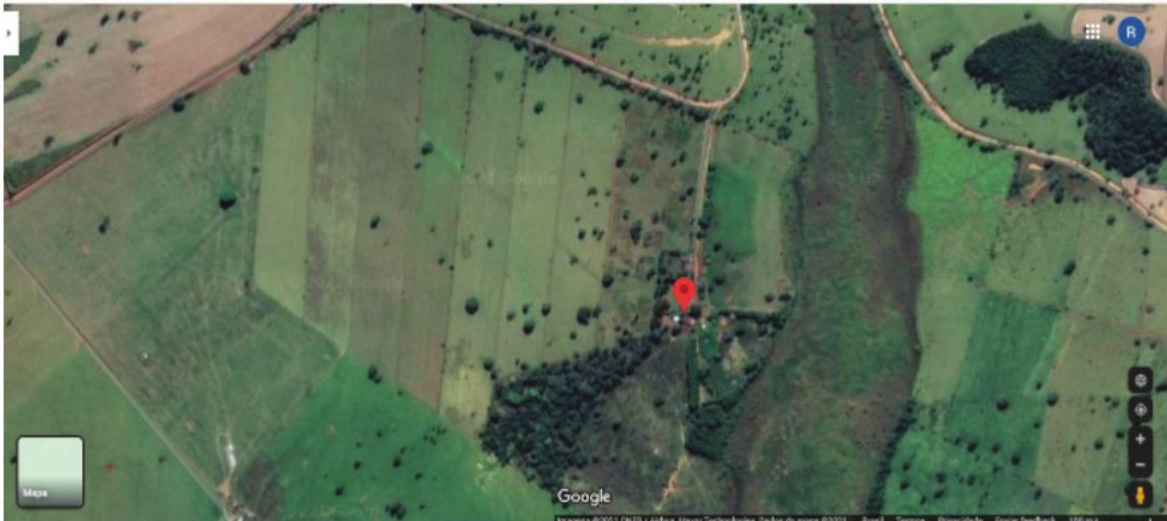
Vista aérea da fazenda – Imagem retirada do Google Maps

Em consulta ao sistema do e-social constatamos que o empregado denunciante senhor [REDACTED] teve seu contrato rescindido em 09/06/2020. E o empregado [REDACTED] teve seu contrato rescindido em 04/11/2020.