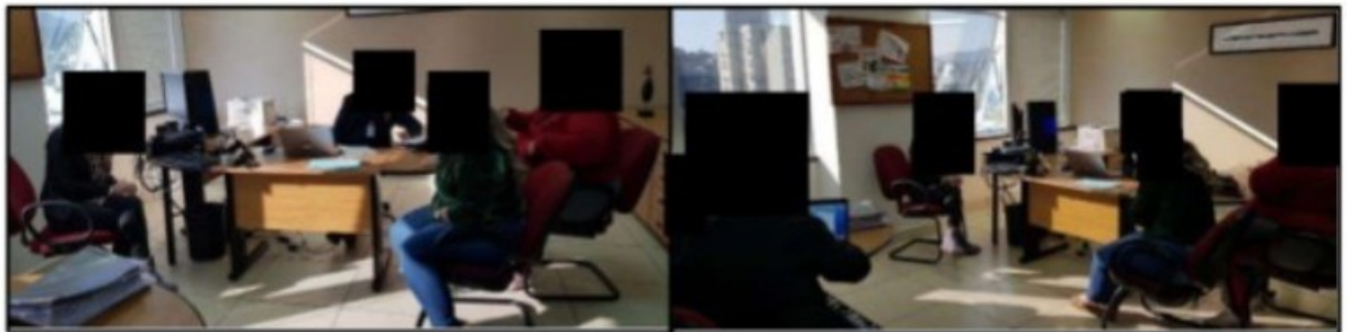
Imagens acima: Integrantes do GEFM colhendo o depoimento da Sra. [REDACTED]

contato [REDACTED] no Ministério Público do Trabalho em Novo Hamburgo, Rua Júlio de Castilhos, 679 - Centro, 8º andar, Novo Hamburgo - RS.