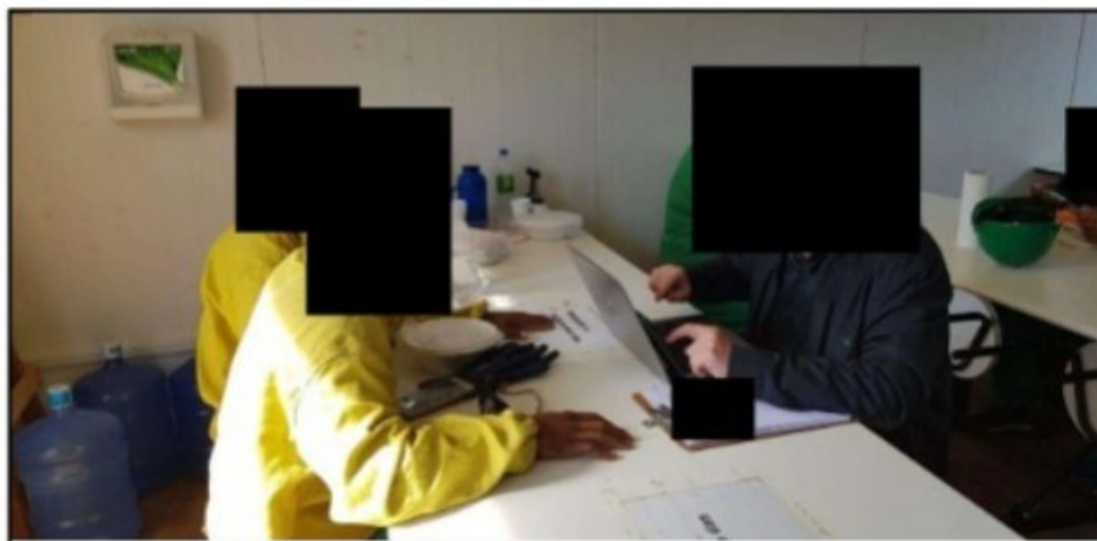
Imagem acima: Depoimento do trabalhador [REDACTED] para um integrante da equipe.

Durante os procedimentos fiscalizatórios no empreendimento, a equipe encontrou o Sr. [REDACTED] Coordenador de Obras de Porto Alegre da empresa, que foi indicado pela Sra. [REDACTED] como a pessoa da MRV encarregada de fazer os contatos com ela e fazer as solicitações. Nesse momento o GEFM solicitou ao empregado que prestasse esclarecimentos, o que foi reduzido a Termo.