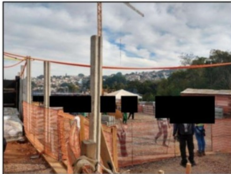
Imagem acima: Inspeção nos locais de trabalho.

No dia da visita do GEFM ao empreendimento, em 14/05/2021, os locais de trabalho foram inspecionados e os trabalhadores da obra que tinham vindo de outro estado foram ouvidos.