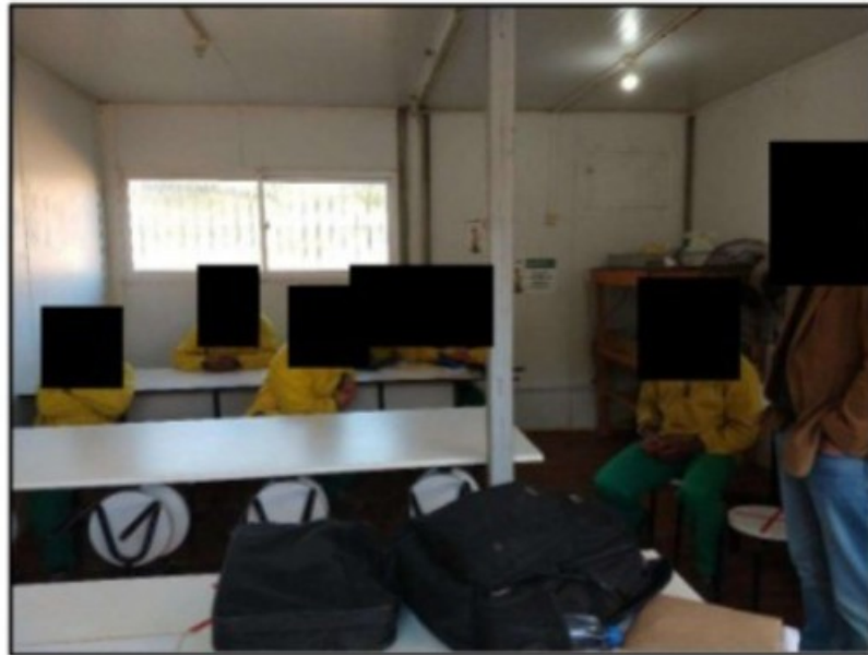
Imagem acima: Conversa com os trabalhadores no refeitório da obra.