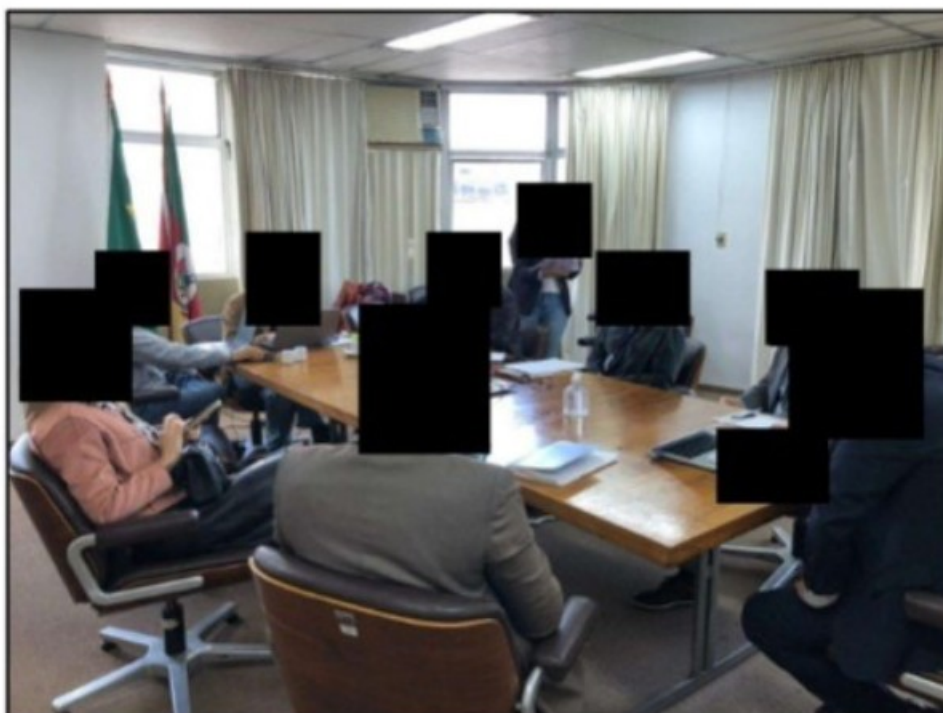
Imagens acima: Integrantes do GEFM em reunião na SRTE/RS com os advogados representantes da MRV.

verbas rescisórias perante a equipe fiscal. Caso o trabalhador já estivesse desligado e já retornado ao seu local de origem, a rescisão contratual deveria ser refeita e as diferenças creditadas em conta em nome do trabalhador, e comprovada por meio do “Comprovante de Depósito Bancário”.