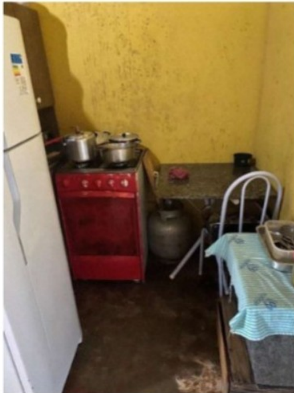
Foto 3- Fogão e botijão de gás dentro do alojamento.

No outro lado da estrada vistoriamos o alojamento que eles chamam de baia, onde encontramos o quarto utilizado pelo trabalhador [REDACTED] e sua esposa, neste além do fogão de quatro bocas, constatamos um botijão de gás liquefeito de petróleo (GLP) acomodado dentro do cômodo. Cumpre destacar que tal situação acarretava riscos de vazamento, incêndio e explosão decorrente do armazenamento de gás GLP.