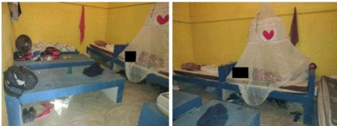
Fotos 4 e 5- Interior do alojamento sem armários individuais.

Verificamos nos cômodos do alojamento a ausência de um local adequado para a guarda das roupas e outros objetos dos trabalhadores. Os pertences dos empregados do alojamento feminino e masculino não raro estavam deixados sobre suas camas ou pendurados nas paredes dos quartos que ocupavam. Desta forma o empregador em epígrafe contraria a NR-31 conforme abaixo: " Item 31.23.5.1 Os alojamentos devem: b) ter armários individuais para guarda de objetos pessoais;"