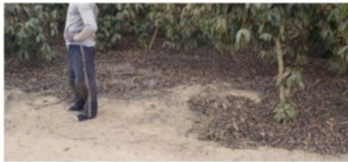
Fotos 6 e 7- Trabalhadores sem botas em atividades laborais.

Ficando constatado que a empresa atuada deixou de exigir que os trabalhadores utilizassem o referido equipamento de proteção individual, deixando de obedecer ao comando contido no artigo 13 da Lei nº 5.889/1973, combinado com o item 31.20.1.2 da NR-31, com