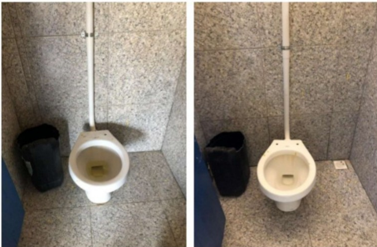
Fotos 1 e 2- Banheiros no alojamento sem papel higiênico.

feminino. O alojamento inteiro era um prédio de alvenaria, com quartos no meio e banheiros coletivos nas pontas de um lado feminino e de outro masculino. Eram umas cinco bacias sanitárias e cinco chuveiro por banheiro, onde verificamos que não havia papel higiênico em nenhum deles. Desta forma o empregador em epígrafe contraria a NR-31 conforme abaixo: "Item 31.23.3.2 As instalações sanitárias devem: d) dispor de água limpa e papel higiênico."