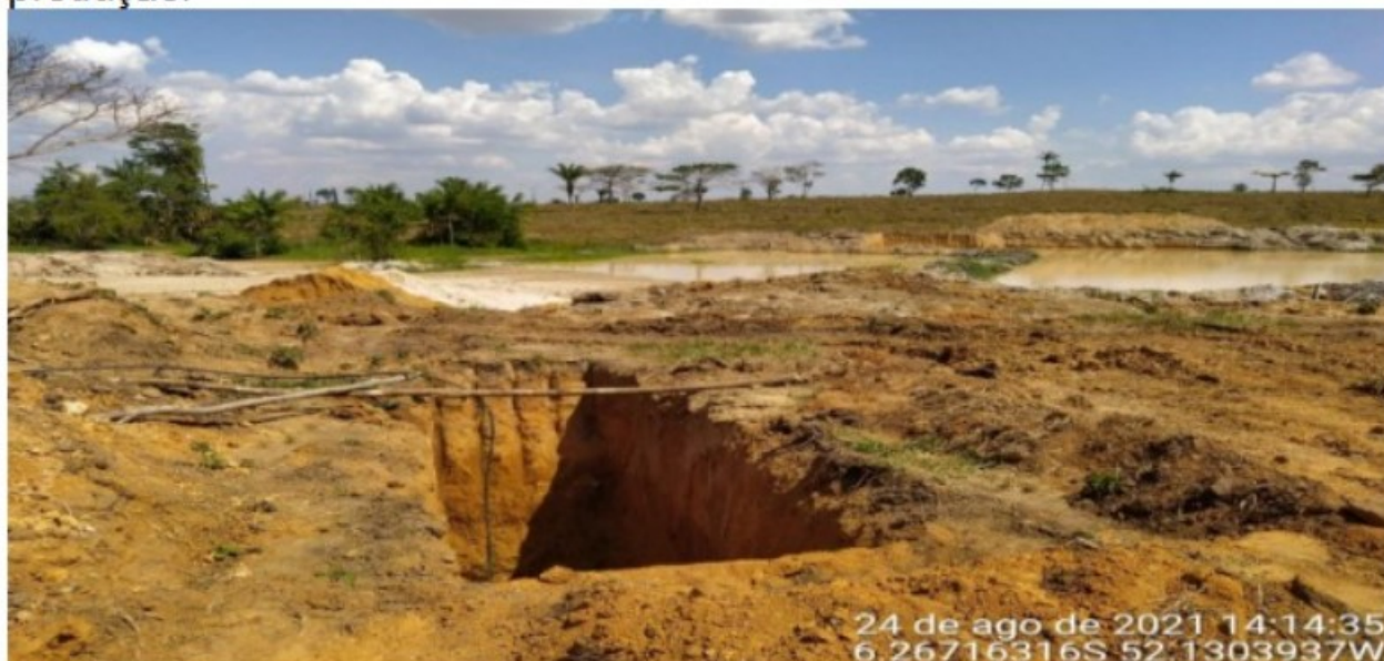
Poço de captação de água destinada a todos os fins: beber, cozinhar, lavar, e outros.

É importante salientar que a água consumida pelos empregados apresentava coloração turva e odor fétido, sendo sua coleta feita em poço que não mantinha proteção contra o carreamento de águas das chuvas, em ambiente com a presença de rejeito da atividade de mineração e circulação de gado bovino, potencializando a possibilidade de contaminação pelos dejetos que espalham nos arredores da área de produção.