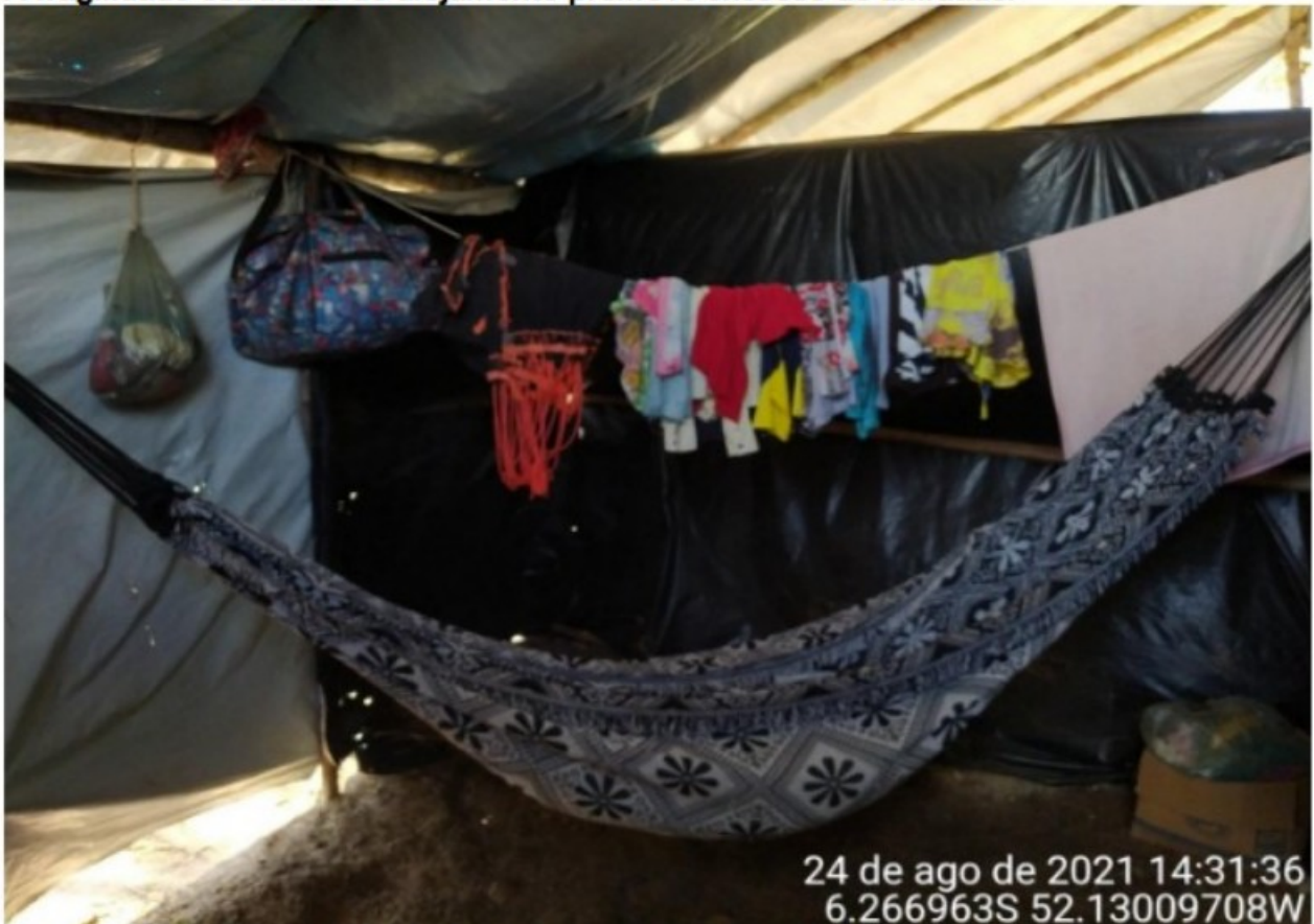
A forma de guardar objetos pessoais facilit a proliferação de insetos e animais peçonhentos.