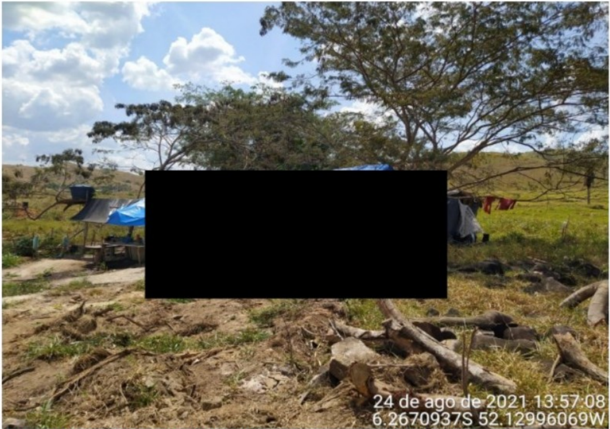
A fragilidade estrutural do alojamento promove excesso de umidade.