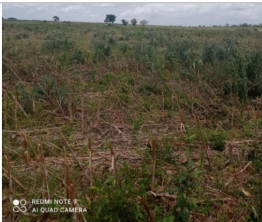
Frente de trabalho. Não havia banheiros nesse local.

Nesse local não existia instalações sanitárias, pelo que, conforme informado pelos trabalhadores citados, tinham que fazer suas necessidades em campo aberto, no meio da vegetação que restou da plantação de milho.