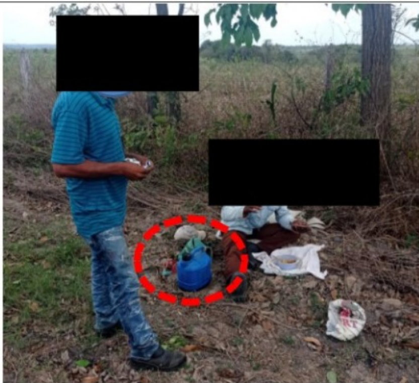
Recipiente térmico com água que os trabalhadores levavam de suas residências. Não havia copo no local.

O fornecimento de água potável e refrigerada é de suma importância para garantir a hidratação do corpo humano, para o bom funcionamento dos rins, para prevenção de infecções urinárias, dentre outros benefícios. É importante ressaltar que os catadores de espigas de milho executam suas atividades em campo aberto, com movimentos repetidos do tronco e coluna e dos braços, expostos aos raios solares, apresentando, conforme verificado na inspeção, intensa sudorese. Portanto, o consumo de água fresca assume importância vital.